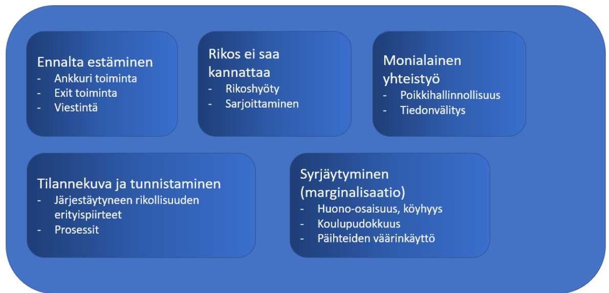
Kuvio 5: Tietoperustan pohjalta esiin nousseet teemat (Kokko & Liikala 2020)

Haastattelujen avulla pyrittiin saamaan niin sanottua pehmeää tietoa eli haastateltavien omakohtaisia kokemuksia aihepiiristä, jota pystytään hyödyntämään ilmiön tunnistamismuotojen luomisessa. Haastatteluista saatava materiaali tulee olemaan tekstimuotoista. Haastatteluissa pyrittiin myös saamaan haastateltavilta tietoa, miten heidän mielestään katujengien toimintaa voidaan tunnistaa ja torjua, sekä tärkeää oli saada esille haastateltavien omakohtaista kokemusta samankaltaisesta ennalta estävästä toiminnasta. Kokonaisvaltaisemman ymmärryksen saavuttamiseksi tarkoitus oli saada esimerkkejä sekä onnistuneista että epäonnistuneista suorituksista.