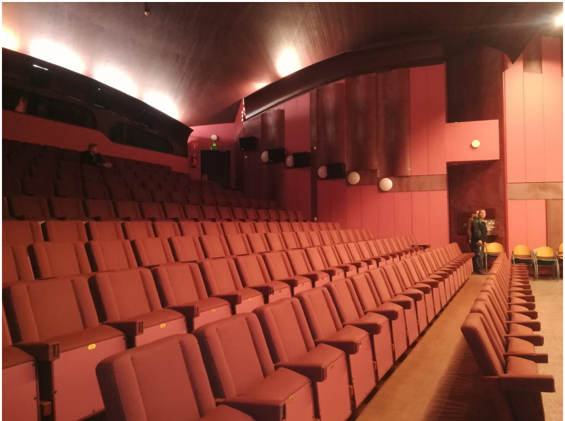
Kuva 2: Hervannan elokuvateatterin isomman salin katsomo