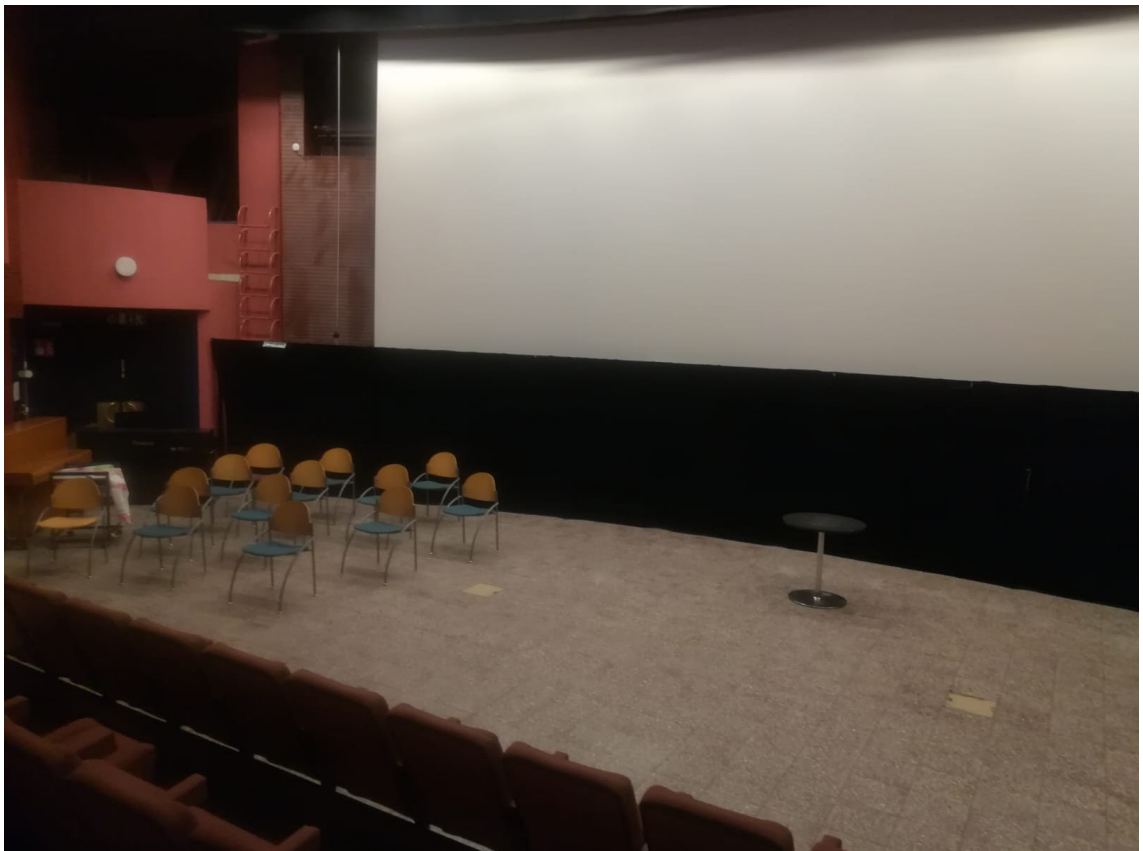
Kuva 3: Hervannan elokuvateatterin isomman salin lava