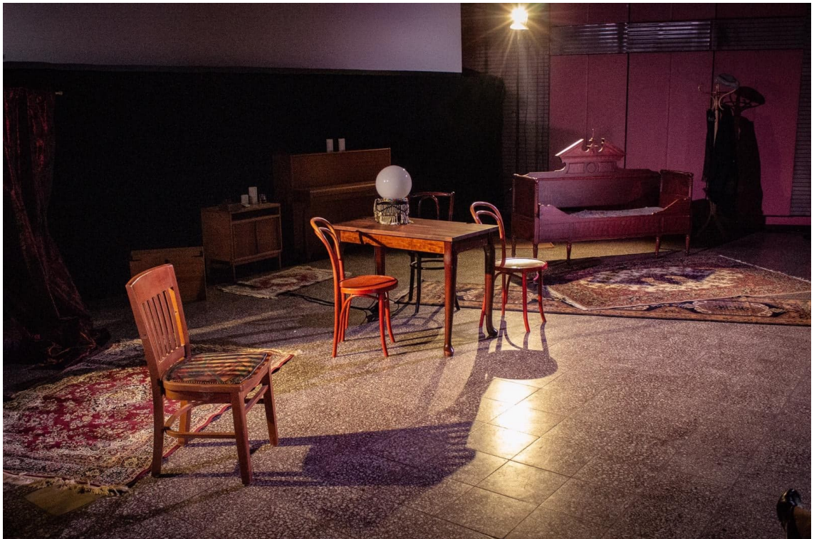
Kuva 4: Hervannan vanha elokuvateatteri. Oopperan lavasteet.