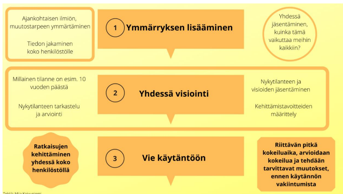
Kuvio 1. Kehittämisen toimintamalli Sastamalan nuorisopalveluiden kehittämis-työssä.

Olen jakanut tämän kehittämisprosessin kolmeen osaan, jotka muodostavat kehittämissen toimintamallin (Kuvio 1). Osat ovat: ymmärryksen lisääminen, yhteinen visiointi ja käytäntöön vieminen. Omien havaintojeni mukaan olen huomannut, että kehittämisprosessin onnistumiseen vaikuttaa eniten kehittämistarpeen ymmärtäminen. Kun koko henkilöstö ymmärtää, mistä kehittämistarve on lähtöisin ja millaiset asiat vaikuttavat siihen, että muutoksia on tehtävä, on kehittämiseen suhtautuminen helpompaa ja positiivisempaa. Kun henkilöstölle jaetaan tietoa ja kehittämisprosessi on avoin, on siihen vaikuttaminen myös helpompaa. Tässä kehittämistyössä keskiössä on ollut yhteinen kehittäminen, mikä on koko tämän innokylän innovaatiomallin ydin. Olen kokenut sen erittäin merkittäväksi kehittämisprosessin onnistumisen kannalta. Kehittämistä on tehty pitkäjänteisesti yhdessä henkilöstöä kuunnellen ja on annettu mahdollisuus myös negatiivisten tunteiden ja pelkojen sanoittamiseen, mitä muutosprosessi on aiheuttanut. Kehittämisprosessissa on käytetty aikaa henkilöstön kuulemiseen, yhteisten kehittämispäivien lisäksi on ollut mahdollisuus myös yksityiseen keskusteluun ja tietoja on kerätty henkilökohtaisilla kyselyillä. Käytäntöön viemisessä on ollut riittävän pitkä kokeiluvaihe, mikä on kestänyt koko syksyn 2020. Riittävän pitkän kokeiluvaiheen aikana ollaan voitu tehdä havaintoja ja kerätä palautetta uusista toimintatavoista, toimintojen muokkaamiseksi.