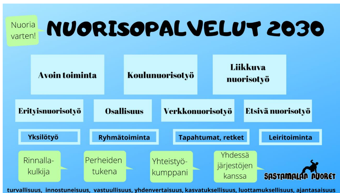
Kuvio 3. Sastamalan nuorisopalvelut, nuorisopalvelut 2030 -malli

Tämän kehittämistyön tavoitteena oli luoda malli siitä, millaisia palveluita nuorisopalvelut järjestävät vuonna 2030. Mallin muodostumisen pohjana oli palveluverkkoselvityksessä tehdyt linjaukset monipalvelukeskusajattelusta, liikkuvasta palvelusta, sähköisten palveluiden lisäämisestä ja nuorisopalveluiden henkilöstön visiot vuoden 2030 nuorisotyöstä Sastamalassa. (Palveluverkkoselvitys 2030 2020,52) Ehdotus Sastamalan nuorisopalvelut 2030 –mallista alla olevassa kuviossa (Kuvio 3).