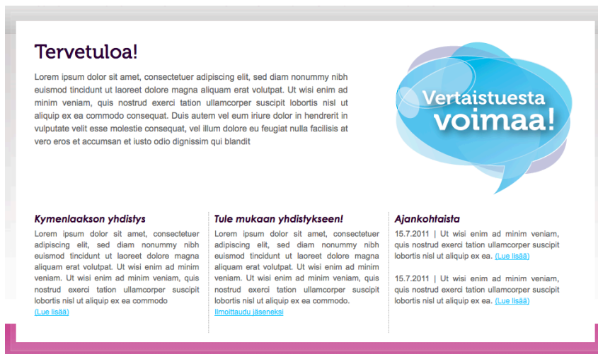
Kuva 19. Kotisivun sisältöalue.

Sisäsivuilla sisältöalue on jaettu kahteen osioon (kuva 20). Vasen palsta, joka on suurempi, on varattu aihealueen informatiiviselle tekstile. Oikean puoleisen, kapeamman palstan sisältö vaihtelee eri sivuilla. Yhdistyksen toiminnasta kertovalla sivulla oikealla palstalla on pieni kuvagalleria, jossa on kuvia yhdistyksen tapahtumista ja kokouksista aina yhdistyksen alkuajoista lähtien. Kuvat suurenevät niitä klikkaamalla. Sairauksista kertovalla sivulla oikeassa palstassa on tietoiskuja, jotka on sijoitettu kotisivullakin käytetyn kuvituskuvan yhteyteen. Tietoiskut kertovat faktoja liittyen sairauksiin. Ne myös elävöittävät sivua ja tuovat sinne väriä. Ajankohtaista-sivulla oikeaan palstaan on lueteltu sivun kaikki artikkelit. Luettelossa on artikkelin päivämäärä, artikkelin nimi ja lyhyt kuvaus artikkelin sisällöstä. Kaiken perässä on vielä linkki, josta pääsee suoraan artikkeliin. Näin käyttäjän ei tarvitse vierittää sivua alaspäin löytääkseen etsimänsä. Yhteystiedot-sivulla on lomake, jonka täyttämällä voi ilmoittautua yhdistyksen jäseneksi.