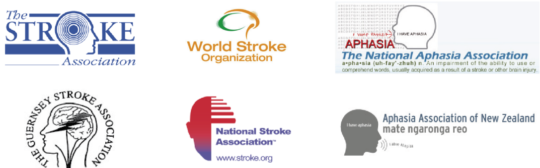
Kuva 3. Ulkomaisten afasia- ja aivohalvausyhdistysten logoja.

on, The National Aphasia Association ja Aphasia Association of New Zealand. Neljä yhdistyksistä keskittyy aivohalvauksiin ja kaksi afasiaan. Huomasin, että ulkomaisissa logoissa ei ole kovinkaan monipuolista tarjontaa (kuva 3).