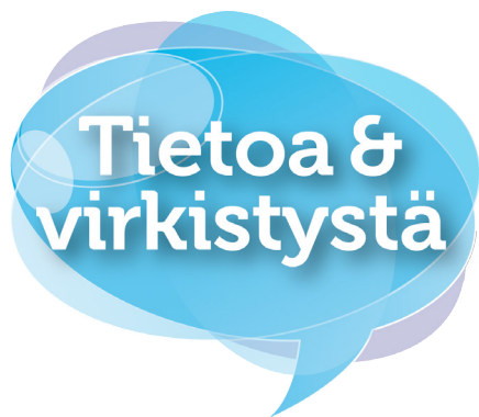
Kuva 23. Sininen puhekupla. Kuvituskuva.

Kuvituskuvaan ladottava teksti on valkoista, ja fonttina käytetään Museota tai Museo Sansia. Lisäsin tekstin taakse pienen varjon luomaan kolmiulotteisuutta, ja erottamaan tekstiä paremmin taustasta. Sinisestä puhekuplasta tuli mielenkiintoinen elementti, ja verkkosivujen lisäksi sillä voidaan elävöittää muitakin materiaaleja kuten esitettä. Puhekuplan päälle voi latioa erilaisia iskulauseita tai tietoiskuja.