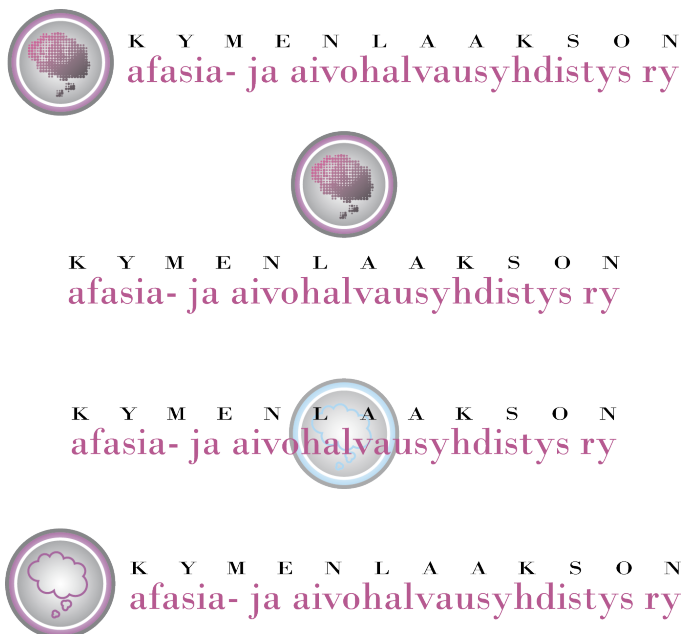
Kuva 11. Logon sommittelua. Pyöreä tunnus.

Tein erilaisia sommittelukokeiluja pyöreän tunnuksen ja kahdelle riville jaetun tekstin kanssa (kuva 11). Sommittelin myös tekstiä pelkkien ajatuskupliin kanssa (kuva 12). Asiakas toivoi yhdistyksen nimen ympyrän sisälle niin, että se olisi ulomman ja sisemmän kehän välissä. Tekstin pituuden vuoksi aseteltu ympyrän muotoon oli hankalaa ja logo muuttui epäselväksi ja vanhanaikaiseksi. Sen käyttökelpoisuus huononi, koska logoa ei olisi voinut käyttää kovinkaan pieneksi skaalattuna. Asiakas päättikin sitten hylätä koko ympyrän mallisen logoehdotuksen.