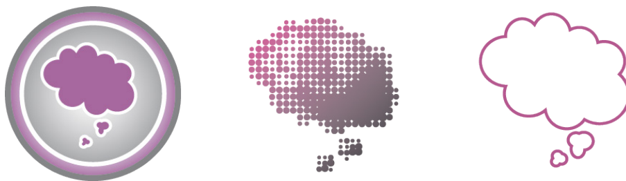
Kuva 10. Asiakasta miellyttävät tunnus vaihtoehdot.

Suunnittelin erilaisia ajatuskuplia: yksinkertaisia, nykyaikaisia, taustalla, ilman taustaa, pelkällä ääriiviivalla tehtyjä ja siluettimaisia. Keskustelin asiakkaan kanssa vaihtoehtoja, ja asiakas valitsi eniten itseään miellyttävät ehdotukset, joita voisi vielä kehittää eteenpäin. Päällimmäisiksi nousivat vaihtoehdot, joissa ajatuskupla on pallon sisällä, erikokoisista palloista muodostettu ajatuskupla ja ajatuskupla, joka koostuu vain ohuesta ääriviivasta (kuva 10).