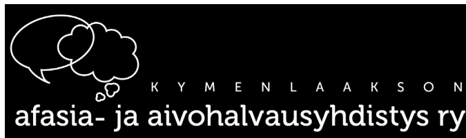
Kuva 15. Logon negatiiviversio.

Logosta on myös negaversio (kuva 15), jossa tekstit ja tunnus on muutettu valkoiseksi. Negaversiota käytetään värillisillä ja mustilla pohjilla, jotta logo erottuisi paremmin. Logoa käytetään varmasti myös sellaisissa materiaaleissa, jotka eivät ole yhdistyksen omia ja tällöin pohjana saattaa olla jokin muu väri kuin mikä on määritetty käytettäväksi värillisen logon kanssa. Negaversio on hyvä tähän tarkoitukseen, ja logo näyttää hyvältä ja edustavalta kaikissa materiaaleissa.