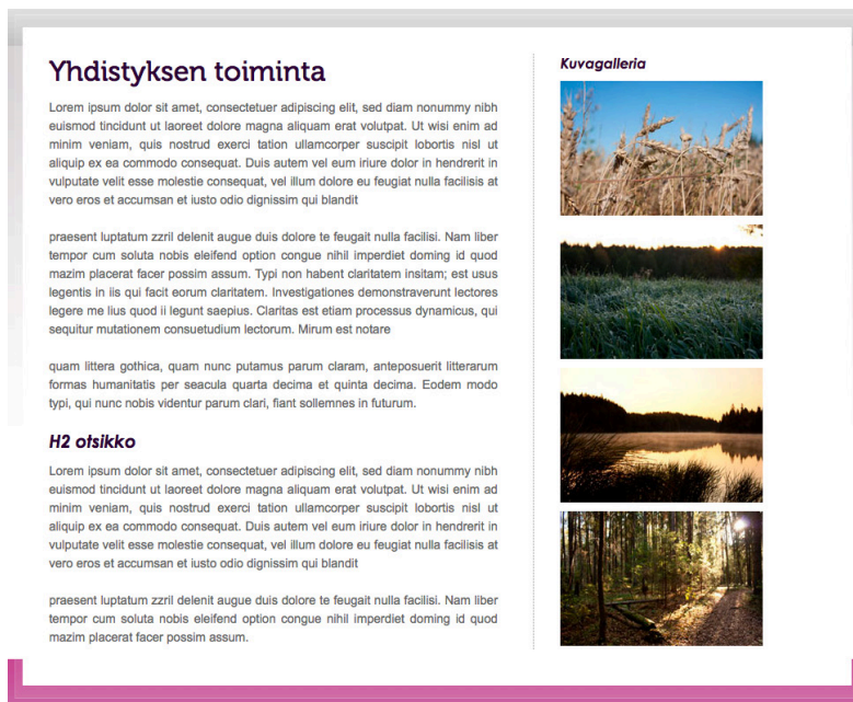
Kuva 20. Sisäsivun sisältöalue.

Useasti ajatellaan, että vaihtoehdot internetissä käytettävistä fonteista on vähäisiä. Internet turvalliset fontit ovat sellaisia, jotka löytyvät yleensä jokaisen käyttäjän tietokoneelta. Jos käyttäjällä ei ole internetsivuilla sijoitettua fonttia, se ei näy käyttäjän selaimessa vaan korvautuu toisella fontilla. Tämän vuoksi useilla verkkosivuilla näkee käytettävän samoja fontteja. (Cranford Teague 2010, 52, 56.) Nykyään on kuitenkin kehitetty menetelmiä, joilla voidaan korvata fontteja niin, että ne näkyvät myös käyttäjän selaimessa vaikka hänellä ei olisikaan kyseistä fonttia asennettuna tietokoneelle. Käytin asiakkaan sivuilla yhtä näistä fontin korvausmenetelmistä, @font-facea, jotta sain pääotsikoihin käyttöön logossakin käytetyn Museo-fontin. Font-face -menetelmä toimii niin, että fontti ladataan selaimen, ja se otetaan käyttöön www-sivuilla @font-face -määrittelyllä (Korpela 2010, 145). Tällä toiminnolla voidaan käyttää kaikkia True Type ja Open Type -fontteja, kunhan vain tarkistaa fontin lisenssistä, että käyttö on sallittua (Cranford Teague 2010, 97). Museolla sain sivujen typografiaan elävyyttä, jolloin kaikki teksti ei näyttäisi samalta. Museo oli muutenkin selvä valinta pääotsikoihin, jotta Kymenlaakson afasia- ja aivohalvausyhdistyksen visuaalinen ilme pysyisi yhtenäisenä.