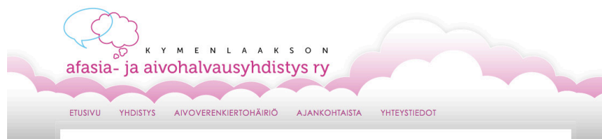
Kuva 17. Ylätunniste, logo ja päänavigaatio.

Sivuston ylätunniste on kiinteä, joten se on samanlainen läpi koko sivuston. Ylätunnisteen taustalle valitsin taustakuvaksi pilviä (kuva 17). Idea pilvistä sai alkunsa tunnuksen ajatuskuplasta ja sen muodoista. Pidin pilvien ja ajatuskuplan yhteyttä selkeänä, koska ajatuskupla on malliltaan pilven kaltainen. Aluksi pilvirivejä oli vain yksi ja värinä oli sama purppura, joka esiintyy myös logossa. Alatunniste eli footer oli myös saman värinen. Vaikutelma oli kuitenkin liian naisellinen ja raskas. Halusin sivuista neutraalimmat värimaailmaltaan, koska sivustolla vieraillee yhtä paljon miehiä kuin naisiakin. Monien kokeilujen jälkeen päädyin kahteen pilviriviin, jotka ovat erivärisiä ja sävyiltään vaaleampia. Väreiksi valikoitui vaalea purppura takana olevaan ja harmaa etu alalla olevaan pilviriviin. Muutin myös alatunnisteen värimaailmaa vaaleamman sävyiseksi (kuva 18). Näillä valinnoilla yhdistyksen logo ja sisältöalue tulivat esille paremmin.