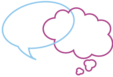
Kuva 13. Valmis tunnus.

Tunnuksen muutettua muotoaan tekstin asettelu sen kanssa piti suunnitella uudelleen. Tunnusta ei enää voinut asettaa toiseen päähän tekstirivejä, koska se ei olisi istunut sinne sulavasti. Kokeilin asettaa tunnuksen myös tekstin yläpuolelle keskelle, mutta tässä asetelmassa tunnus vaikutti liian irralliselta. Aloin miettiä tekstin muotoilua uudelleen. Kymenlaakson-sana levitettyinä koko alarivin mitalle näytti muutenkin liian hajanaiselta.