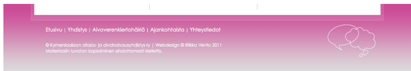
Kuva 18. Alatunniste.

Navigaation tarkoitus on auttaa käyttäjää löytämään tarvitsemansa tiedon ja kerto- maan missä käyttäjä on sivustolla. Hyvin tehty navigaatio kertoo sivuston sisällöstä ja opettaa käyttämään sivustoa. Navigaation on hyvä olla kiinteä elementti, joka on sa- manlainen ja samassa kohdassa läpi sivuston. Näin käyttäjä tietää olevansa edelleen samalla sivustolla. (Krug 2006, 59–62.) Ylätunniste on hyvä paikka, mihin päänavi- gaatio voidaan sijoittaa (Horton – Lynch 2009). Valitsin päänavigaatiolle näkyvän ja keskeisen paikan ylätunnisteessa logon alapuolelta. Navigaation linkit kulkevat vaaka- tasossa vasemmalta oikealle. Annoin linkeille paljon tilaa ympärille, jotta ne erottaisi paremmin toisistaan. Lisäsin myös alatunnisteeseen oman linkkirivin pitkien sivujen varalta. Tällöin käyttäjän ei tarvitse rullata sivua takaisin ylös päästäkseen klikkaa- maan itsensä seuraavalle sivulle. Alapalkin oikeassa laidassa on asiakkaan tunnus, jos- ta pääsee helposti takaisin etusivulle.