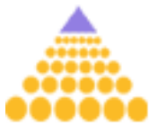
Kuva 2. Aivoliiton vanha logo.

Koska suomalaiset yhdistykset käyttävät suurimmaksi osaksi samaa Aivoliiton logoa, jouduin laajentamaan tutkimustani ulkomaalaisten yhdistyksien logoihin ja ilmeisiin. Otin vertailuun mukaan kuusi ulkomaista yhdistystä: The Stroke Association, The Guernsey Stroke Association, World Stroke Organization, National Stroke Associati-