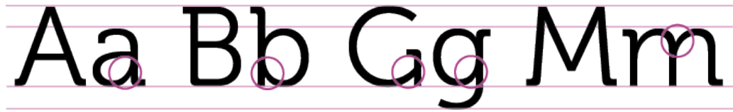
Kuva 16. Museo-fontin vahvuusvaihtelut.

fontti on päätteetön eli groteski (Itkonen 2007, 11). Museo on paksu fontti, jossa viivan vahvuuden vaihtelevuutta ei havaitse helposti. Gemenoissa eli pienaakkosissa vaihtelevuus on ilmeisempää kuin versaaleissa kirjaimissa eli suuraakkosissa. Viivan vahvuus on ohuempaa kirjaimen keskivaiheilla (kuva 16).