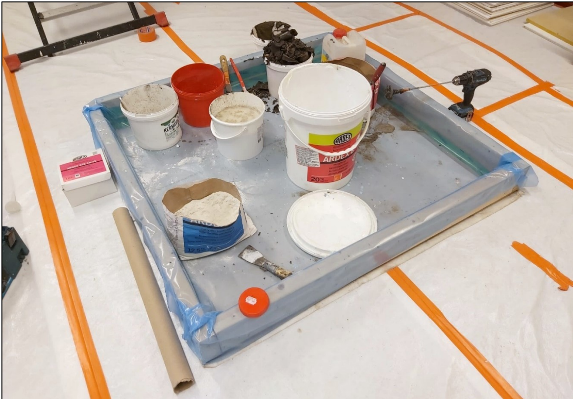
Kuva 2. Sekoituskaukalo vesisekoitteisille rakennusmateriaaleille.

Mikäli varotoimista huolimatta vesivahinko pääsisi syntymään, voidaan rakenteita kuivata luvussa 3.7 Rakenteiden kuivattaminen kuvatulla tavalla.