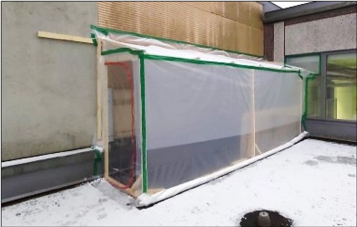
Kuva 4. Paikallinen sääsuoja julkisivun rakenneavauksen kohdalla.