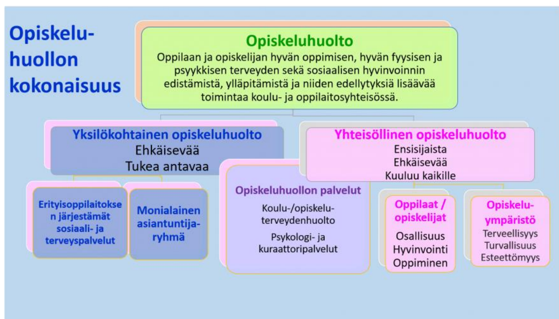
Kuva 1. Opiskeluhoollon kokonaisuus (Opiskeluhoolto 2020)

Opiskeluhoollolla tarkoitetaan opiskelijan hyvän oppimisen, hyvän psyykkisen ja fyysisen terveyden sekä sosiaalisen hyvinvoinnin edistämistä ja ylläpitämistä sekä niiden edellytyksiä lisäävää toimintaa oppilaitosyhteisössä (kuva 1). Opiskeluhooltoja toteutetaan monialaisena yhteistyönä opetuksen järjestäjän, sosiaali- ja terveystieteiden sekä opiskelijan ja huoltajien kanssa. Opiskeluhoollon palveluita ovat kuraattori- ja psykologipalvelut sekä opiskeluterveydenhuolto. (THL 2017.) Opiskeluhoolto on sekä perusopetuslaissa tarkoitettu oppilashuolto että lukiolaissa ja ammatillisesta koulutuksesta annetussa laissa tarkoitettu opiskelijahuolto. Oppilas- ja opiskelijahuoltolaki (1287/2013) säätelee opiskeluhoitoa. Lain tarkoituksena on edistää opiskelijoiden ja oppilaitosyhteisön kokonaisvaltaista terveyttä ja hyvinvointia. Opiskeluhoitolaisissa puhutaan niin yksilöllisestä kuin yhteisöllisestä opiskeluhoollosta.