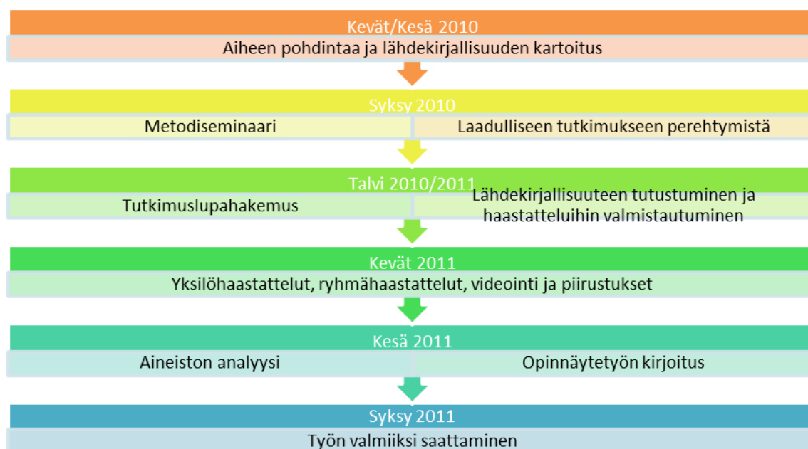
TAULUKKO 1. Tutkimusprosessin kuvaus