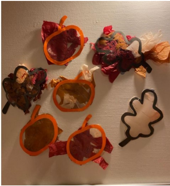
Kuvio 4: Syksyinen kädentyö

Avasin toimintamme tarkoitusta lapsilistaankin, jotta vanhemmat pääsisivät näin osaksi lapsensa toimintaa ja saisi tiedon opituista taidoista. Se, että avasin toimintaamme lapsilistaan, tukee myös tiimimme jäsentä, joka ei ollut mukana toteuttamassa toimintaa pääsee hänkin jyvälle mitä on tehty ja miten kyseinen lapsi on kokenut toiminnan. Usein kuuleekin vanhemmilta hyvää palautetta siitä, että on kerrottu päivän tapahtumista. Tämä osaa vanhempia kannustaa kotona ottamaan samoja asioita harjoitukseen. Heille ei välttämättä tule mieleen, kuinka monipuolisesti lapsi voikaan toimia tai kuinka monipuolisesti harjoittelee käyttämään erilaisilla materiaaleilla.