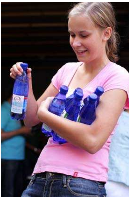
Kuva 2. Valmiita vesipulloja.