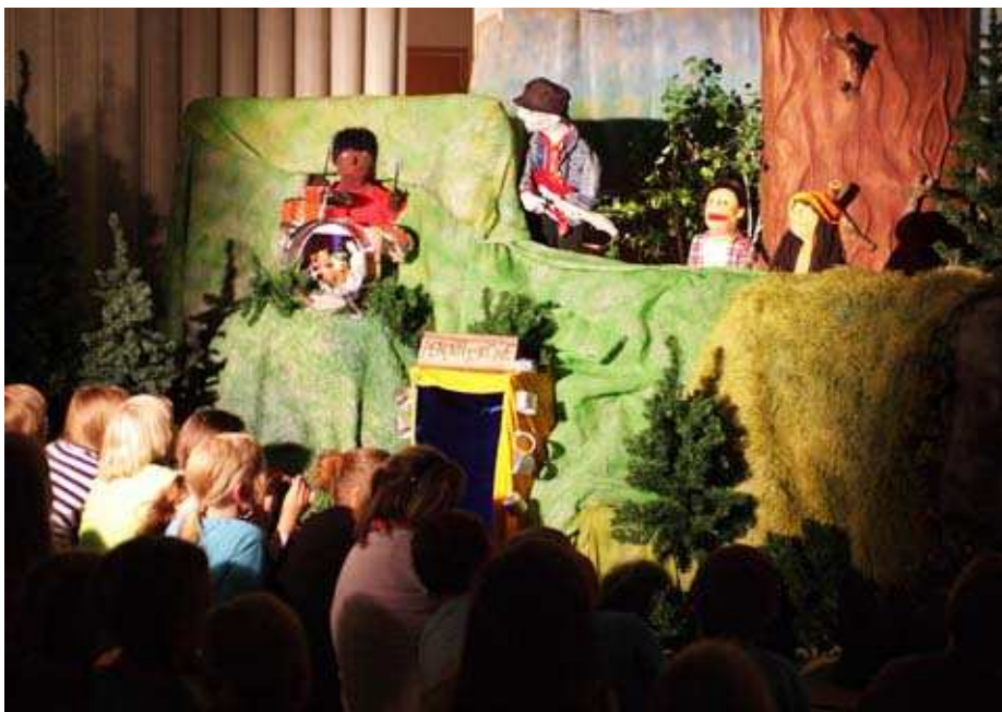
Kuva 15. Kotipuun nukketeatteriesitys Helluntaiseurakunnan ylisalissa.