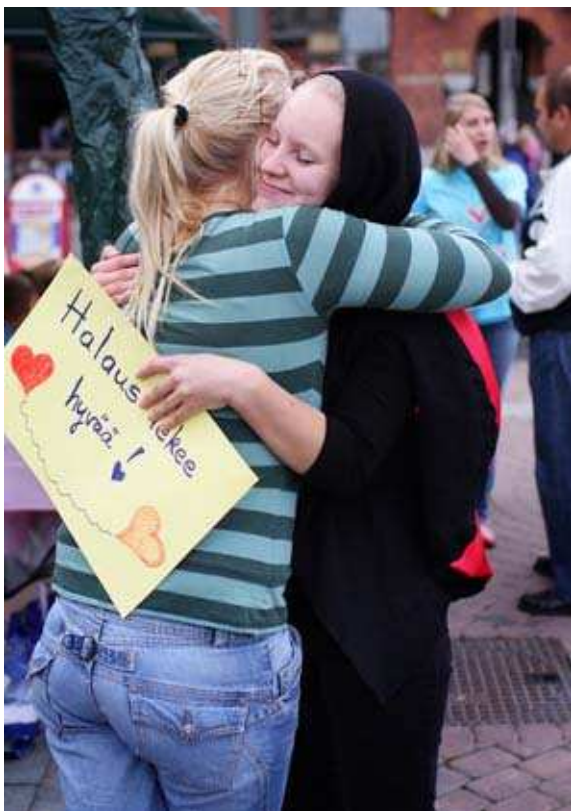
Kuva 5. Keskustorin halauspiste.