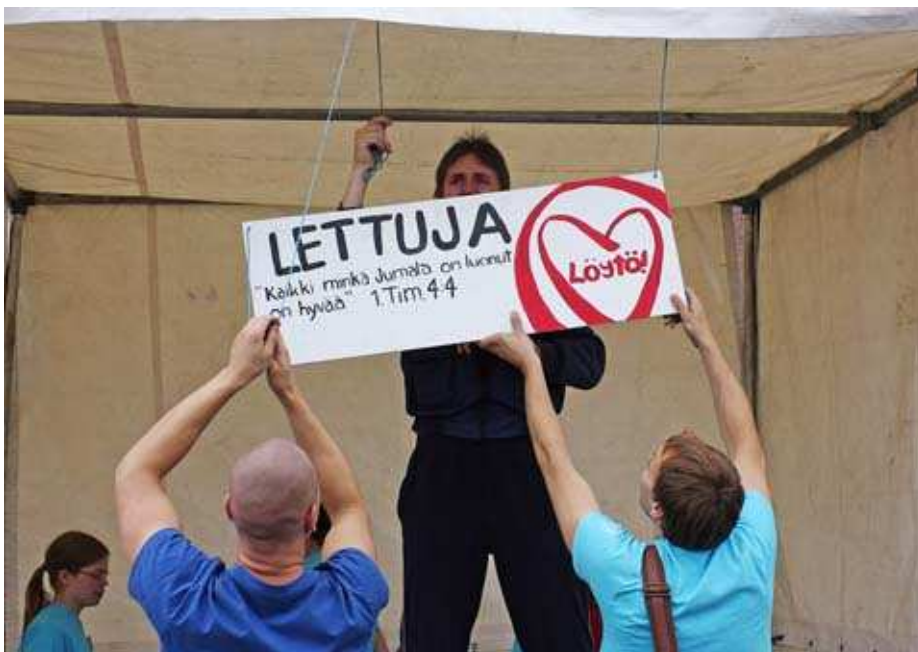
Kuva 7. Lettuteltan pystytys.