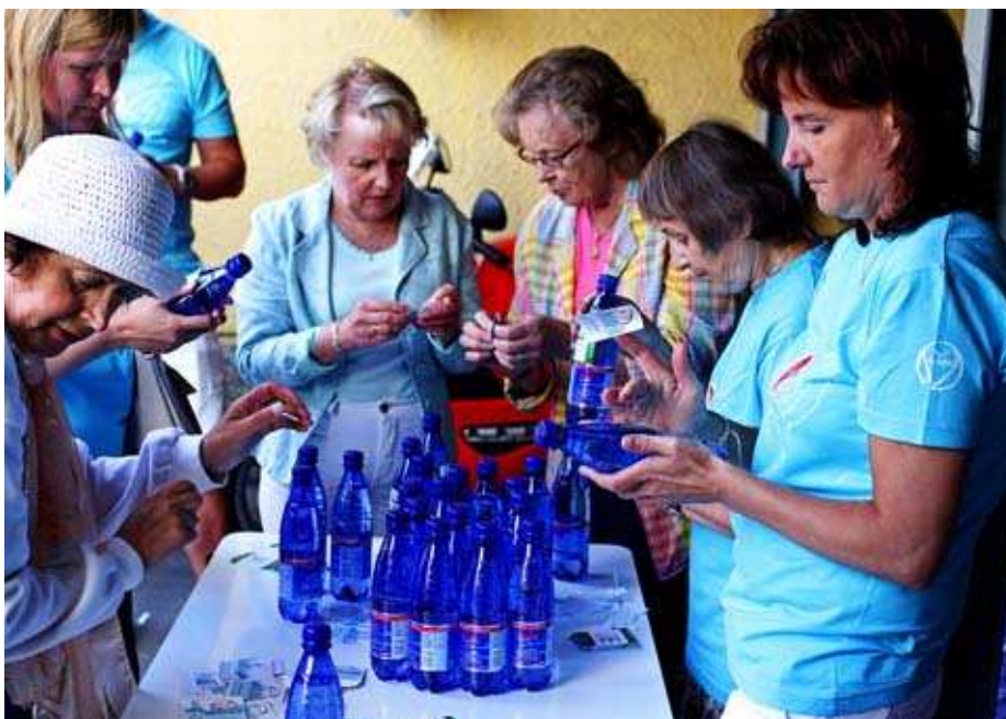
Kuva 1. Vesipullotalkoot.