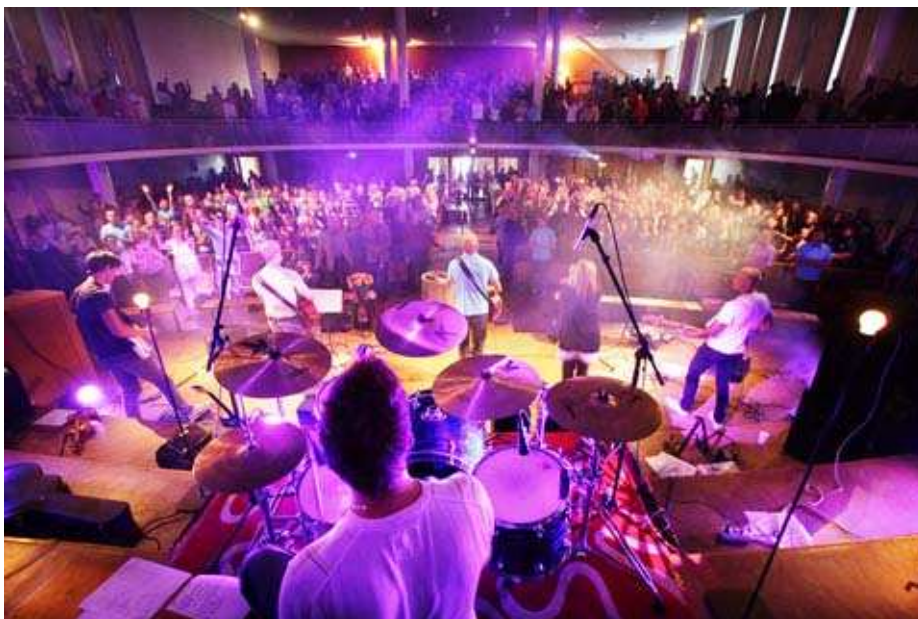
Kuva 19. Iltatilaisuus Tampereen Helluntaiseurakunnassa.