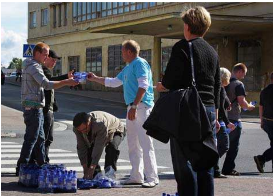
Kuva 6. Vesipullojen jakoa keskustassa.