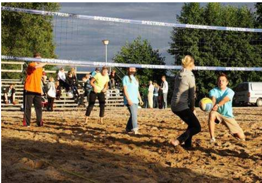
Kuva 12. Lentopalloturnaus Pyynikin rannassa.