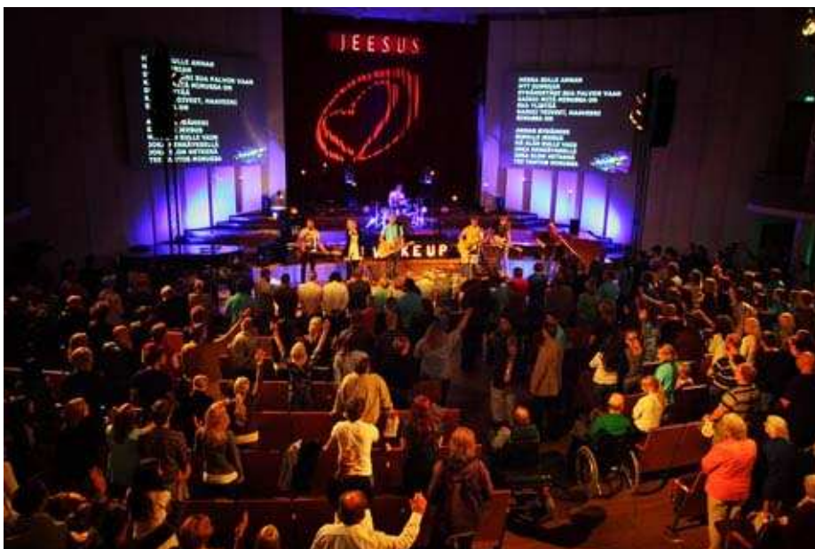
Kuva 20. Parantumisilta Tampereen Helluntaiseurakunnassa.