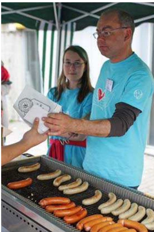
Kuva 10. Makkaranpaistoa Tesomalla.