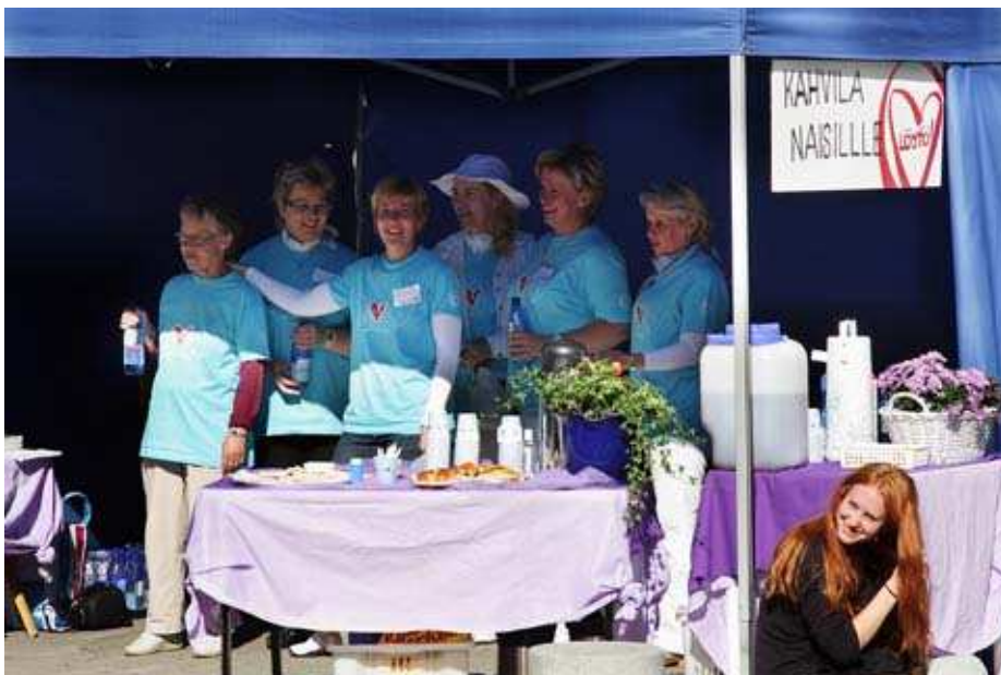
Kuva 13. Naisten kahviteltoa Kirkkokadulla.