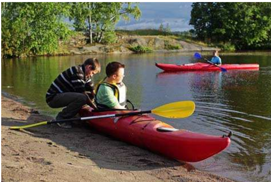
Kuva 11. Melontaa Pyynikin rannassa.