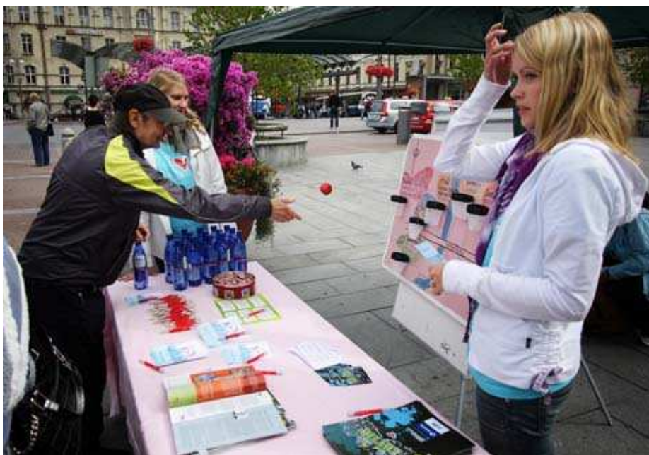
Kuva 4. Keskustorin infopiste.