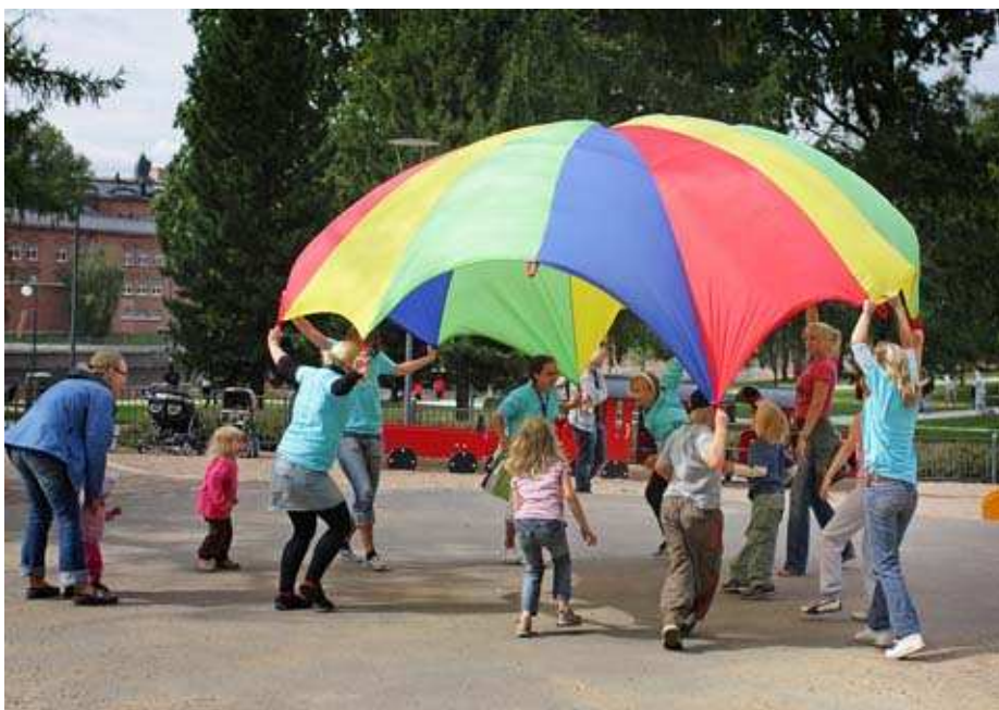
Kuva 14. Puhua lapsille Pikku kakkosen puistossa.