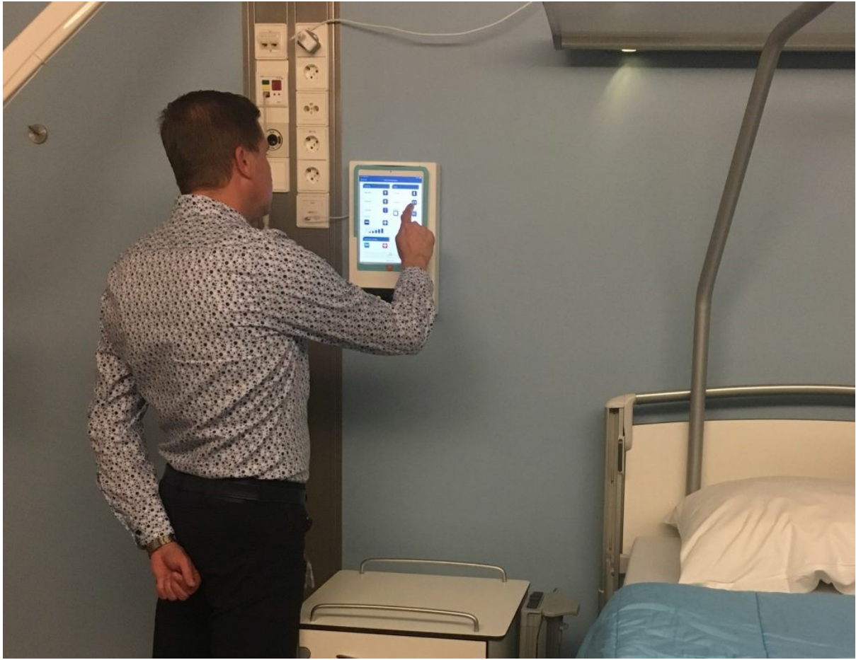
Potilaiden omatoimisuutta korostavat ratkaisut osallistavat potilaita, sekä heidän läheisiään, aktiivisuuteen.