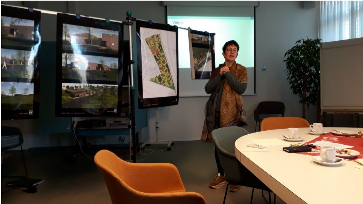
Glanan vierailulla kuulumme mm. uusista palveluasumisen ja muistisairaiden asumisen suunnitelmista.

Hollantilaisissa hoivapalveluissa korostuu ihmis- ja asiakaslähtöisyys. Vaikuttaa siltä, että myös omaiset ja läheiset, samoin kuin vapaaehtoiset, osallistuvat aktiivisemmin ikäihmisen elämään ja hoitoon kuin Suomessa. Palvelukeskus Glanan sisäpihalla käyskentelivät elävät kanat ja tänään ruokasalissa viihdytti klovni niin asukkaita kuin eri-ikäisiä vierailijoita.