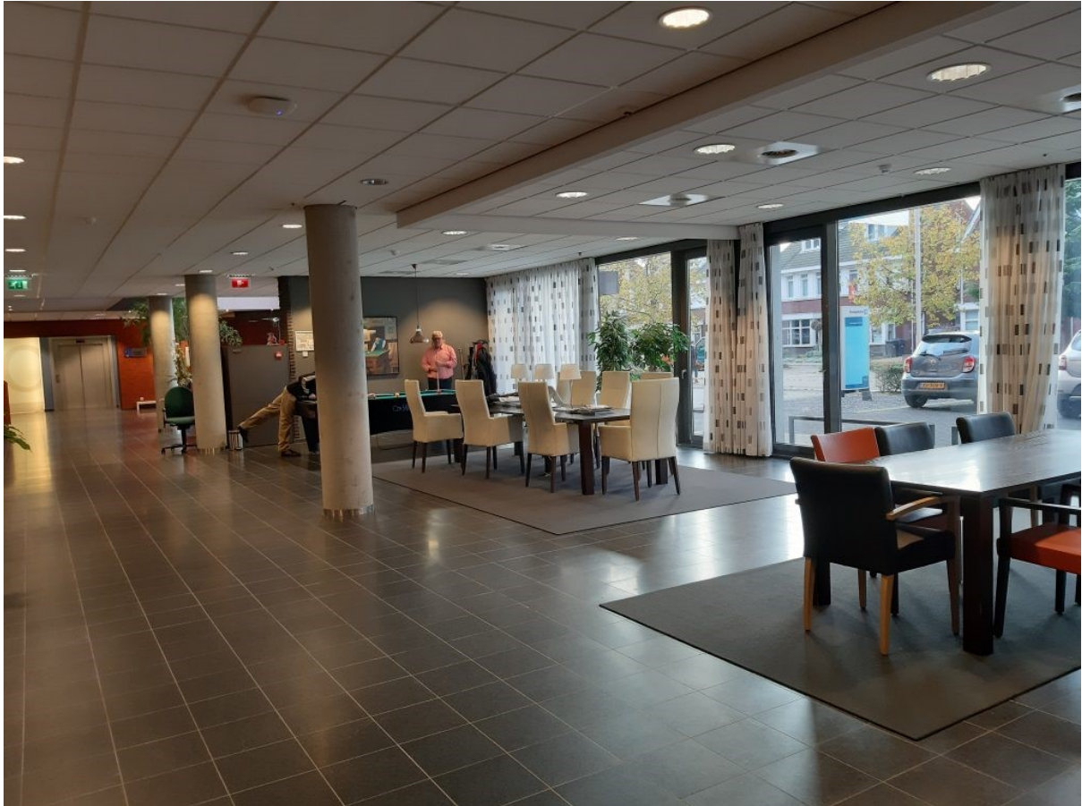
Hoogstaeten palvelutalon avara aula ihastutti.

Glanasta siirryimme Hoogstaeten palvelutaloon, jonka avarat ja valoiset aulatilat ihastuttivat. Tilat toimivat asuinalueen väestön kohtaamispaikkana, yhteisenä ”olohuoneena”. Asukashuoneissa lattiaan asti ulottuvat ikkunat mahdollistavat asukkaille laajat luontonäkymät. Apuvälineen kanssa kulkeminen tilasta toiseen on helppoa leveiden ovien ansiosta. Yhteistiloissa oleva biljardipöytä on miesasukkaiden aktiivisessa käytössä.