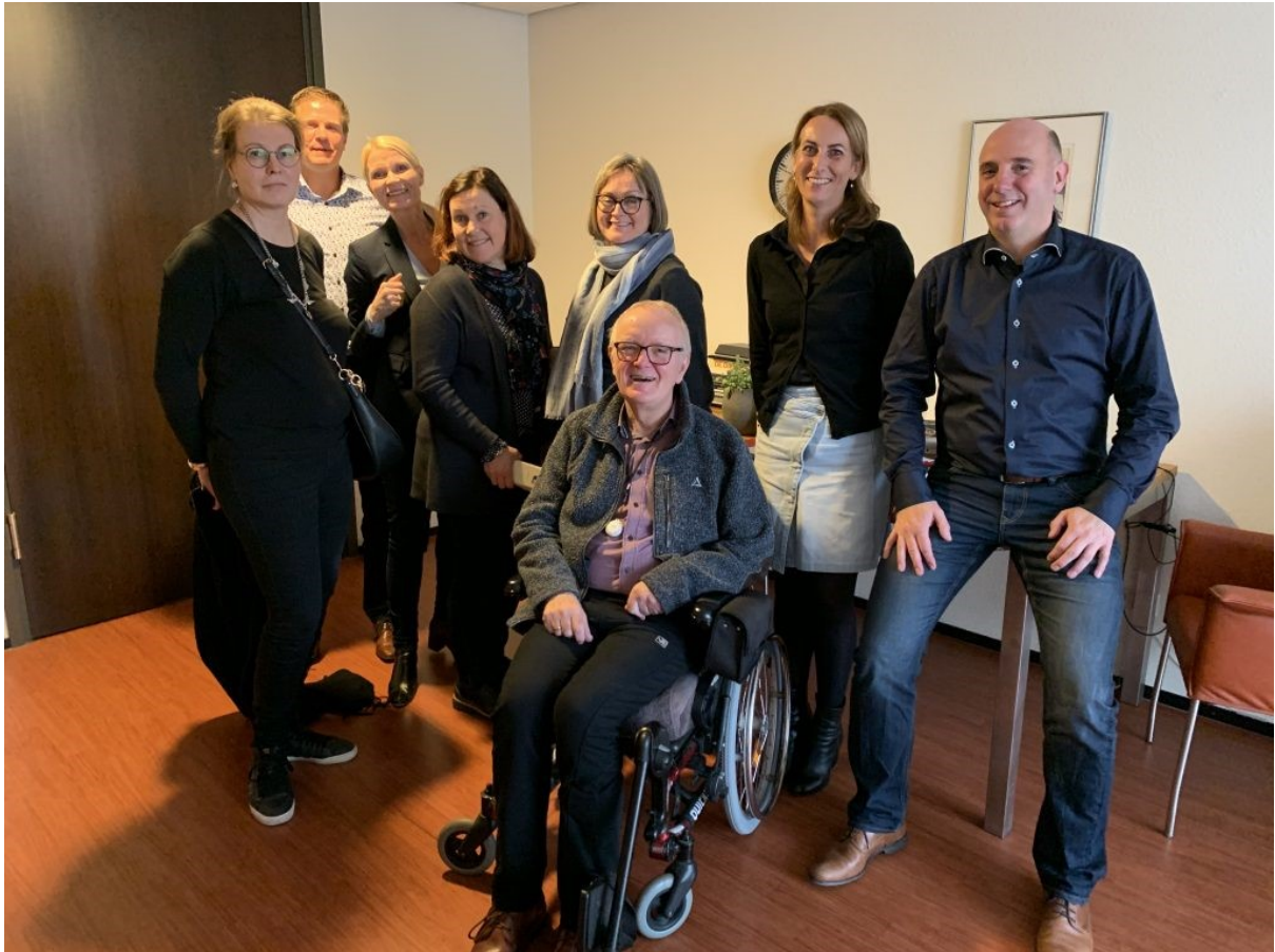
Iloinen ryhmäkuva Hoogstaeten asukkaan kanssa.

Hoitajapula on arkipäivää myös Hollannissa. Zuyderland tekee yhteistyötä alueen oppilaitoksen kanssa, jossa koulutetaan esim. maahanmuuttajia hoitola-alan tehtäviin. Vanhustyön houkuttelevuuden lisääminen sekä ratkaisujen löytäminen hoitajapulaan nousivat keskusteluissa sekä Suomea että Hollantia yhdistävinä, ajankohtaisina haasteina.