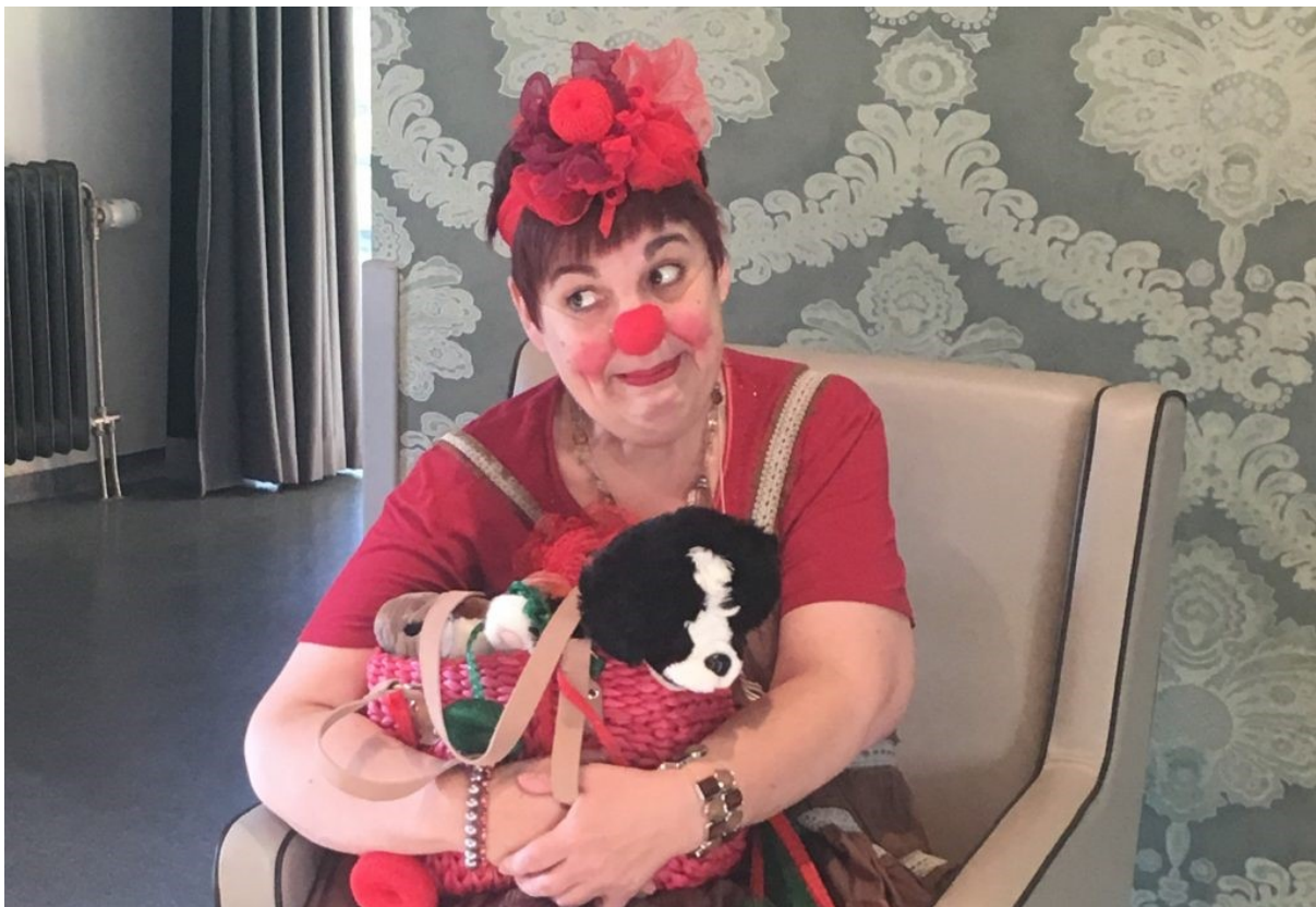
Glanassa palvelutalon klovni oli juuri valokuvattana vierailumme aikana.

Hollantilaisissa hoivapalveluissa korostuu ihmis- ja asiakaslähtöisyys. Vaikuttaa siltä, että myös omaiset ja läheiset, samoin kuin vapaaehtoiset, osallistuvat aktiivisemmin ikäihmisen elämään ja hoitoon kuin Suomessa. Palvelukeskus Glanan sisäpihalla käyskentelivät elävät kanat ja tänään ruokasalissa viihdytti klovni niin asukkaita kuin eri-ikäisiä vierailijoita.