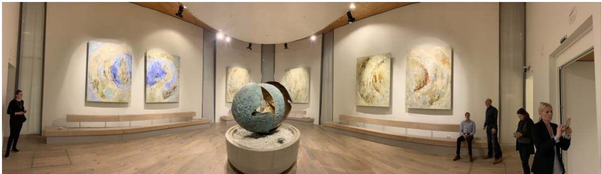
Sairaalan hiljentymishuone oli vaikuttava. Siellä pidettävät tilaisuudet on mahdollista saada kuuluviin myös potilashuoneisiin.