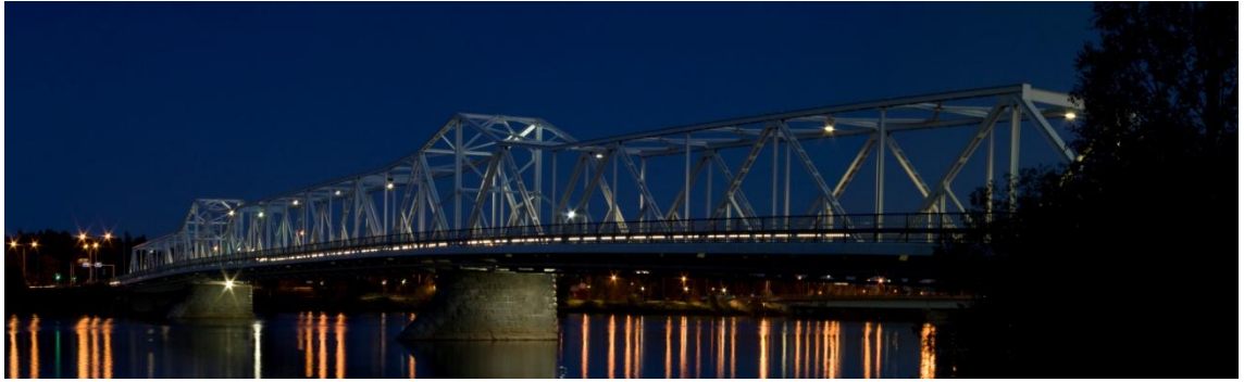
Kuva 1. Pohjoisen öiset sillat: Valoissa

Valokuva Valoissa on valokuvasarjan ensimmäinen valokuva. Mielestäni valokuva on hyvä valinta ensimmäiseksi kuvaksi, koska siitä välittyy katsojalle siltojen tunnelma ja elämä heti ensimmäisellä silmäyksellä. Siltojen elämä välittyy valokuvassa sillalla ajavien autojen valojen kautta. Tunnelmaa kuvassa välittävät sillan ja kaupungin valot niin sillassa itsessään kuin veden pinnalla heijasteena. Myös taivaan tasaisuus ja värisävyt välittävät kuvassa yöllistä tunnelmaa.