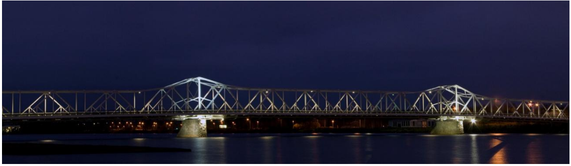
Kuva 3. Pohjoisen öiset sillat: Purppurataivas

Valitsin valokuvan Purppurataivas, koska mielestäni se tuo valokuvasarjaan mielenkiintoista kontrastia. Valokuvassa olevat värit ja valaistus luovat dramaattisen tunnelman kuvaan. Dramaattinen tunnelma näkyy erityisesti sillan valoista, jotka korostavat rakenteita luoden hämähäkkimäisen mielikuvan. Pitkän valotusajan aiheuttama veden liikehdintä ilmentää siltojen ympärillä olevaa liikettä.