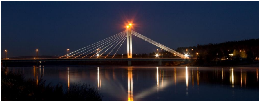
Kuva 4. Pohjoiset öiset sillat: Aava

Valitsin valokuvan Purppurataivas, koska mielestäni se tuo valokuvasarjaan mielenkiintoista kontrastia. Valokuvassa olevat värit ja valaistus luovat dramaattisen tunnelman kuvaan. Dramaattinen tunnelma näkyy erityisesti sillan valoista, jotka korostavat rakenteita luoden hämähäkkimäisen mielikuvan. Pitkän valotusajan aiheuttama veden liikehdintä ilmentää siltojen ympärillä olevaa liikettä.