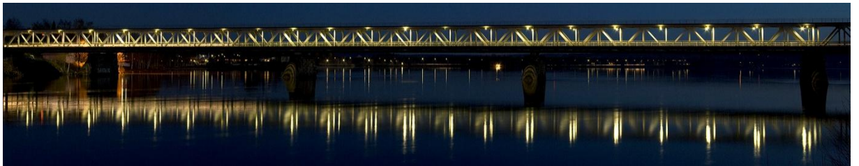
Kuva 2. Pohjoisen öiset sillat: Heijastuksia pinnalla

Valokuva Valoissa on valokuvasarjan ensimmäinen valokuva. Mielestäni valokuva on hyvä valinta ensimmäiseksi kuvaksi, koska siitä välittyy katsojalle siltojen tunnelma ja elämä heti ensimmäisellä silmäyksellä. Siltojen elämä välittyy valokuvassa sillalla ajavien autojen valojen kautta. Tunnelmaa kuvassa välittävät sillan ja kaupungin valot niin sillassa itsessään kuin veden pinnalla heijasteena. Myös taivaan tasaisuus ja värisävyt välittävät kuvassa yöllistä tunnelmaa.