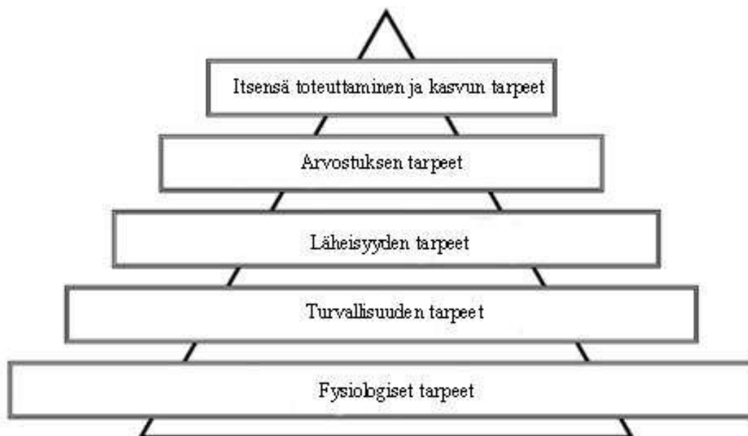
Kaavio 4: Maslow´n tarvehierarkia (Ojala & Ahonen 2003, 20).

suhtautuu luottavaisesti tulevaisuuteensa ja omiin selviämismahdollisuuksiinsa, hänen on helpompi vastaanottaa uutta informaatiota ja muuttaa ajatteluaan ja toimintaansa toimintaympäristön edellyttämään suuntaan. Mikäli perusturvallisuus järkkyy, ihminen lamaantuu pelkotilojen alle eikä kykene muuttumaan. Muutoksissa on siis varattava aikaa pelkojen käsittelyyn ja varmistettava, että ihmisen perusturvallisuuden tunne ei katoa muutoksen vuoksi (Salminen 2001, 32).