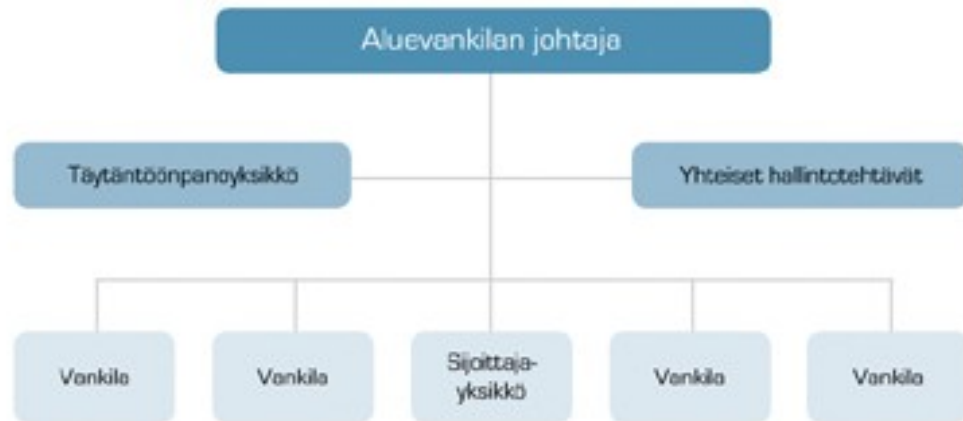
Kaavio 2: Aluevankilat (www.rikosseuraamus.fi)