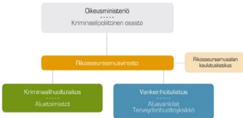
Kaavio 1: rikosseuraamusalan organisaatio kaavio ( www.rikosseuraamus.fi )

Myös alue jako tulee muuttumaan, entisen viiden alueen sijaan tulee kolme aluetta. Lisäksi on tulossa vapauttamisyksiköitä. Tällä hetkellä aluejako on seuraava: