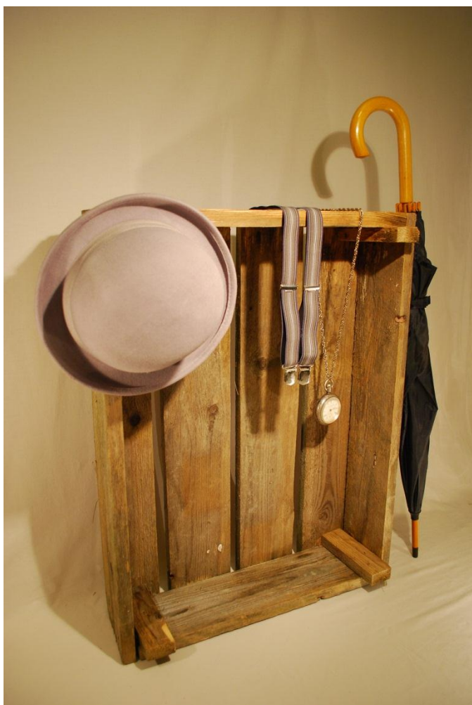
Bild. 3. Bowler

Trälådan är lagd stående på kortsidan med ett svart paraply lutandes mot lådans högra sida. I övre kanten av lådan hänger ett gammalt fickur och grårandiga hängslen. Längst till vänster på lådans övre kant hänger en grå bowler. Alla saker i bilden bildar varsin skugga mot den gråa bakgrunden.