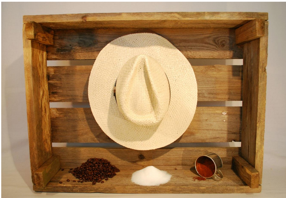
Bild. 5. Panama