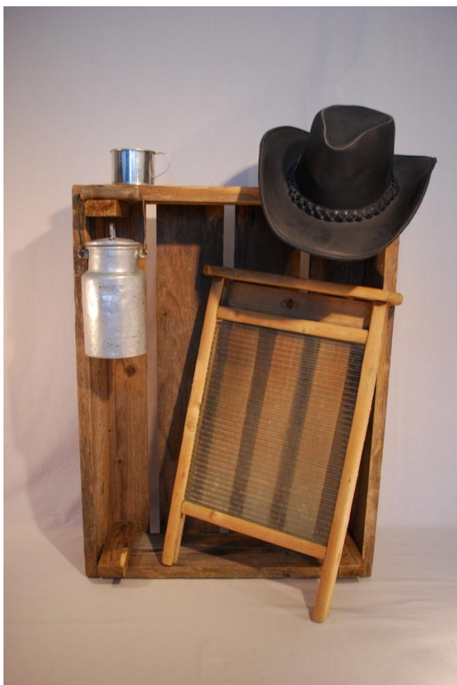
Bild. 6. Stetson

Lådan som står på kortsidan har en svart cowboyhatt hängandes på det övre, högra hörnet. Nedanför den inne i lådan står ett gammalt tvättbräde på snedden. På den vänstra sidan hänger en liten mjölkkanne från övre hörnet och ovanpå hörnet står en mugg av metall. Ljuset kommer från högra sidan och kastar en skugga på bilden till vänster.