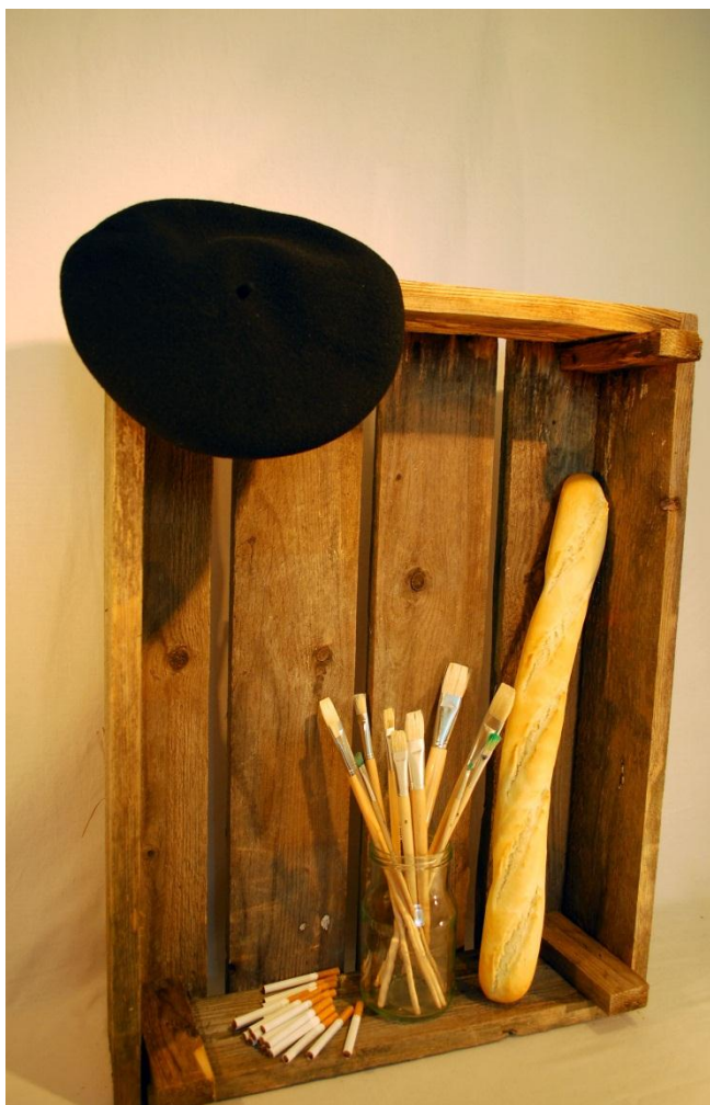
Bild 4. Basker

I den stående lådan finns en baguette ståendes till höger, en glasburk med en handfull penslar bredvid och en hög med cigaretter till vänster. Dessa saker står inne i lådan medan en svart basker hänger på lådans övre, vänstra hörn. Beträktaren ser lådan från vänstra sidan. Ljuset kommer uppifrån och bildar en skugga inne i lådans övre del.