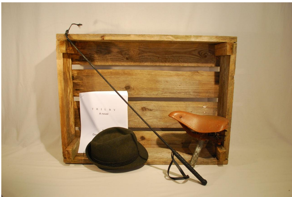
Bild. 3. Trilby

Trälådan står på långsidan och bilden är tagen rakt framifrån. Vikten av rekvisitan finns i nedre delen av bilden. Tvärs över lådan från nedre högra hörnet diagonalt till det övre vänstra hörnet står ett svart ridspö. Nere till vänster i lådan finns ett manuskript med rubriken Trilby och halvt ovanpå det finns en grön trilbyhatt. Till höger från hatten finns en gammal, orange cykelsits. Ljuset fokuseras till bildens övre sida, en aning till vänster.