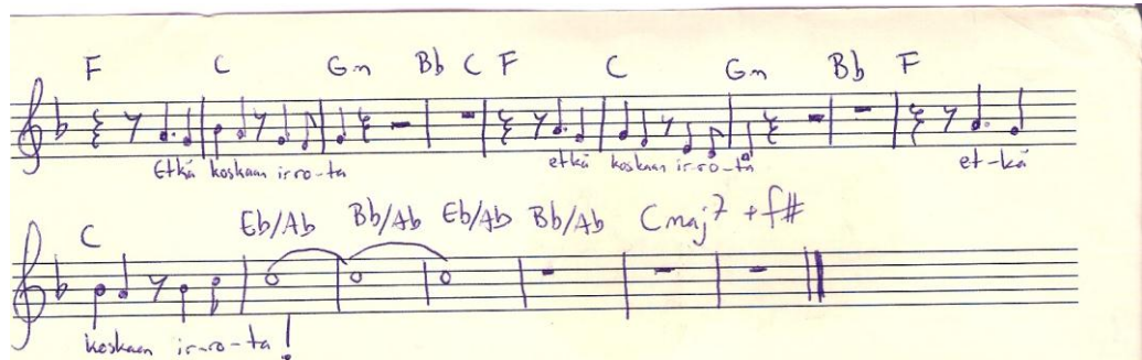
KUVA 2 Rakastan-kappaleen outro

Kajin lyhyt vapausmonologi, joka puhutaan musiikin päälle. Mirjamin outrossa toistama lause ”etkä koskaan irrota” sekä huuto Kajin perään päättävät alkukappaleen melankoliseen tunnelmaan (kuva 2, liite 2).