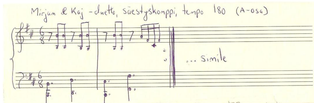
KUVA 5, kappaleen A-osan esimerkkisäestys

Kappaleessa on viisi erilaista osaa (A-E), joista ainoastaan yksi (B-osa) toistuu kahdesti (Liite 8). Tämä tekee kappaleesta monivaihteisen; tunnelmat vaihtuvat nopeasti. Kappaleen outro tehtiin harjoitusvaiheessa yhdessä työryhmän kanssa, ja sitä ei kirjoitettu varsinaisesti ylös. Siksi myös liitteessä oleva kappaleen rakenne on sekava. Dueton aloittaa Kaj, joka aikoo hakea Mirjamin takaisin luokseen. Mirjam on kuitenkin jo päässyt elämässään eteenpäin ja pystyy kieltäytymään Kajn anelun edessä. Loppuoutrossa (E-osa) musiikki liukuu takaisin musikaalin alkukappaleen ”Rakastan”-teemaan päättäen näin musikaalin Mirjamin kannalta toiveikkaaseen tunnelmaan. Kajn tarinan päätöstä ei avata, sillä halusin huomion keskittyvän Mirjamin hahmon vahvistumiseen. Oli myös mukavaa, että sain mu-