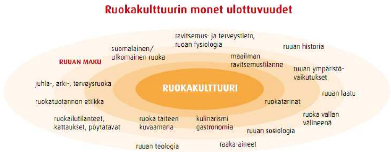
KUVIO 2. Ruokakulttuurin monet ulottuvuudet (Rauramo 2010, 22)

Ruokakulttuurin levittämisestä koituva hyöty on moninainen. Ruokakulttuuri on esimerkiksi osa hyvinvointipalveluja ja arjen viihtymistä, kohtaamisia, elämyksiä ja lopulta tiedon sekä ymmärryksen lisäämistä. Näiden kokonaisuuksien sisään mahtuvat niin terveelliset ruokatottumukset, ruokanautinto hyvällä omallatunnolla, yhdessä syöminen ja ihmissuhteiden hoito, uusien makujen löytäminen kuin ruoantuotannon ympäristövaikutuksetkin. (Mts. 24.)