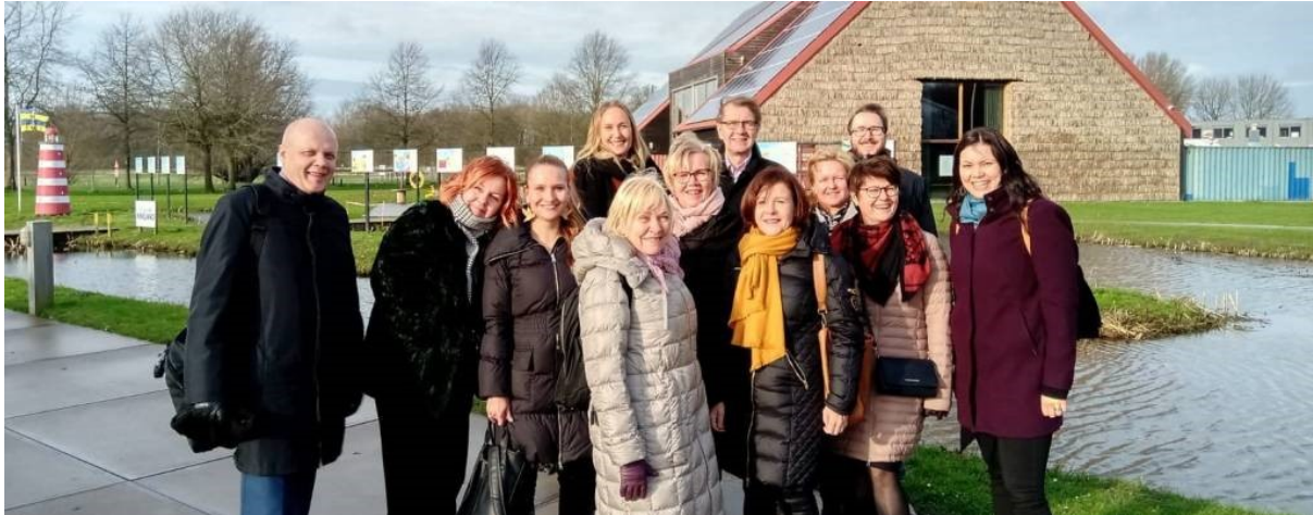
TAMKilaiset tutustumassa Hanzen TKI-ympäristöihin.

You make it strategic when you really do something like this together.