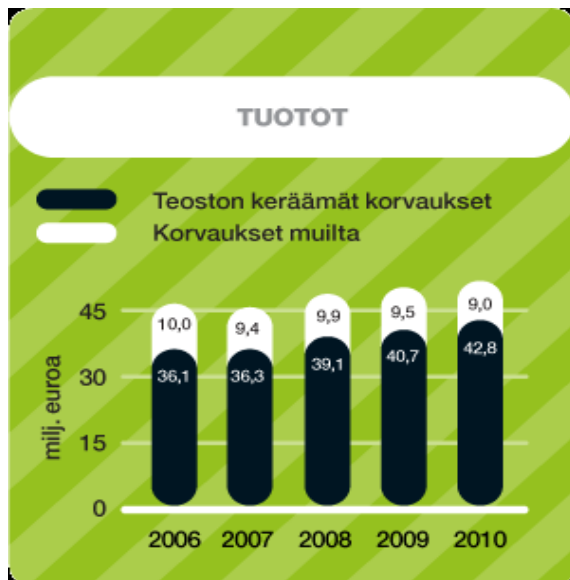
Kuva 3: Teoston tuotot vuosina 2006-2010. (Teoston vuosikertomus 2010)

Vuonna 2010 Teosto keräsi korvauksia musiikin käytöstä Suomessa 42,8 miljoonaa euroa. Tästä Teosto tilittää toimintakulujen vähennyksen jälkeen 86,9 % eli 37,2 miljoonaa euroa säveltäjille, sanoittajille, sovittajille ja musiikin kustantajille, ja 6,7 % tilityssummasta käytetään suomalaisen musiikin edistämiseen. (Teosto 2011b.)