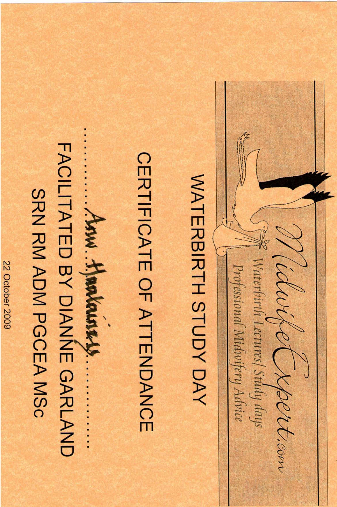
Liite 4 Vesisyntyys koulutuspäivän todistukset