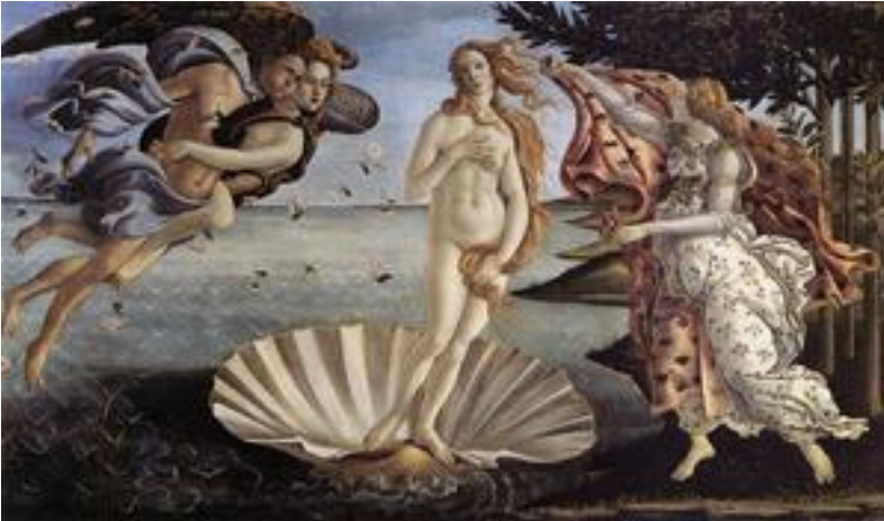
Sandro Botticelli, Venuksen syntymä, 1485. Firenze.

Ajatus vesisynnytyksestä ja veden käytöstä kivunlievityksessä levisi niin lääkäreiden, kuin kätilöidenkin kautta. Nykyään vesisynnytystä käytetään yhtenä synnytysmenetelmänä jo yli sadassa eri maassa.