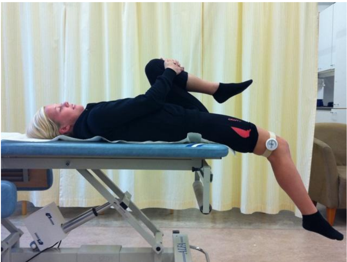
Kuva 1 Modifioitu Thomasin testi

Lonkan koukistajien lihaskireyksiä mitattaessa Modifioidulla Thomasin testillä mitattava istuu jalat suorana tutkimuspöydällä. Polvilumpion yläpuolelle, viisi senttimetriä polvilumpion yläreunasta, asetetaan Myrin –mittari. Mittarin asentamisen jälkeen mittari nollataan ja mitattava asettuu seisomaan tutkimuspöydän päähän istuinkyhmyt alustan reunaa vasten. Mitattava nostaa ei-tutkittavan alaraajan koukkuun ja ottaa käsillään siitä kiinni. Mitattavaa pyydetään kallistumaan taaksepäin ja käymään selinmakuulle tutkimuspöydälle. Mitattava alaraaja vedetään koukkuun rinnan päälle, jotta lannenotko häviää. Mitattava laskee mitattavan alaraajan rauhallisesti roikkumaan tutkimuspöydän reunan yli. Samalla mitattava pitää toista alaraajaa koukussa rinnan päällä.