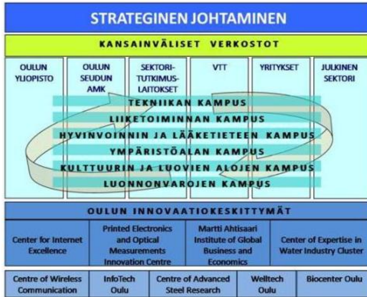
Kuva 2. Oulun korkean osaamisen kehittäminen. Kokonaisuus ja kehittämisen fokusalueet, uudet toimintansa aloittaneet innovaatiokeskittymät sekä jo aiemmin soveltuvia tutkimuksen ja kehittämisen merkittäviä osa-alueita. [9]

Oulun innovaatioympäristön osaamisytimen muodostaa Oulu Kampus. Se on korkeakoulujen, tutkimuslaitosten, yritysten ja kansainvälisten toimijoiden muodostama vetovoimainen, monialainen, toisiaan tukevien, tulevaisuuteen suuntautuneiden osaamisyhteisöjen keskittymä [9] . (Kuva 2). Oulu Kampuksessa innovaatiokeskittymät muodostetaan alkuvaiheessa internettutkimukseen, painettavaan elektronikkaan, kansainväliseen liiketoimintaan, ympäristö- ja hyvinvointialoille. Näissä ammattikorkeakoulu ja yliopisto keskittyvät ydintehtäviinsä tavoitteena pysyvien rakenteiden ja toimintatapojen ratkaisut opetuksessa ja tutkimus- ja kehitystyössä.