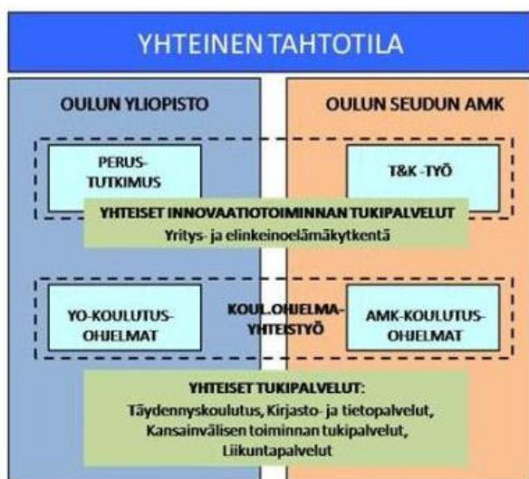
Kuva 1. Oulun yliopiston ja Oulun seudun ammattikorkeakoulun yhteistyön perusta [8] .

Oulun seudun ammattikorkeakoulu ja Oulun yliopiston vuonna 2006 alkaneen yhteistyön ja työnjaon kehittämishankkeen aikana on etsitty uusia toimintamalleja yli 20 alakohteisessa työryhmässä mahdollisimman lähellä käytäntöä [4] . (Kuva 1). Yhteistyöhankkeeseen on osallistunut yhteensä yli 250 opetus- ja tutkimushenkilöä. Henkilöstön aktiivinen osallistuminen ja sitoutuminen on erittäin tärkeää, koska vain se mahdollistaa uusien toimintamallien toteutumisen käytännössä.