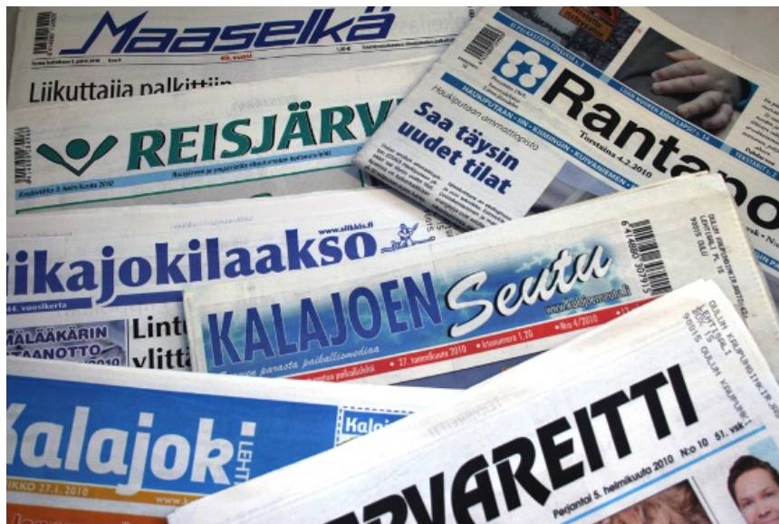
Kuva 1. Paikallislehdellä on tärkeä tehtävä paikallisidentiteetin rakentajana ja yhteisöllisen tiedon välittäjänä.

Lama vauhditti mediakentän rakenteellisia muutoksia. Kolhuilta eivät ole säästyneet pienet ja ketterät paikallislehdetkään. Niiden tulevaisuuden haasteet poikkeavat kuitenkin maakuntalehdistä. Paikallislehtien ensisijaisena tehtävänä ei vielä ole tuottaa omistajille maksimaalista voittoa. Ne ovat edelleen paikallisidentiteetin rakentajia ja ylläpitäjiä, yhteisöllisen tiedon välittäjiä ja olennainen osa ihmisten arkea. Oamkin viestinnän osaston paikallislehtien tekijöiden kouluttamiseen keskittyvä Lokkaali-hanke pyrkii uudella tavalla turvaamaan lehtien tulevaisuutta.