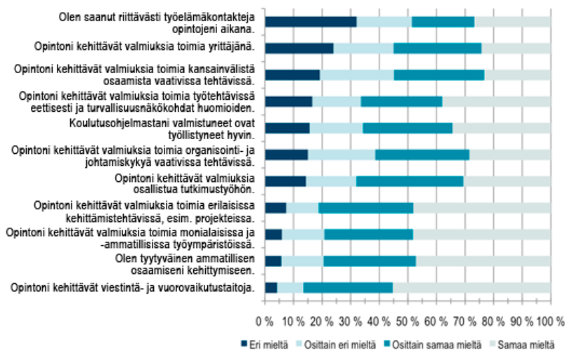
KUVA 2. Arvio opintojesi kehittämää työelämävalmiuksia ja koulutusohjelmastasi työllistymistä (n=894) [5]

Opiskelijoita pyydettiin arvioimaan opintojensa kehittämää työelämävalmiuksia ja koulutusohjelmasta työllistymistä 11 väitteen avulla. Vastauksia selvisi, että noin 80 prosenttia oli vähintäänkin melko tyytyväinen ammatillisen osaamisensa kehittymiseen (kuva 2). Tyytyväisimpiä opiskelijat olivat viestintä- ja vuorovaikutustaitojen kehittymiseen sekä valmiuksiin toimia erilaisissa kehittämistehtävissä sekä monialaisissa tai -ammattillisissa työympäristöissä. Tyytymättömmimpiä he olivat työelämäkontaktien määrään ja yrittäjyysvalmiuksien kehittymiseen. Koulutusalojen välillä vastauksissa oli kuitenkin paljon vaihtelua. Esimerkiksi työelämäkontaktien määrään tyytyväisimpiä olivat sosiaali- ja terveysalan opiskelijat ja tyytymättömmimpiä puolestaan tekniikan alan opiskelijat.