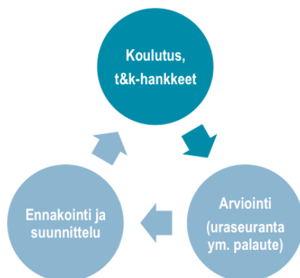
KUVA 1. Työelämäyhteistyön rajapinnat ammattikorkeakoulussa

Ammattikorkeakoulu tarvitsee toimivia yhteyksiä työelämään ennakoissaan ja suunnitellessaan koulutustarjontaa, koulutuksen aikana sekä sen päättymisen jälkeen palautteen muodossa [1] (kuva 1). Koulutuksen aikainen työelämäyhteistyö pitää sisällään opiskelijoiden harjoittelujaksoja ja vierailuja työpaikoilla, yhteisiä tutkimus- ja kehityshankkeita ja projektiopintoja sekä työelämälähtöisiä opinnäytetöitä. Korkeakoulun alumnit tai muut työelämän toimijat voivat tuoda ajankohtaista ja konkreettista tietoa työelämästä opiskelijoille vierailevina opettajina. Myös opiskelijayritystoiminta ja yrityshautomo tarjoavat opiskelijoille kontakteja ja kokemuksia valmistumisen jälkeisestä työstä.