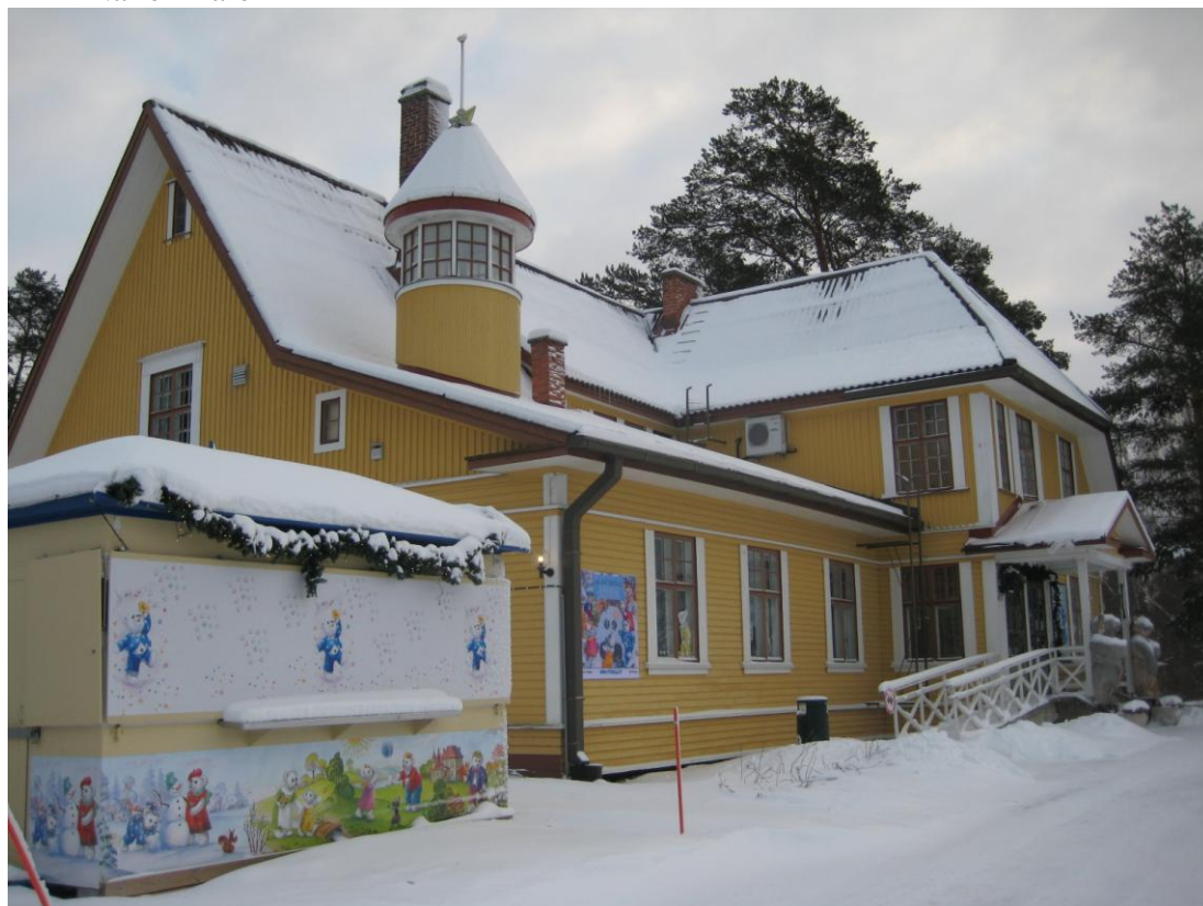
Ti-Ti Nallen Talo