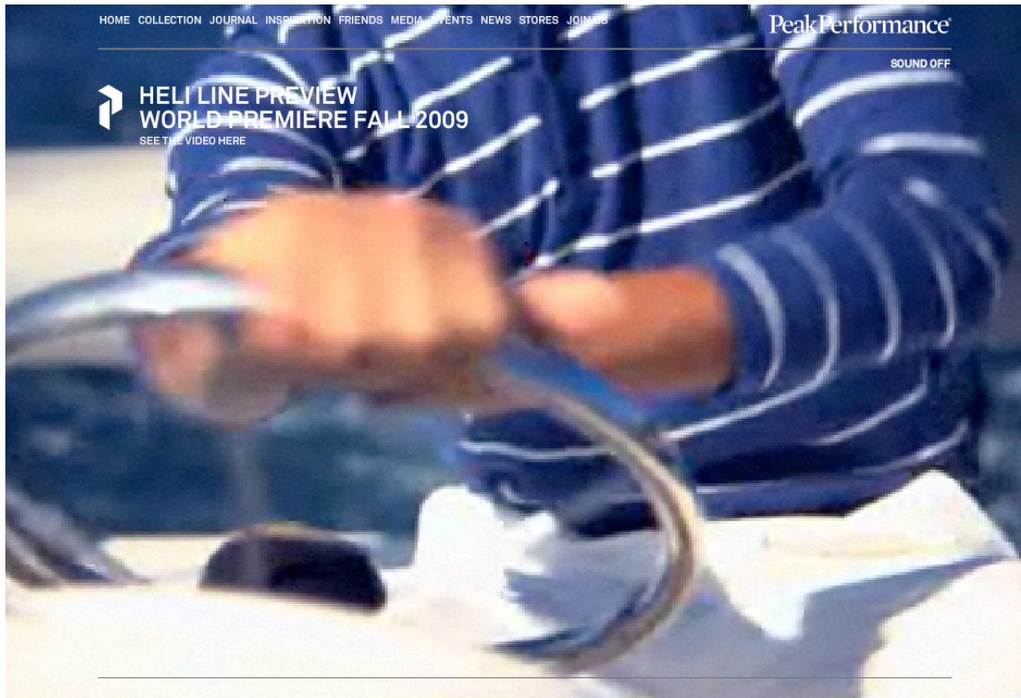
Kuva 1. Peak Performancen kotisivut, jotka avautuvat näyttäen liikkuvaa kuvaa erilaisista vapaa-ajan tilanteista (ks. havainnemateriaali).

maisemissa. Kuvan laadussa on ehkä hieman toivomisen varaa, mutta idea sinänsä on loistava (ks. havainnemateriaali).