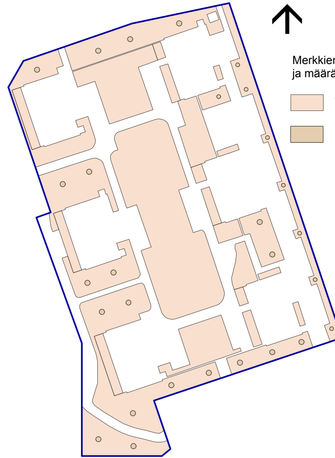
Nihtisilta Gf=0,1 kasvualustat