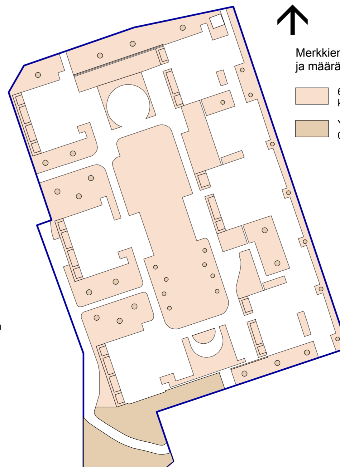
Nihtisilta Gf=0,5 kasvualustat