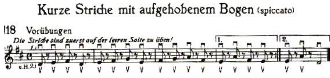
Esimerkki 4. Spiccato 2. (Doflein 1940, 44)

ensin pelkästään vetojousilla ja sitten työntöjousilla ennen kuin ne yhdistetään. Tämä on hyvin samanlainen harjoitus, kuin harjoitusvihossamme (Spiccato, harjoitus 2, vaiheet 2. ja 3. s.24). Doflein ohjeistaa harjoittelemaan ensin vapailla kielillä. Hän ei kuitenkaan kerro harjoituksien yhteydessä spiccaton ominaisuuksista juuri mitään.