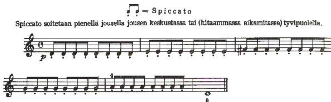
Esimerkki 3. Spiccato (Siukonen 1963, 46)

Siukosen viulukoulun (1963) ensimmäisessä vihossa käsitellään jousilajeistamme portatoa, marteléta ja spiccatoa (1963, 21, 40, 46). Viulukoulussa selitetään, minkälainen kyseinen jousitus on ja viitataan sen joihinkin piirteisiin, mutta ei anneta valmistavia harjoituksia. Ensimmäinen harjoitus esimerkiksi spiccaton kohdalla on valmiin spiccaton harjoitus, jossa otetaan vasemman käden sormet heti mukaan (ks. seuraava esimerkki).