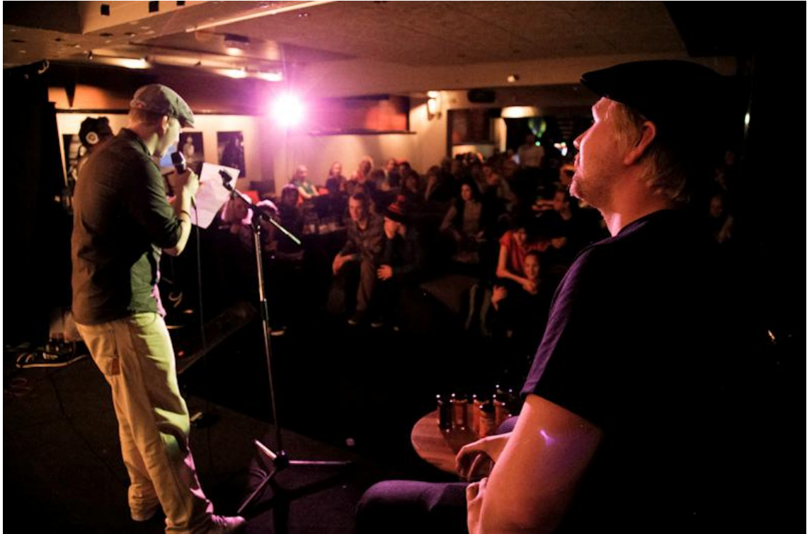
KUVA 2: Ennen Poetry Jam -klubia Suomessa ei juurikaan nähty open mic -osuuksia runotapahtumissa

Runokansan omaksumia Poetry Slam -kilpailuja (nykyään Runopuulaaki) oltiin kyllä järjestetty Suomessa jo vuodesta 2000 asti savolaisen Runokukkoduon toimesta, mutta vain kerran vuodessa. Kyseinen runokilpailuformaatti on kuitenkin ollut omalta osaltaan mahdollistamassa lavarunouden suuremman suosion syntymisen Suomessa raivaten tilaa Poetry Jam -klubin kaltaisille tapahtumille. Poetry Slam -formaatti perustuu kilpailuun, jossa jokaisen osanottajan esityksen kesto on rajattu kolmeen minuuttiin. Rekvisiitan, tehosteiden tai musiikin käyttö esityksissä on kiellettyä. Esiintyjien tulee ilmoittautua järjestäjille ennakoon. Kilpailun tuomaristoon kuuluu viisi järjestäjien valitsemaa yleisön edustajaa. Yleisöraati jakaa pisteet asteikolla 1,0-10,0. Kierroksia järjestetään kolme ja lopulta kilpailusta vain yksi selviää voittajana. (Rytkönen 2003, 13-14) Oleellisesti Runopuulakien luonteeseen kuuluu se, että kisailuun voi osallistua kuka tahansa kunhan runot ovat itse kirjoitettuja.