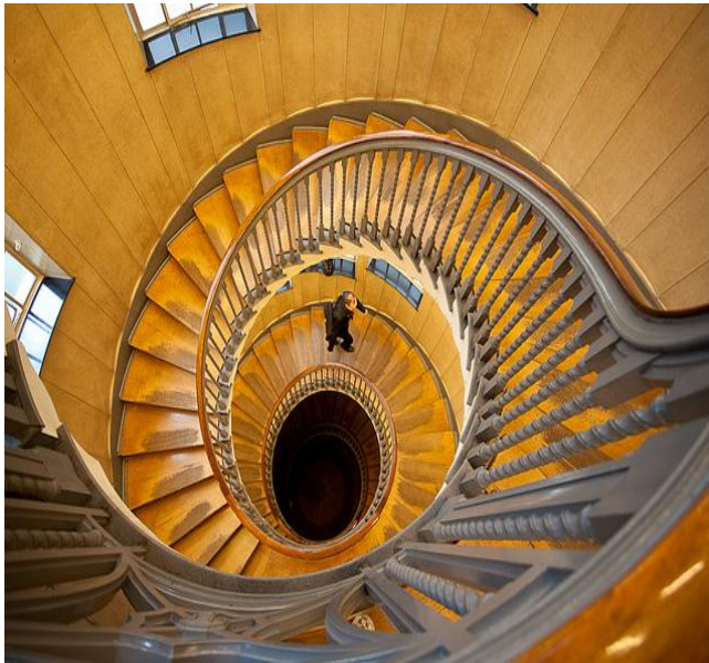
Kuvio 2: Spiraalimaisen kehittämisprosessin syklit

Seuraavaksi esittelen spiraalimaisen kehittämismallini syklit lyhyesti: