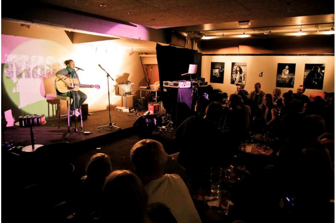
KUVA 1: Poetry Jam -klubilla myös laulaja-lauluntekijöitä tarkastellaan runoilijoina. Esiintymässä Mirel Wagner

Ennen Poetry Jam -klubia missään suomalaisissa sanataidetapahtumissa ei järjestetty säännöllisesti open mic -osuuksia, joiden aikana yleisö voisi itse esittää omia runojaan kannustavan ilmapiirin vallitessa. Klubin konsepti ja avoimuus on kahden vuoden aikana vaikuttanut kotimaisten sanataidetapahtumien kenttään siinä määrin, että sen piirteitä on jopa alettu plagioimaan ympäri Suomea. Kiinnostusta tapahtumaa kohtaan on ollut myös maan rajojen ulkopuolella, joka on näkynyt mm. ulkomaisten artistien kasvavana esiintymistarjousten määränä.