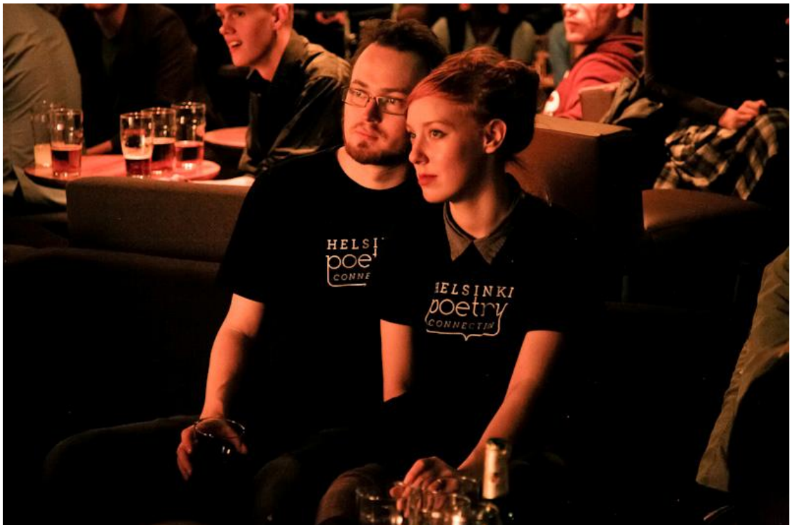
KUVA 4: Yli puolet vastaajista (55,8 %) kertoi tutustuneensa klubilla uusiin ihmisiin

Klubin ilmapiiriä pidettiin pääsääntöisesti joko erittäin hyvänä 67,6 % tai melko hyvänä 20,5 %. Eniten ilmapiiriin vaikuttava tekijä oli yleisö 33,3 %, mutta myös ohjelma 28,5 % ja juontaja 18 % koettiin ilmapiiriin merkittävästi vaikuttavina tekijöinä. Vastaukset mielestäni kertovat siitä, että Poetry Jam -klubilla yleisön merkitys on ohjelmaa suurempi lähinnä sen takia, että yleisö itse on osa ohjelmaa, nämä ovat siis kaksi toisistaan vaikeasti eroteltavaa asiaa.