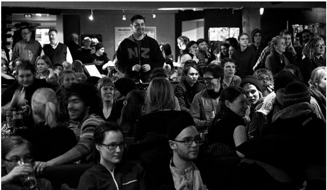
KUVA 3: Poetry Jam -klubille ovat tervetulleita kaiken ikäiset, mutta omakseen tapahtuman ovat ottaneet erityisesti nuoret aikuiset

Tapahtuma on alusta asti pyrkinyt herättämään kiinnostusta erityisesti sellaisissa ihmisryhmissä, jotka eivät välttämättä aktiivisesti seuraa runoutta tai käy sanataidetaapahtumissa. Tapahtumalla on myös haluttu tehdä nuorennusleikkaus kotimaisten runotapahtumien kenttään. Runous on haluttu esitellä monipuolisena, räiskyvänä ja äänekäänä. Ideologiaan on kuulunut, ettei ketään syrjitä vaan yleisöön ja lavalle ovat samoissa määrin tervetulleita 18-vuotiaat lukiolaiset kuin myös 70-vuotiaat eläkeläiset.