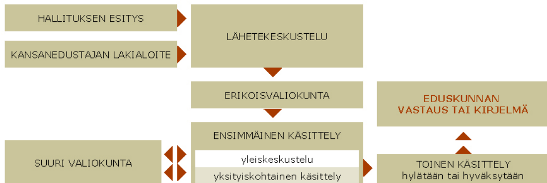
Kuvio 2. Lain käsittelykaavio (Eduskunta 2012b).