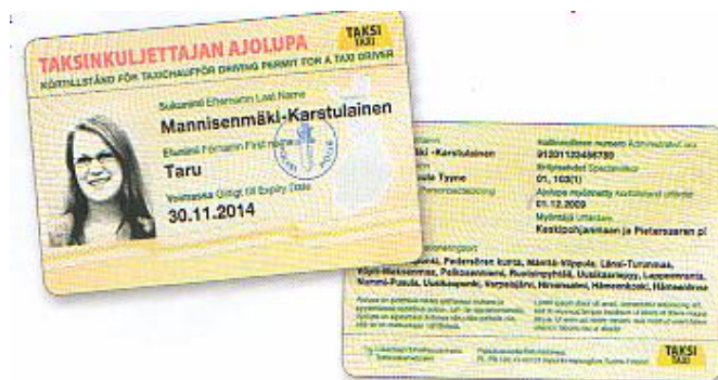
Kuva 2. Valmis ajolupa (Taksi 1/2010)

Mikäli taksinkuljettajalla on ajolupa, mutta auton asemapaikkaa ei ole merkitty lupaan tai ajolupa ei ole hänen mukanaan, syyllistyy hän kuljettajan ammattipätevyssäännösten rikkomiseen. Rikkomuksesta on seurauksena sakkoa. Työntantajana toimivalla yrittäjällä on vastuu siitä, ettei ajoneuvoa luovuteta henkilölle, jolla ei ole taksinkuljettajan ajolupaa.