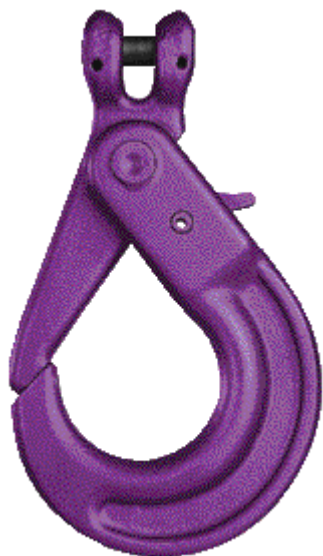
Kuvio 1. Pakkolukittuva nostokoukku. (Haarukkaliittimellinen varmuuskoukku, [viitattu 20.3.2012].)

Nostoissa käytettävät nostoapuvälineet on oltava tarkoitettuja kyseiseen työhön ja ne on tarkastettava ennen työn aloittamista. Nostoapuvälineiden oikeanlaisesta käytöstä vastaa nosturinkuljettaja sekä asennustyönjohtaja. Osittain rikkoutuneiden nostoapuvälineiden käyttö on kielletty.