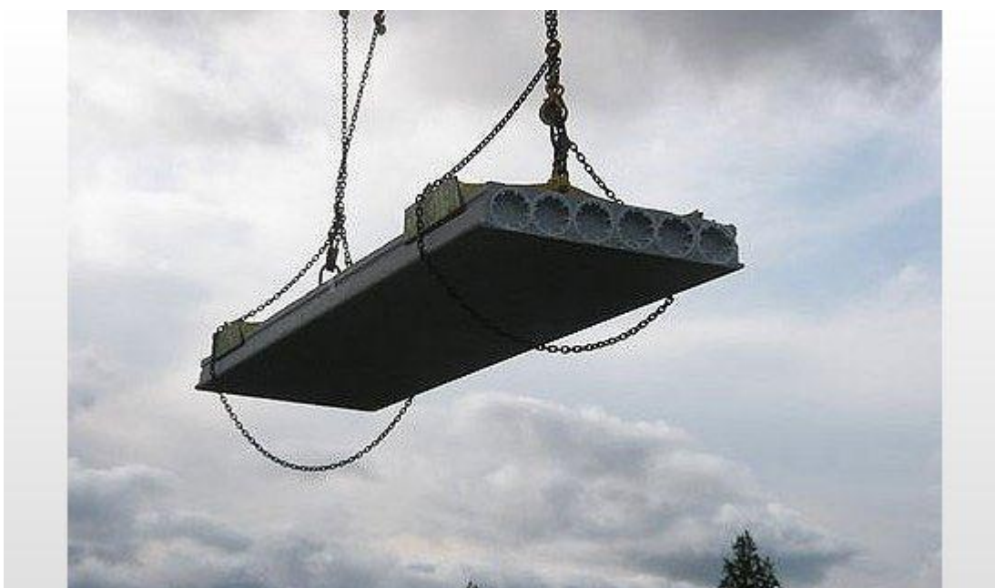
Kuvio 2. Ontelolaattasakset. (Välipohja ontelolaatoista 2011.)

Asennusurakoitsija vastaa tarvitsemistaan käsityökaluista itse. Tällaisia ovat esimerkiksi asennuskanget, porat, puristimet, vatupassi sekä tasolaser. Taulukossa 10 on kerrottu nostotyöhön tarvittava erityiskalusto. Ontelolaatta asennuksessa tarvittavat erityisnostovälineet kuten ontelolaattasakset ja puomin toimittaa elementtitoimittaja.