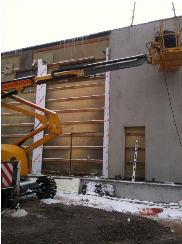
Kuvio 4. Kuukävelijä.

Henkilönostimesta työskenneltäessä ei saa kurotella tai nousta kaiteelle seisomaan. Myös erilaisten tikkaiden ja työtasojen käyttö nostimen lavalla tai korissa on kielletty. Tarvittaessa nostimen paikkaa siirretään tai käytetään nostoarvoiltaan parempaa ja työhön soveltuvaa nostinta.