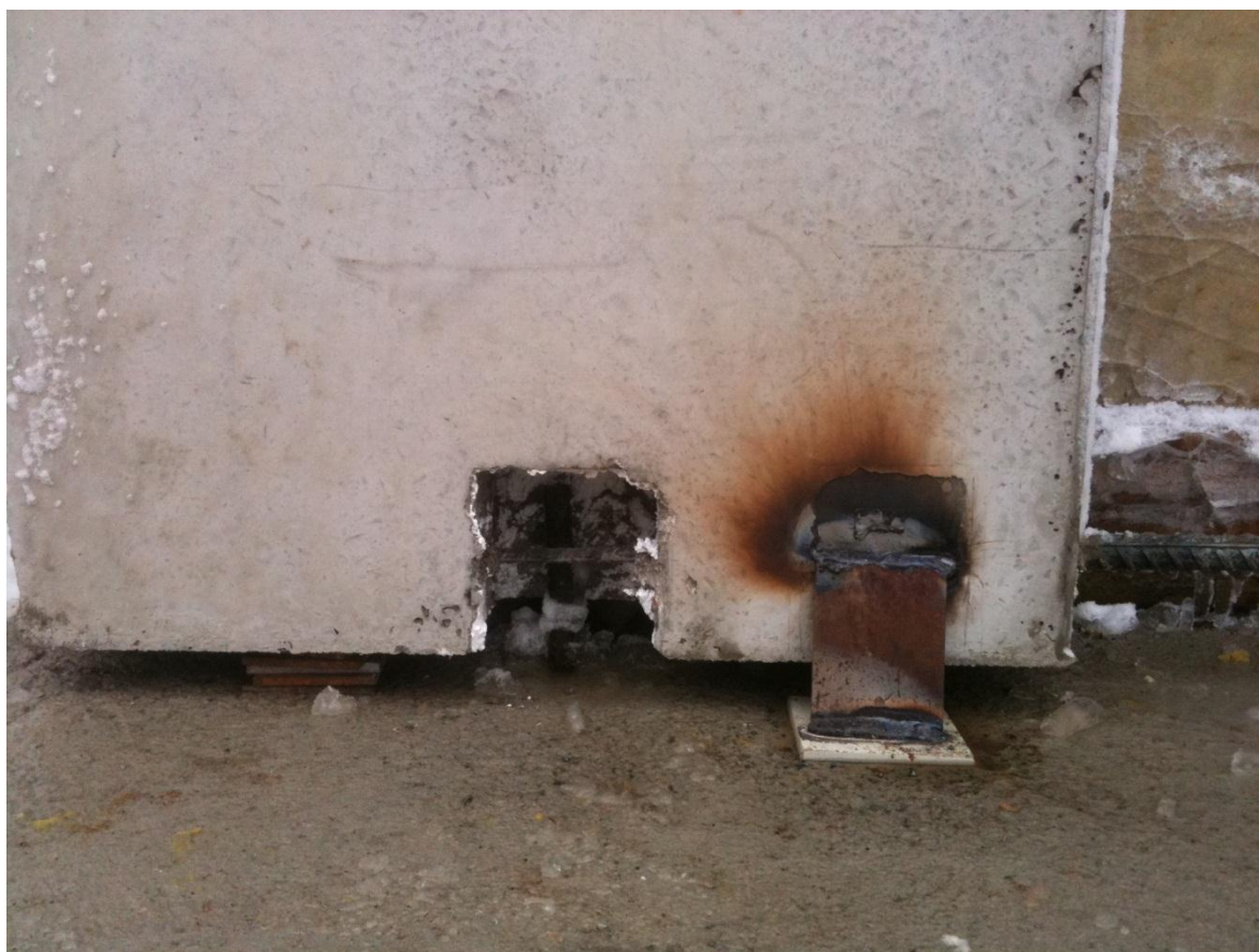
Kuvio 3. Paloseinäelementin kiinnitys.

Asennettava elementti on tarkastettava silmämääräisesti ennen asennusta valmistajan antamien ohjeiden mukaisesti. Tarkastettavan elementin kiinnitysosien on oltava kunnossa ja paikoillaan. Elementtiä ei saa asentaa, jos tarkastettavan elementin kiinnitysosissa on turvallisuutta vaarantavia puutteita. (A 26.3.2009/205.)