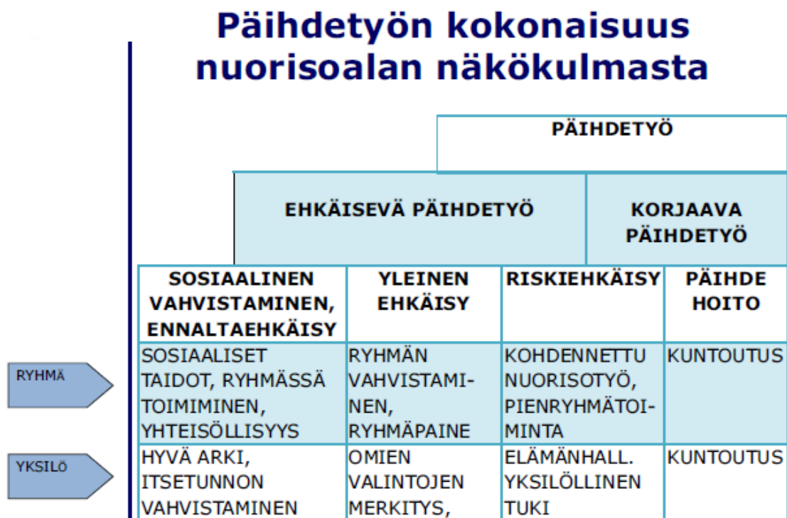
Kuva 1. Päihdetyö nuorisoalan näkökulmasta kuvattuna (Pylkkänen 2011, 4).

Alla olevasta kuvasta on nähtävissä päihdetyön kokonaisuus nuorisoalan näkökulmasta. Päihdetyön kohteena voi olla yksilö tai ryhmä. Kuvasta näkyy, mihin asioihin tulisi kiinnittää huomiota kohteesta riippuen ja sen avulla voidaan työelämässä valita oikeat työmuodot. Kuvasta tulee esiin myös yleisen ja riskiehkäisyyn lähestymistapojen erot sekä sosiaalisen vahvistamisen painopisteet ennalta ehkäisevässä päihdetyössä.