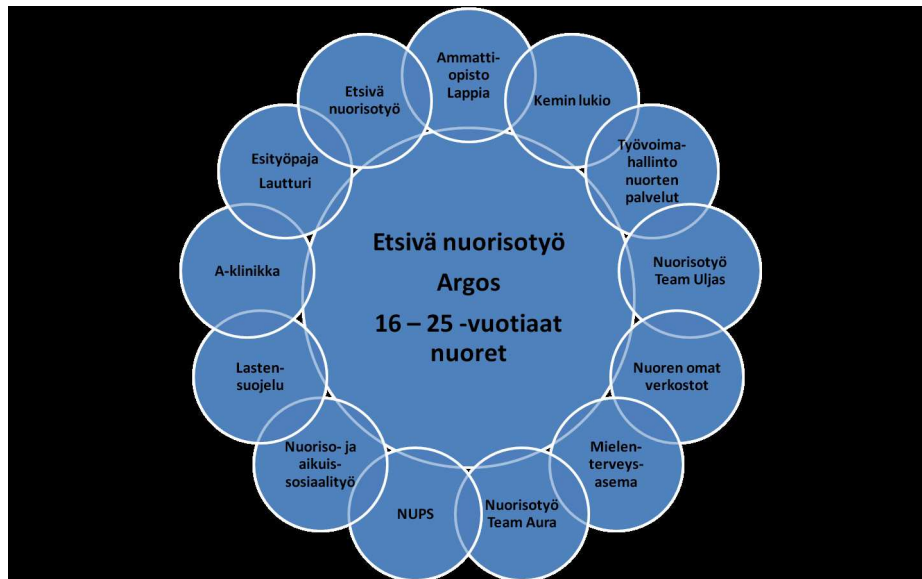
KUVIO 4 Nopean toiminnan joukkoihin nimettyjen henkilöiden taustayhteisöt.