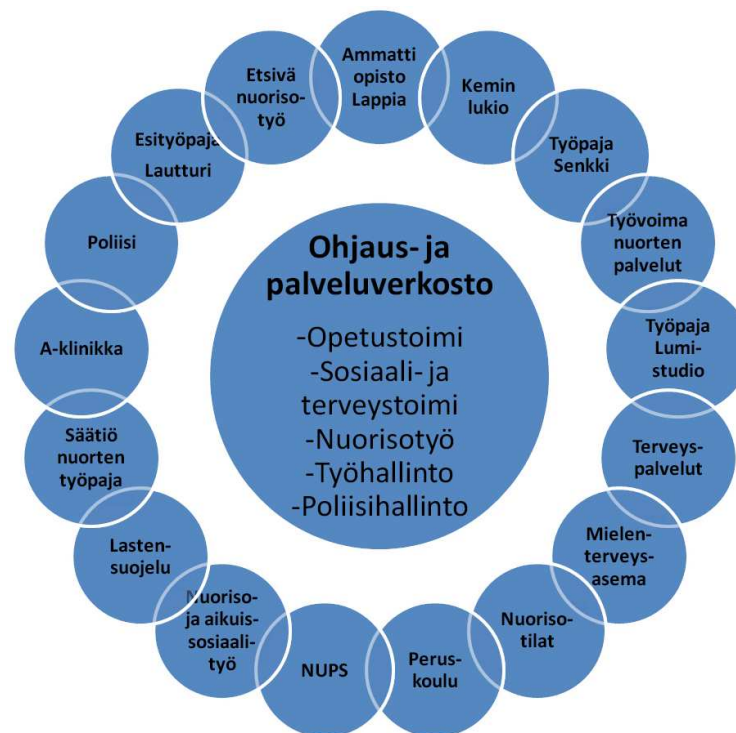
KUVIO 1. Lasten ja nuorten ohjaus- ja palveluverkosto ja palvelujen tarjoajat. (Etsivä nuorisotyö 2011)

Kemin kaupunginvaltuusto on vahvistanut lastensuojelulain 12 § mukaisen Lasten ja nuorten hyvinvointisuunnitelman ja nuorten syrjäytymisen ehkäisyä käsitellyt monialainen työryhmä vaihtui huhtikuussa 2011 kaupunginhallituksen asettamaan moniammatilliseen nuorten ohjaus- ja palveluverkoston. (Kulttuurilautakunta 2011)