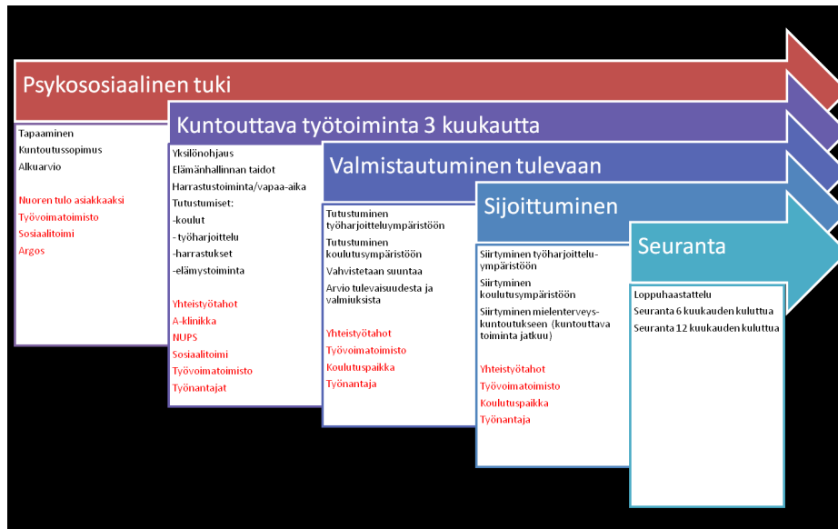
KUVIO 3 Lautturi Matalan kynnyksen työpaja ”Erittäin haastava asiakas”