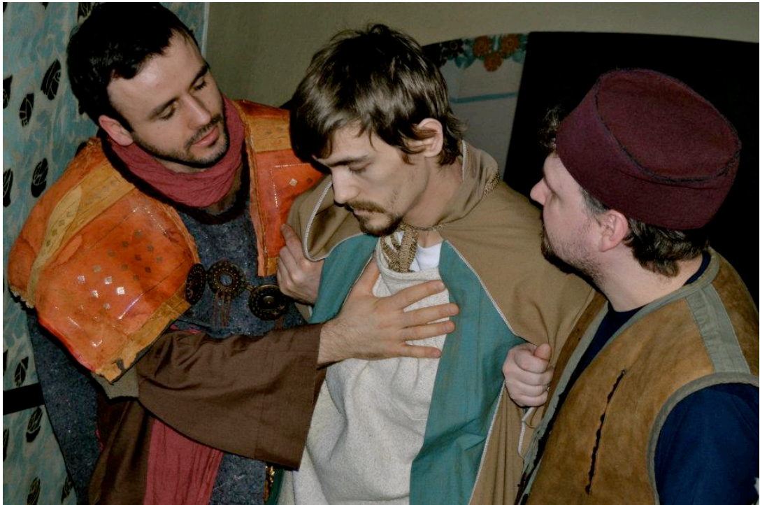
Kuvio 2. Teatteri Kallion esitys Pettäjä, kieltäjä rakas ystävä Kallion kirkossa pääsiäisenä 2012.

Tule mukaan yhteiselle vaellukselle ensimmäisen pääsiäisen tapahtumiin. Epäuskoa, riemua, petturuutta ja rakkautta – tähän kaikkeen meidät johdattaa enkeli, joka kulkee edellämme ja kanssamme. Matkan aikana kohtaamme Magdalan Marian, Johanneksen, Juudaksen, Pietarin, Jeesuksen äidin ja myös nykypäivän nuoria kalliolaisia aikuisia, jotka painivat ikäikäisten kysymysten ja tunteiden keskellä.