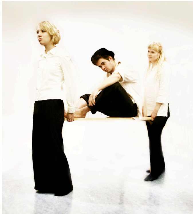
Kuvio 5. Peer Gynt vuodelta 2006, ohjaus Markus Majava.