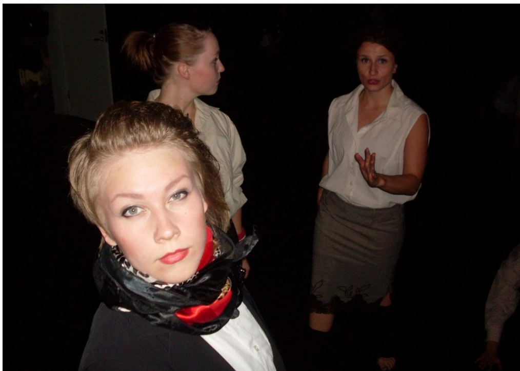
KUVA 9: Olennainen 2010. Teoksen rooleihin samaistumista