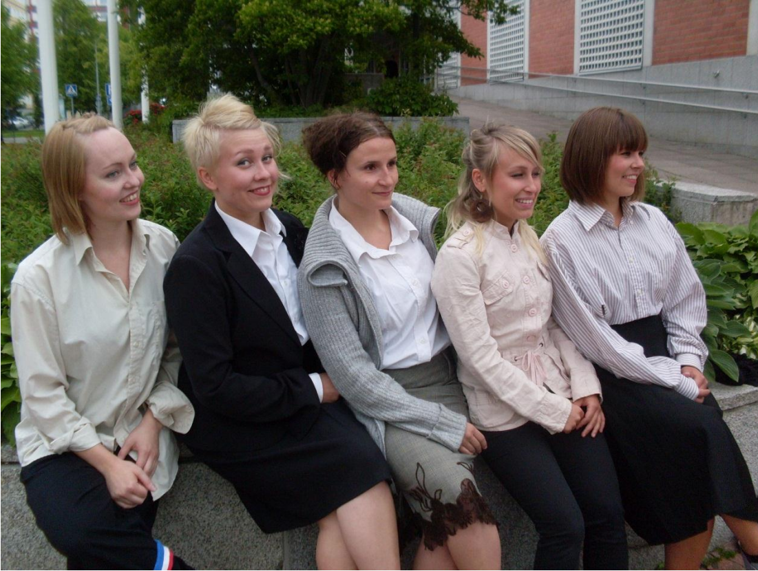
KUVA 3: IDI-tanssiryhmän jäsenet. Hetki ennen esitystä Kuopio Tanssi ja Soi - festivaaleilla 2010 (valokuva: Moona Nevalainen 2010)