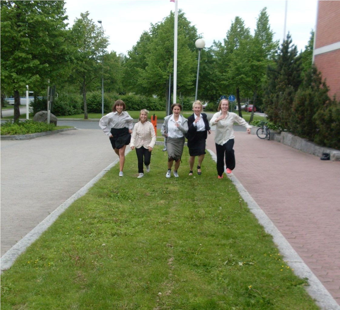
KUVA 15: IDI Kuopion Musiikkikeskuksen pihalla. Intoa täynnä kohti tulevaa.