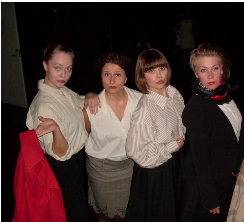
Kuva 8: Hetki ennen esiintymistä teoksella Olenainen 2010

DI:n kohdalla olemme pohtineet ryhmän profiloitumista ja päätyneet siihen lopputulokseen, ettei vielä ole tarpeellista tai edes mahdollista profiloitua mihinkään tiettyyn. Ensisijaista on verkostoitua, hyödyntää yhteistyötahoja ja toimia erilaisten kanavien kautta; paikallisesti, valtakunnallisesti ja kansainvälisesti (Kahilainen 2012). Markkinoinnista hyödyttäisi tietynlainen profiloituminen, joskin sitä alkaa tapahtua joka tapauksessa, vähitellen. Tunnistettavuuden lisääntyessä katsojat alkavat määrittää meitä kuitenkin ja profiloitumme myös oman käytännön kautta, toiminnan kiteytyessä. (Risberg 2012.)