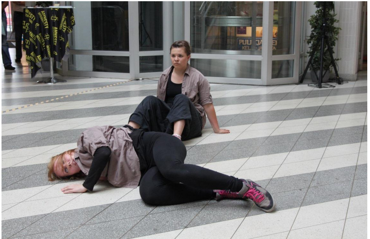
KUVA 10: Duetto teoksessa Tapaukseton . Sektorin kauppakeskuksessa, Kuopio 2011