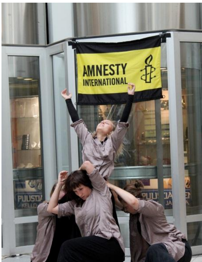
KUVA 7: Tapaukseton . Sektorin kauppakeskus, Kuopio 2011

Resurssien jakamisesta, myös laajemmin esittävien taiteiden välillä puhutaan jatkuvasti, mutta siinä olisi edelleen paljon kehitettävää. Riitta Honkasen (2012) mielestä tekijöiden ja rakenteiden suunnalta olisi hienoa nähdä aloitteita toiminnalliseen yhteistyöhön, joka voisi ilmentyä yhteistyötapahtumina, isompina ja kannattavampina yhteisfestivaaleina vaikkapa kaupunkien välillä. Jos yhteistyöhön riittäisi tahtotilaa, olisi todennä-