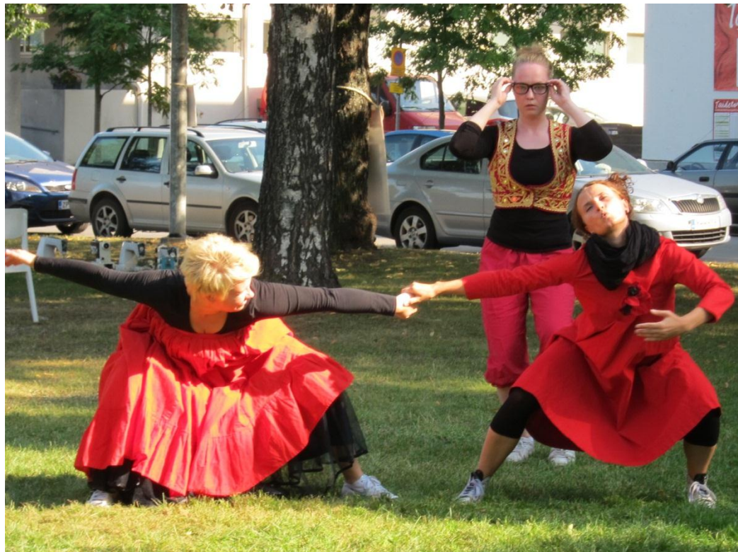
KUVA 2: Kuopion taidetori. Improvisaatio kolmelle 2010