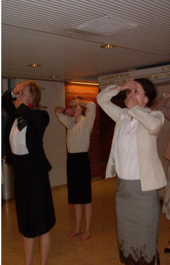
KUVA 6: Hetki ennen esitystä. Kuopio Tanssii & Soi -festivaali 2010

Tanssissa ryhmäytyminen on myös luontevaa. Vaikka tanssija tekisi sooloteoksen, tarvitsee hän työryhmän ympärilleen, jonka kanssa teos valmistetaan. (Honkanen 2012.) Toisaalta myös heidän, jotka haluavat elättää itsensä ryhmien toiminnalla, täytyy olla avoimia erilaisille rahoituksille. Merkittäviä rahoituksia ovat tällä hetkellä erilaiset hankerahat, joita annetaan muun muassa ei-perinteiseen taiteen tekemiseen, sovelta-vaan tai yhteisölliseen taiteeseen. Rahoituksen takana on usein valtioiden, kuntien ja maakuntaliittojen hankerahat, ja niitä myönnetään käytännössä vain yhteisöille. Käytäntö juontaa juurensa EU:sta ja koko Euroopan tason rakenteista. (Honkanen 2012.)