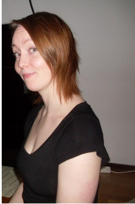
KUVAT 11 & 12: IDI:n kevätkokous 2010. Snellmaninkatu, Kuopio