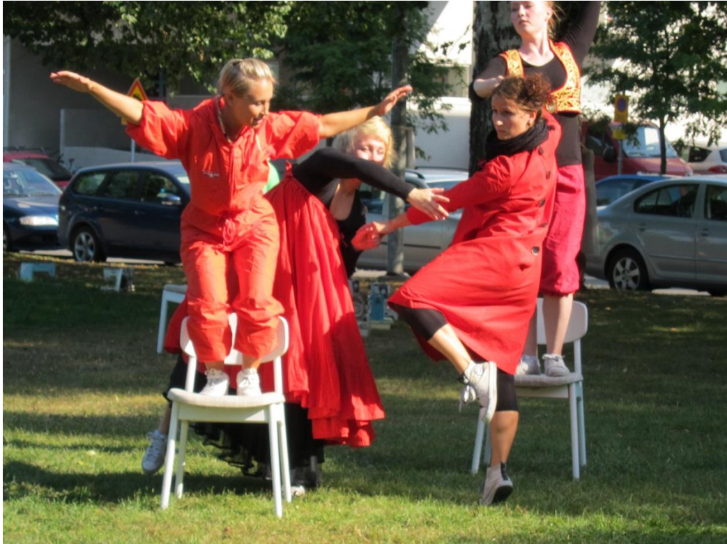
KUVA 1: Kuopion Taidetori. Improvisaatio-esitys 2010