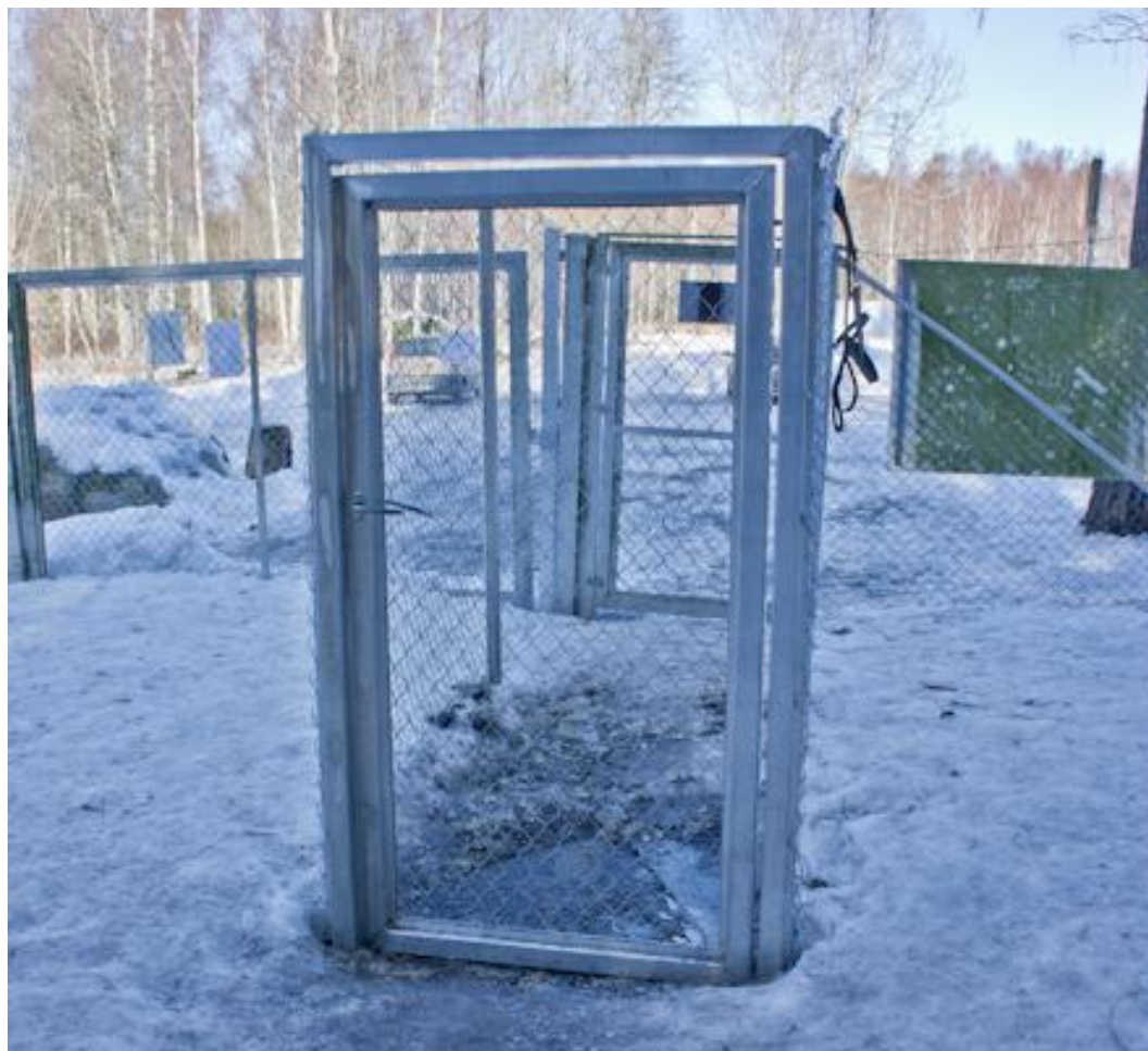
Kuva 17. Suvilahden puistojen portit ovat huonossa kunnossa talvella, kun jää ja lumi tukkivat portin alustan.

Etenkin pienten koirien puolella portti oli hyvin tiukassa, kun jäätä oli päässyt kerääntymään portin alle niin paljon. Myös isojen koirien puolella käyttäjät olivat rikkoneet jäätä porttien alta, jotta kulkeminen helpottuisi, tai on ylipäättään mahdollista. Käyttäjät antoivat porttien talvikunnossapidosta negatiivista palautetta. Muuten portit ovat hyvässä kunnossa ja toimivia. Portit ovat korkeudeltaan samaa luokkaa kuin puiston muu aidoitus.