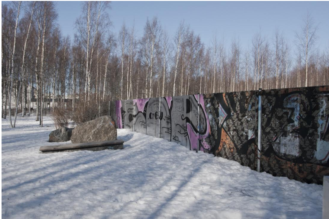
Kuva 10. Onkilahden koirapuistot on aidattu verkkoaidalla, mutta isojen ja pienten koirien puistot erottaa vahva puuaita.