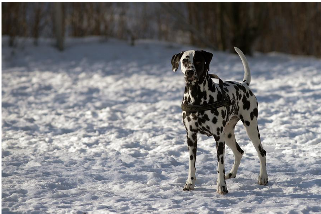
Kuva 6. Siistissä ja puhtaassa puistossa on mukava viettää aikaa (Sanna Hangelin).

Siisteys on yksi koirapuiston tärkeimpiä kriteerejä, mutta vaatii kaikkien käyttäjien panostusta. Vaskiluodon puisto on yleisesti ottaen hyvin siisti (Kuva 6), ja useat Vaasalaiset koirapuistojen käyttäjät antoivat hyvää palautetta Vaskiluodon koirapuiston siisteydestä. Puiston siisteys on tärkeä asia puiston viihtyisyyden kannalta, mutta myös koiran terveyttä ajatellen, on tärkeää pitää puisto puhtaana. Koiran jätökset korjaamalla, voidaan puisto pitää siistinä, ja kaikkien on mukava viettää siellä aikaa. Vaskiluodon puistossa ei näkynyt jätöksiä, muutamaa poikkeusta lukuun ottamatta. Puistossa on yksi suuri jäteastia ja lapio, joiden avulla voidaan pitää puisto hyvässä kunnossa.