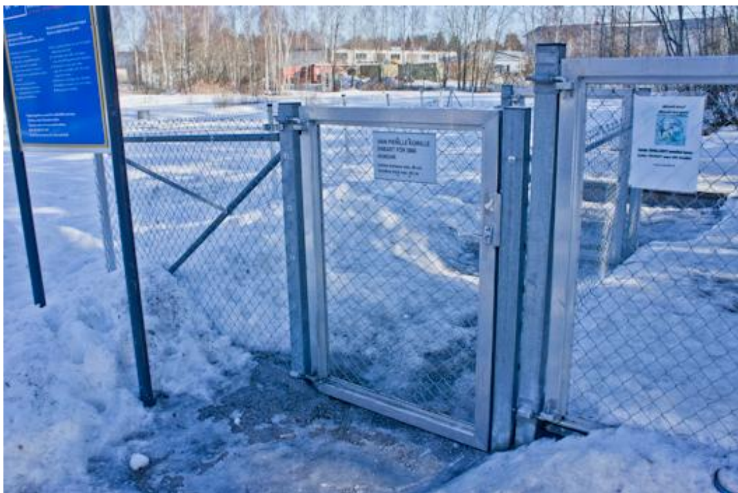
Kuva 18. Pienten koirien puolella eteinen on hyvin suuri (Sanna Hangelin).

Kummankin puiston eteinen on samaa verkkoaitaa kuin muu puisto. Myös aidan korkeudet ovat samaa muun puiston kanssa (Kuva 18).