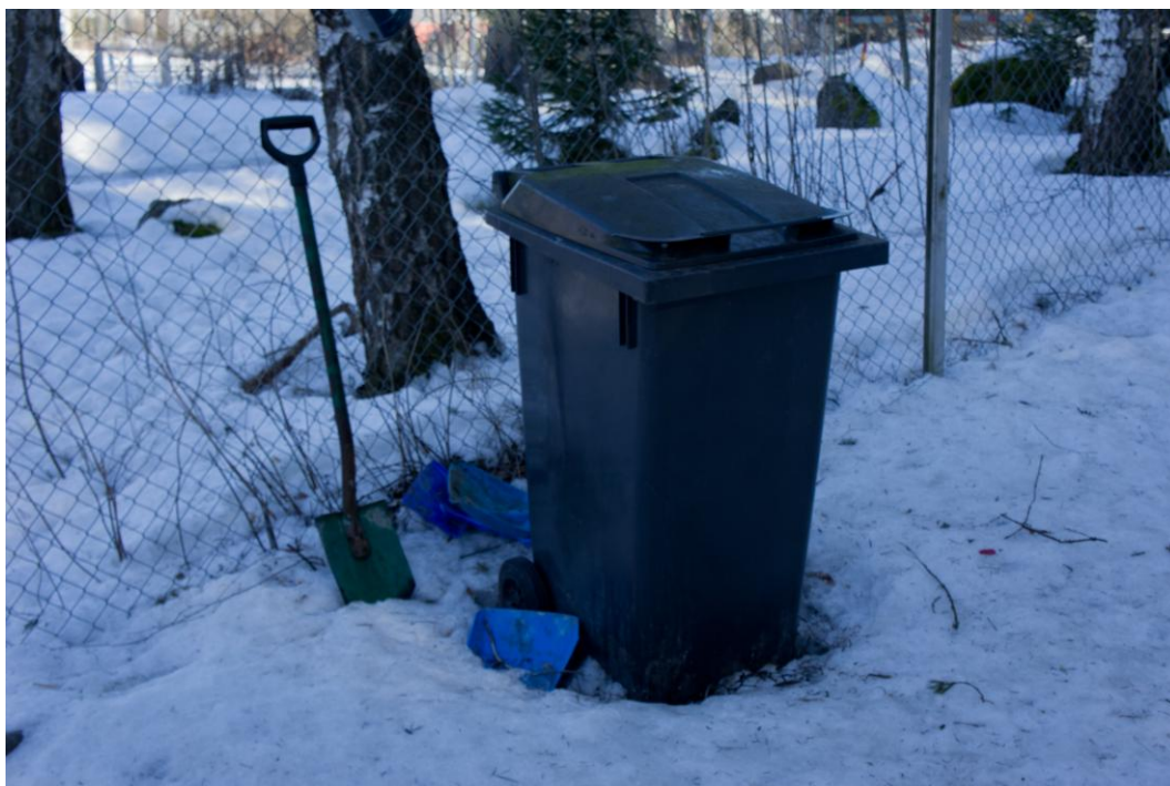
Kuva 21. Isojen koirien puolella on kannellinen jäteastia ja lapiota.

Etenkin isojen koirien alue on niin suuri, että jätöksiä saattaa helposti jäädä alueelle omistajien huomaamatta. Isojen koirien puistosta käyttäjät antoivat palautetta, että puistossa saattaa silloin tällöin olla siivoamattomia jätöksiä. Pienten koirien puoli on helpompi pitää siistinä, sillä alue ei ole niin suuri.