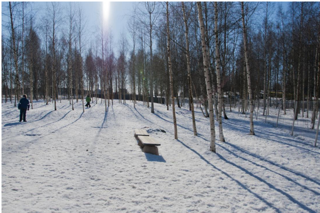
Kuva 12. Isojen koirien puistossa on paljon puita tuomassa puistoon mielekkyyttä.

Koirapuistojen ympäristö, koirien kannalta, ei ole niin virikkeellinen, kuin muissa Vaasan koirapuistoissa. Puita isojen koirien aitauksen puolella on paljon, mutta pensaita, kiviä ja muita virikkeitä on hyvin vähän (Kuva 12). Pienten koirien puolella on melko vähän nuuskittavia, ja mielenkiintoisia kohteita koirille. Vapaata juoksuutilaa on kuitenkin paljon. Maasto on huomattavasti muita Vaasan koirapuistoja tasaisempi.