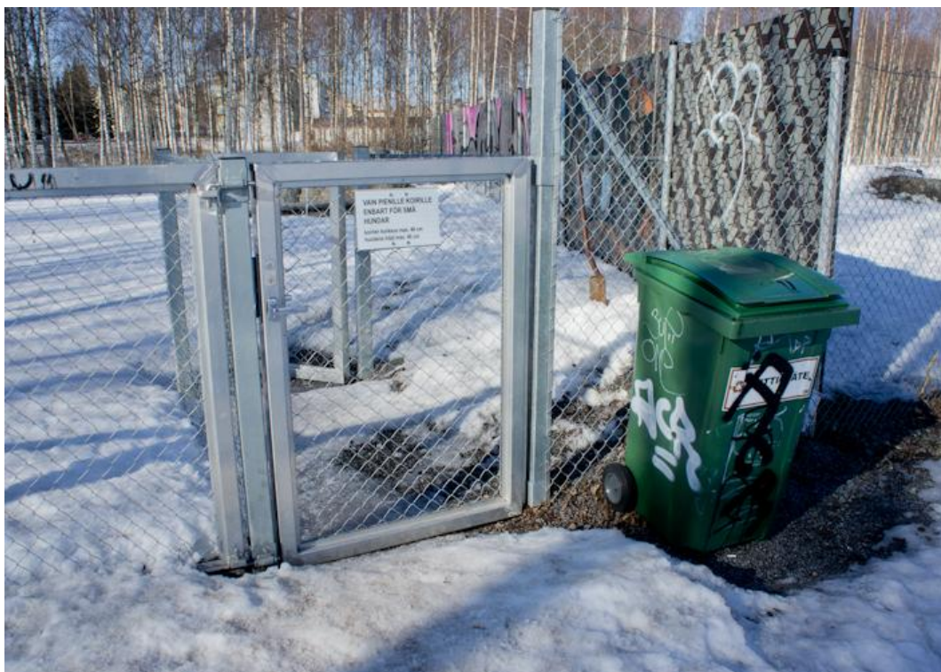
Kuva 13. Pienten koirien aitauksen edustalla on kannellinen jäteastia (Sanna Hangelin).

Onkilahden puistot ovat yleisesti ottaen hyvin siistissä kunnossa. Molemmissa puistoissa on omat jäteastiat, sekä lapiot (Kuva 13). Koirien jätöksiä ei alueella näkynyt. Onkilahden puistojen siistinä pitoa varmasti parantaa puistojen helppo ja yksinkertainen maasto. Koiraa on helppo pitää silmällä koko alueella, kun tiheää metsäaluetta puistossa ei ole. Omistajan on mahdollista nähdä koiransa lähes koko ajan, ja täten jätökset saadaan todennäköisemmin korjattua.