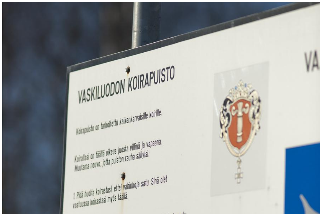
Kuva 8. Vaskiluodon koirapuisto on tarkoitettu kaikenkarvaisille koirille (Sanna Hangelin).

Puiston ulkopuolella on ohjetaulu puiston säännöistä ja käyttöohjeista, jotka on tarkoitettu kaikkien puiston käyttäjien noudatettaviksi (Kuva 8). Infotaulu on kaikkien käyttäjien nähtävillä, heti puiston sisäänkäynnin vieressä. Puiston sääntöjä on tärkeää noudattaa, jotta puisto pysyy miellyttävänä ja turvallisena paikkana niin koirille, kuin niiden omistajille.