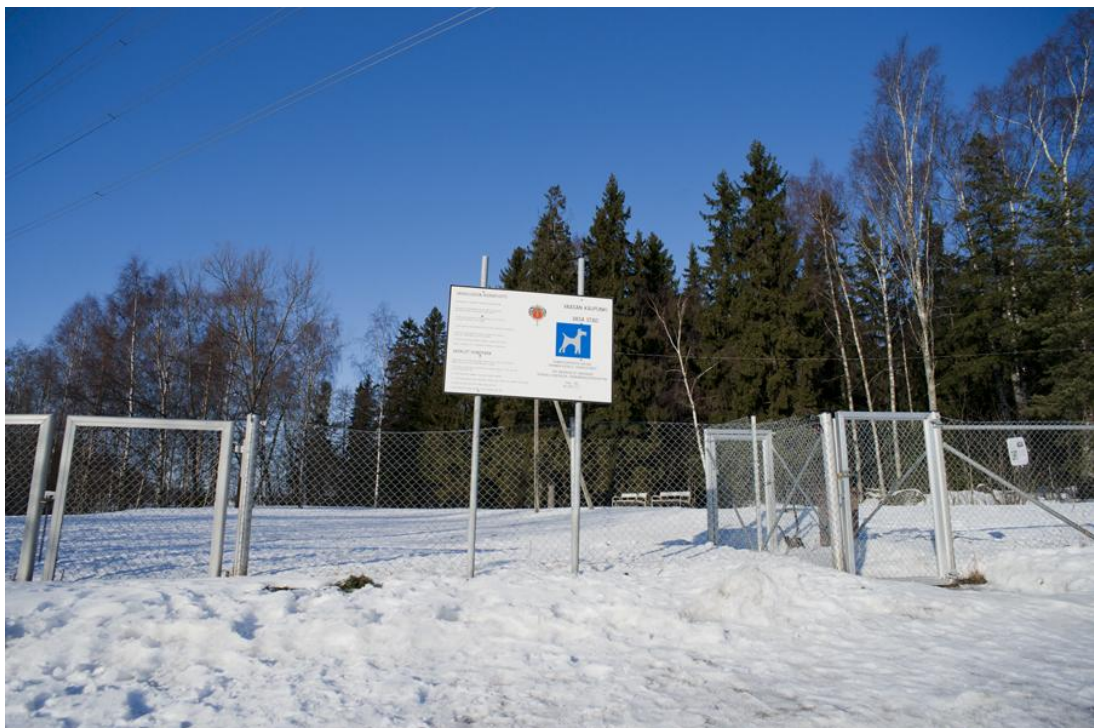
Kuva 4. Vaskiluodon koirapuistossa ei ole erikseen aidattua aluetta pienille ja isoille koirille (Sanna Hangelin).

Koirapuisto Vaskiluodon alueella on pinta-alaltaan noin 2500m 2 . Alue on kohtalaisen suuri, ja siellä pääsee nopeajalkainenkin koira juoksemaan melko hyvin (Kuva 4). Vaskiluodossa ei ole aidattu erikseen aluetta isoille ja pienille koirille, mikä saattaa vaikuttaa puiston turvallisuuteen ja käyttöasteeseen. Pienet koirat jäävät helposti isompien koirien jalkoihin, minkä vuoksi voi syntyä vaaratilanteita.