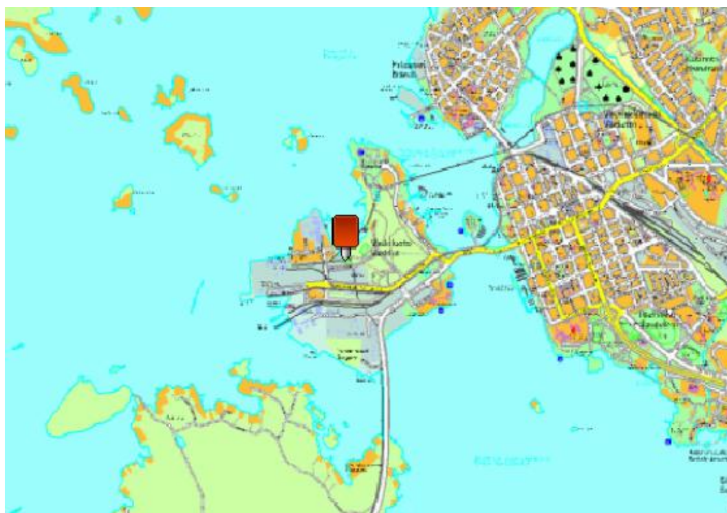
Kuva 2. Vaskiluodon koirapuisto (Vaasan kaupungin karttapalvelu 2012).

Vaasan vaskiluodon koirapuisto on suosituksa käytössä ympäri vuoden. Koirapuisto sijaitsee Kaarlentiellä, lähellä Vaskiluodon satama-aluetta, sekä pururadan ja ulkoilureittien välittömässä läheisyydessä (Kuva 2).