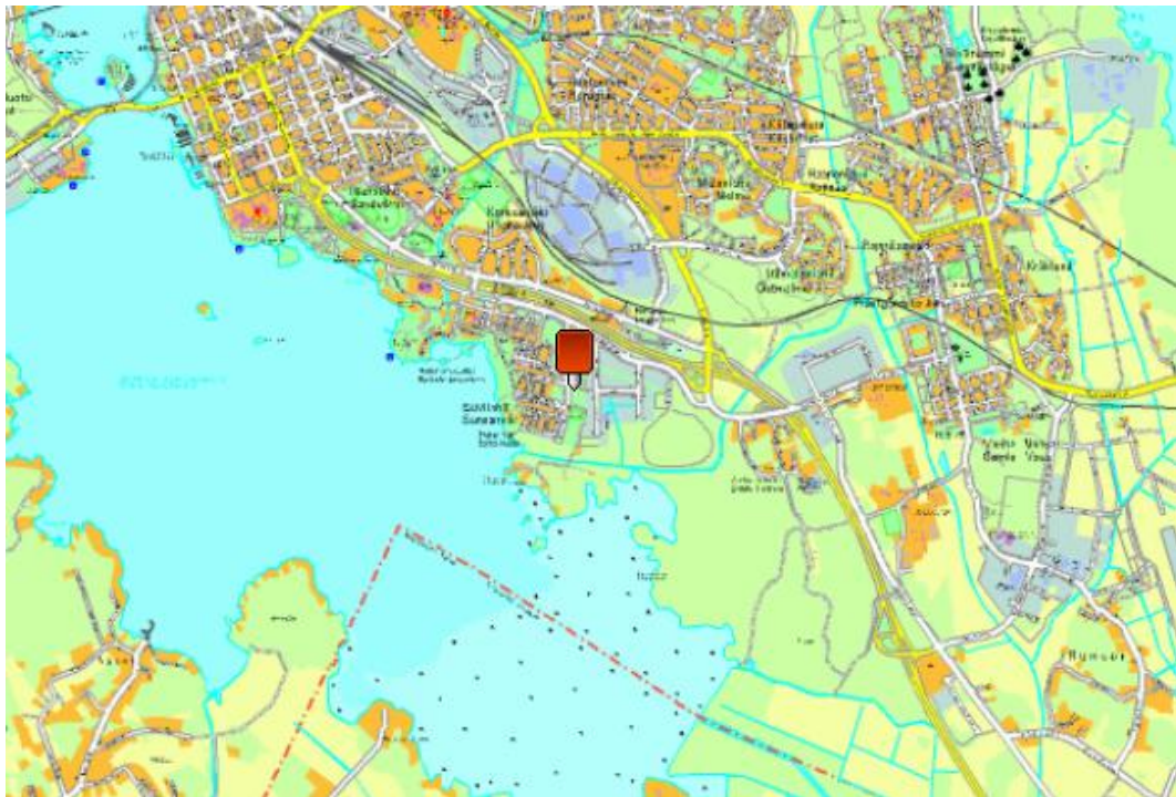
Kuva 15. Suvilahden puistot (Vaasan kaupungin karttapalvelu 2012).

Suvilahden koirapuistot sijaitsevat Suvilahdessa, Suvilahdentiellä (Kuva 15). Puistot keräävät runsaasti käyttäjiä ympäri vuoden, sillä alue on viihtyisä ja mielenkiintoinen. Alueen huomattava positiivinen puoli on isojen ja pienten koirien erilliset aitaukset. Koirapuistot sijaitsevat Suvilahden asuinalueen läheisyydessä, metsäisellä alueella. Lähimaastossa on myös pururata ja hyvät ulkoilumahdollisuudet.