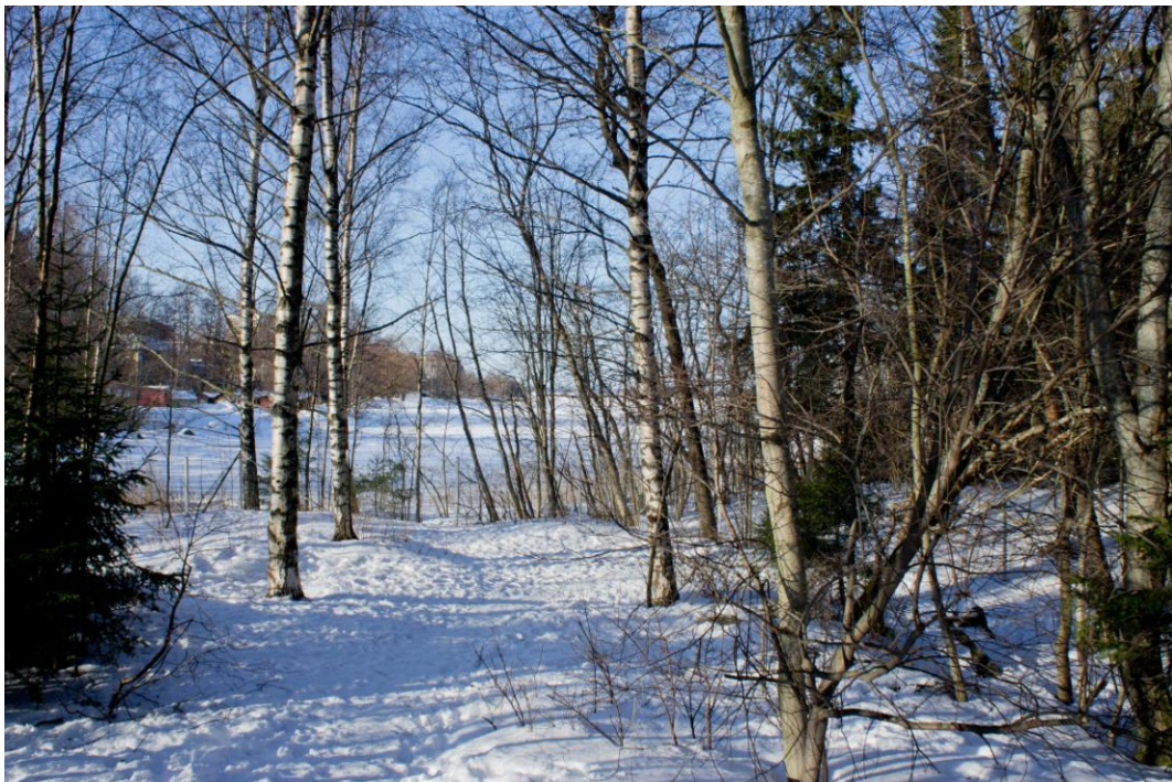
Kuva 5. Metsäinen maasto tarjoaa koiralle mielenkiintoisen ympäristön leikkimiseen (Sanna Hangelin).

Vaskiluodon metsät tarjoavat ihanteellisen alueen koirapuistolle. Alue on hyvin luonnonmukainen ja puistossa on melko paljon ympäristön tarjoamia virikkeitä. Puita, pensaita ja kiviä on paljon, mikä tekee puistosta koiralle mielenkiintoisen (Kuva 5). Alueella on kuitenkin myös riittävästi tilaa leikkimiselle ja vapaana juoksemiselle. Maasto on myös korkeuseroiltaan vaihtelevaa, mikä tekee puistossa mielenkiintoisemman. Muita rakennettua virikkeitä, luonnon tarjoaminen yksityiskohtien lisäksi kuitenkin ole.