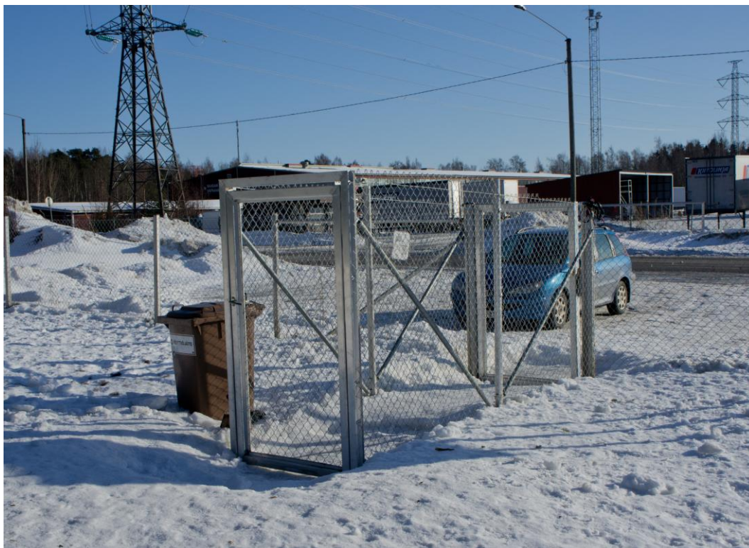
Kuva 3. Vaskiluodon puistossa portti on hyvässä kunnossa ja eteinen on riittävän suuri.

Puistoon kulkee myös toinen portti, joka on varattu huoltotoimenpiteitä varten. Tämä portti on huomattavasti edellistä leveämpi, mutta materiaali on samaa kuin aidassa sekä toisessa kulkuportissa. Huoltoportti on suljettu vahvalla lukolla, ja se pidetään suljettuna muilta käyttäjiltä.