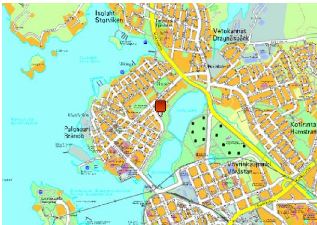
Kuva 9. Onkilahden aidatut koirapuistot sijaitsevat viihtyisässä ympäristössä, Onkilahden rannassa (Vaasan kaupungin karttapalvelu 2012).

Onkilahden koirapuistot sijaitsevat kauniissa ympäristössä Vapaudenpolulla Palosaarella, Onkilahden rannassa (Kuva 9). Onkilahdessa on erilliset aidatut alueet pienille sekä isoille koirille, mikä lisää puistojen suosiota.