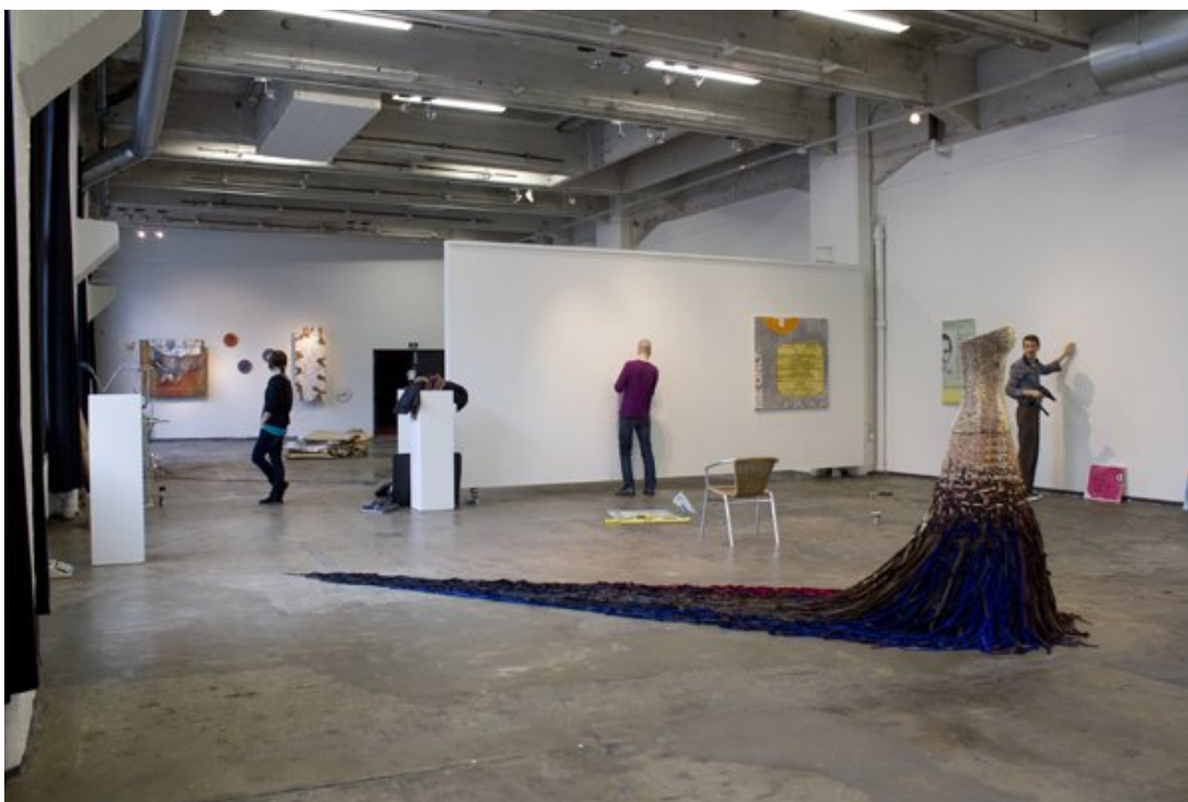
Näyttelyn pystytystä Kaapelitehtaalla

Viikko Kaapelitehtaalla oli yllättävän raskas, mutta samalla myös opin paljon. Tilanne oli minulle uusi, koska en ole ennen ollut pystyttämässä noin isoa näyttelyä. Paikka oli outo. Yhteistyö muiden kanssa oli vaativaa. Välillä voi olla vaikeaa sovittaa yhteen erilaisia näkemyksiä asioista. Piti vielä muistaa paljon asioita, jotka pitää hoitaa ennen näyttelyn avajaisia. Kaikki nämä veivät yllättävän paljon voimia. Mutta nyt tiedän paljon asioita näyttelyn ripustamisesta ja järjestämisestä, joita osaan tulevaisuudessa vastaavassa tilanteessa ottaa huomioon.