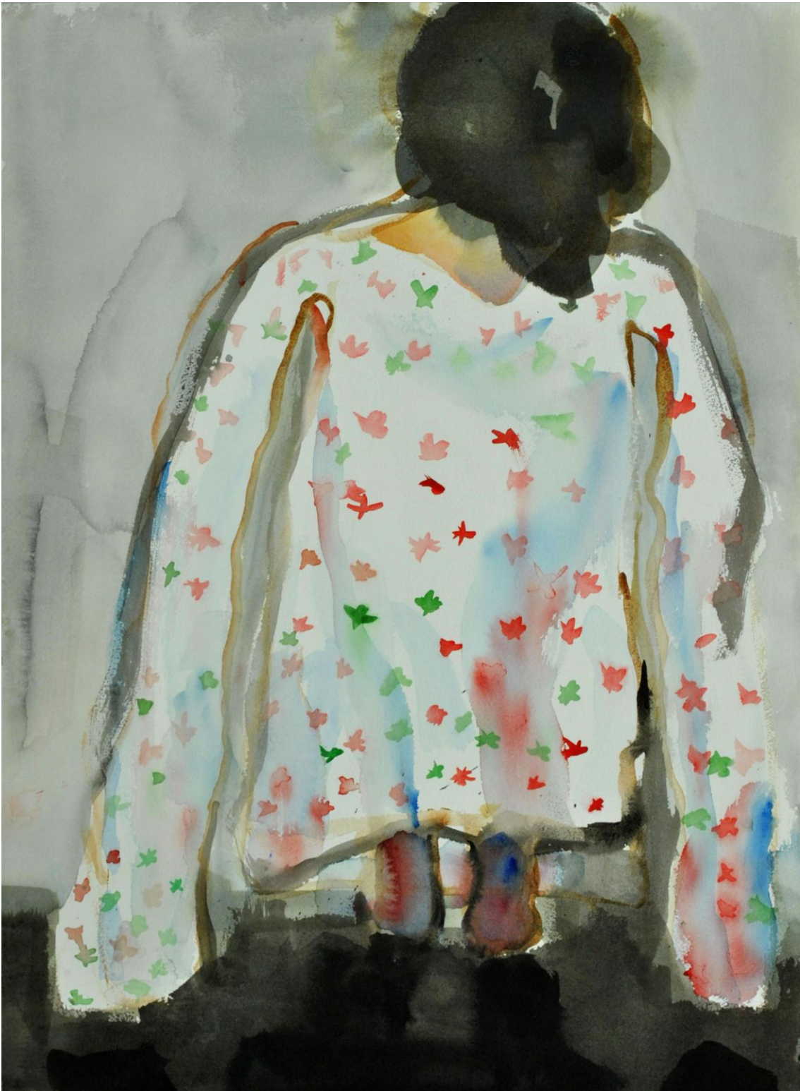
"Kasvukipuja", 2012, akvarelli