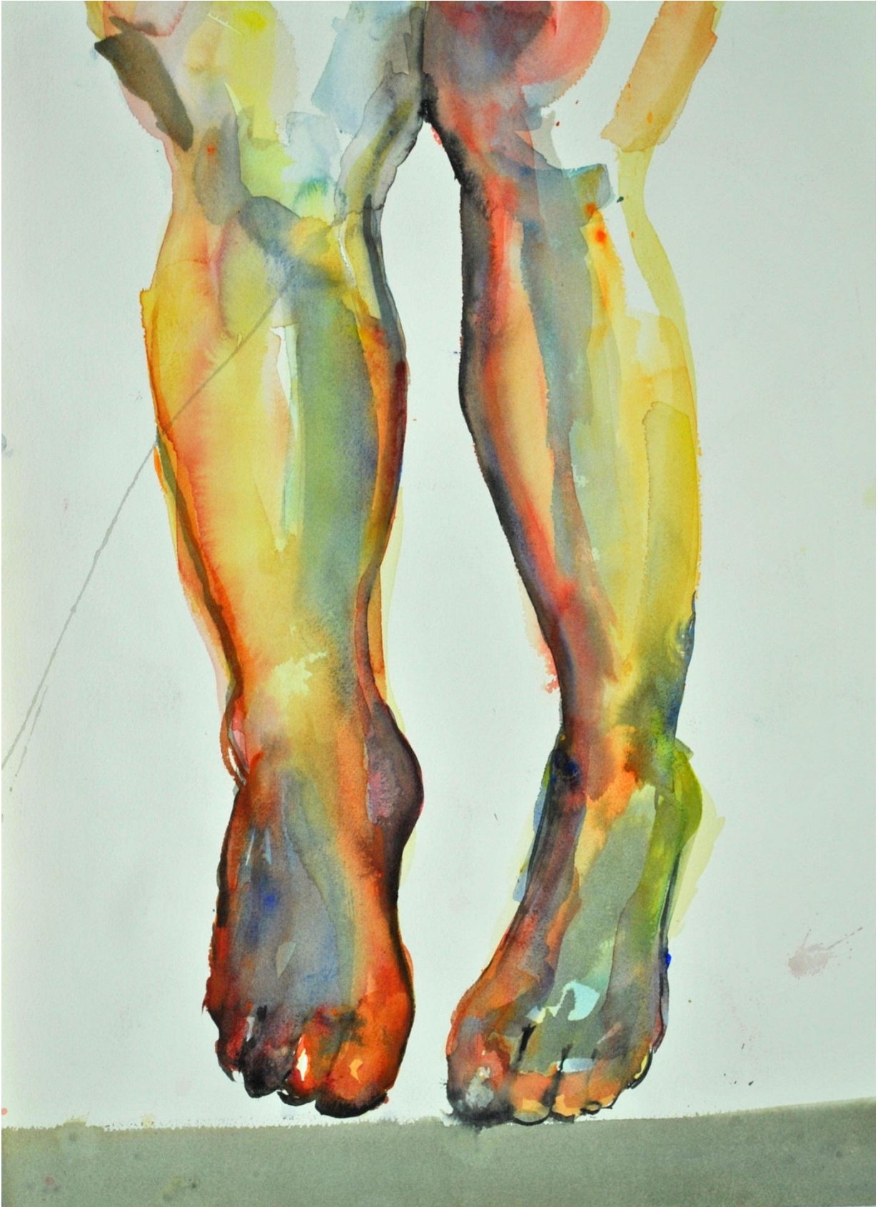
Hipaisu, 2012, akvarelli