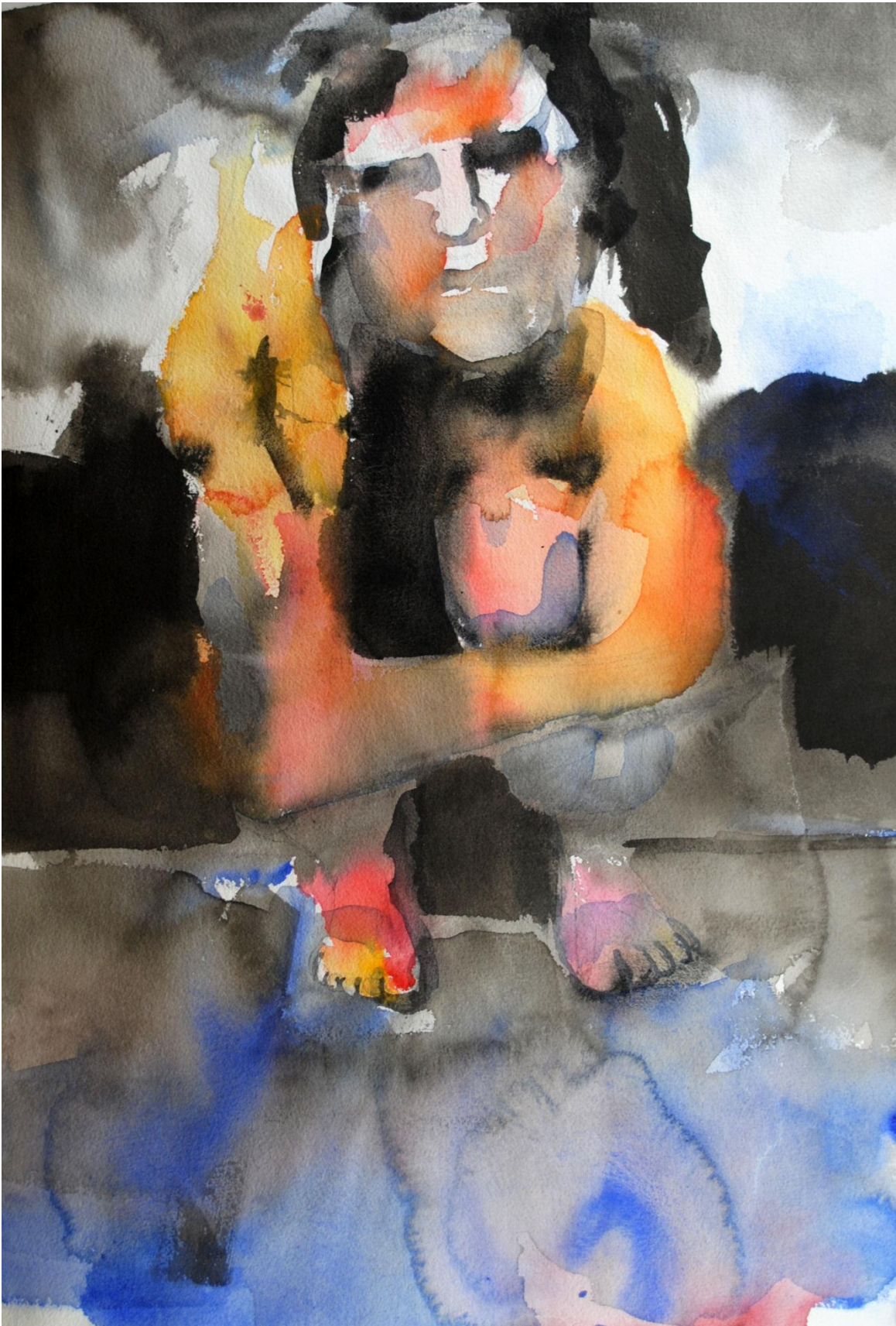
Kyykssä, 2012, akvarelli