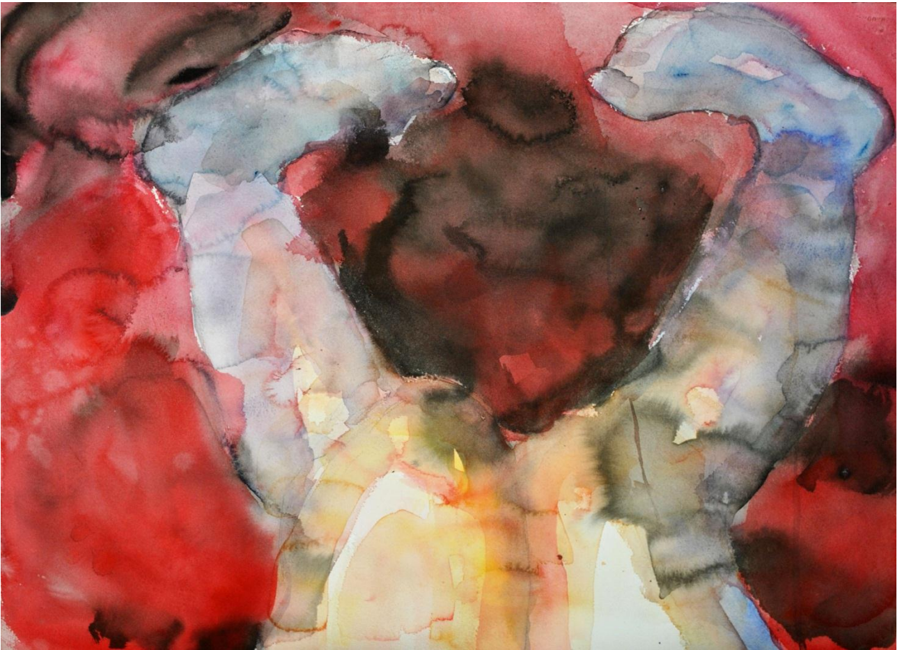
Yhdessä, 2012, akvarelli & tussi