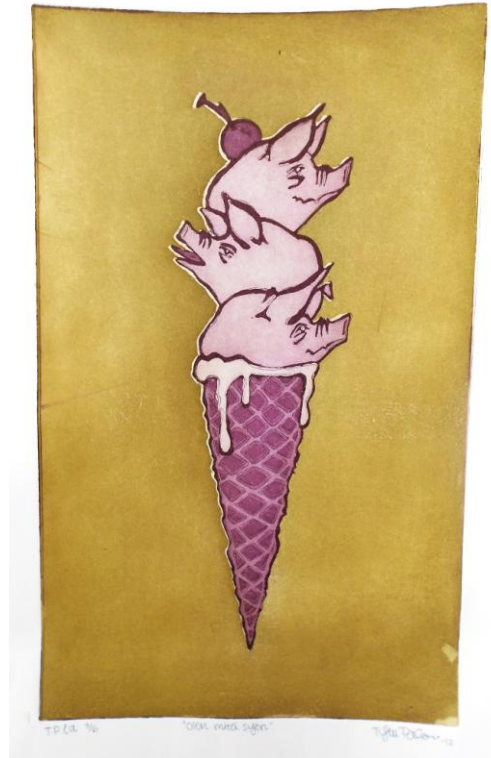
”Olen mitä syön”, 2012

Olen ylpeä siitä, että voin päättää taidekouluni juuri näihin kyseisiin töihin. Katsellessani teoksia näen, kuinka paljon olen kehittynyt, mutta myös kuinka paljon olen kasvanut ihmisenä. Osaan käsitellä ongelmiani töitteni kautta ja olen oppinut nauramaan itselleni. Kun nyt katson peilistä itseäni, en näe enää sitä koulukiusattua hiljais- ta ja haavoittunutta tyttöä. Näen vahvan naisen, joka kaikkien kokemuksiansa kautta on oppinut olemaan oma itsensä ja hyväksyy itsensä tällaisena kuin on. Kaunis sisältä ja ulkoa.