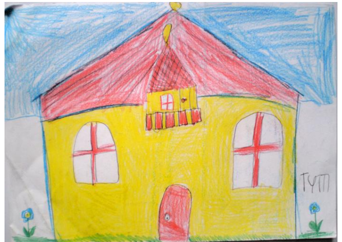
”Minun kotini”, 1996

Erityisen raskasta muutto oli 9-vuotiaana, kun muutimme Perttelin maaseudulta Uuteenkaupunkiin. Asuimme Perttelissä vain noin kolme vuotta, mutta olin aloittanut siellä koulun ja oli vaikeaa jättää se kesken kolmannen luokan alussa. Tuntuu, että juuri tuo aika oli kriittisintä aikaa henkiselle kehitykselleni.