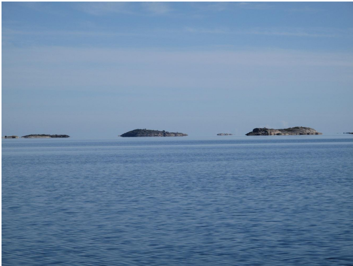
Kobbar i Åbo skärgård

”Skärgårdshavet är Finlands internationellt sett mest värdefulla område och hyser mera utrotningshotade växter och djur än något annat område i Finland. Den småskurna skärgården med 41 000 öar och skär, vilka inbegriper ett stort antal olika naturtyper, gör att geologin i området är högintressant.” (Skärgårdshavets biosfärområde)