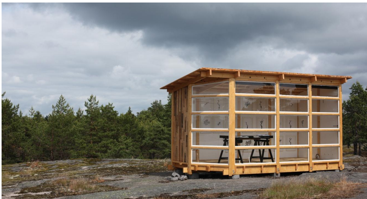
Sandra Nybergs verk "ECONtainer"

Nybergs verk "ECONtainer" är ett verk, som in sin fysiska skepnad är en cirka tio kvadratmeter stor byggnad i trä och glas byggd med gamla metoder utan skruv och spik. Byggnaden är en installation, ett mobilt arbetsutrymme och galleri. Byggnaden består av isärtagbara element. Nyberg uppförde byggnaden i Rumar, Korpo i april 2011 och reste sedan, en månads tid, från sitt hem i Pargas för att tillbringa åtta timmars arbetsdagar i byggnaden.