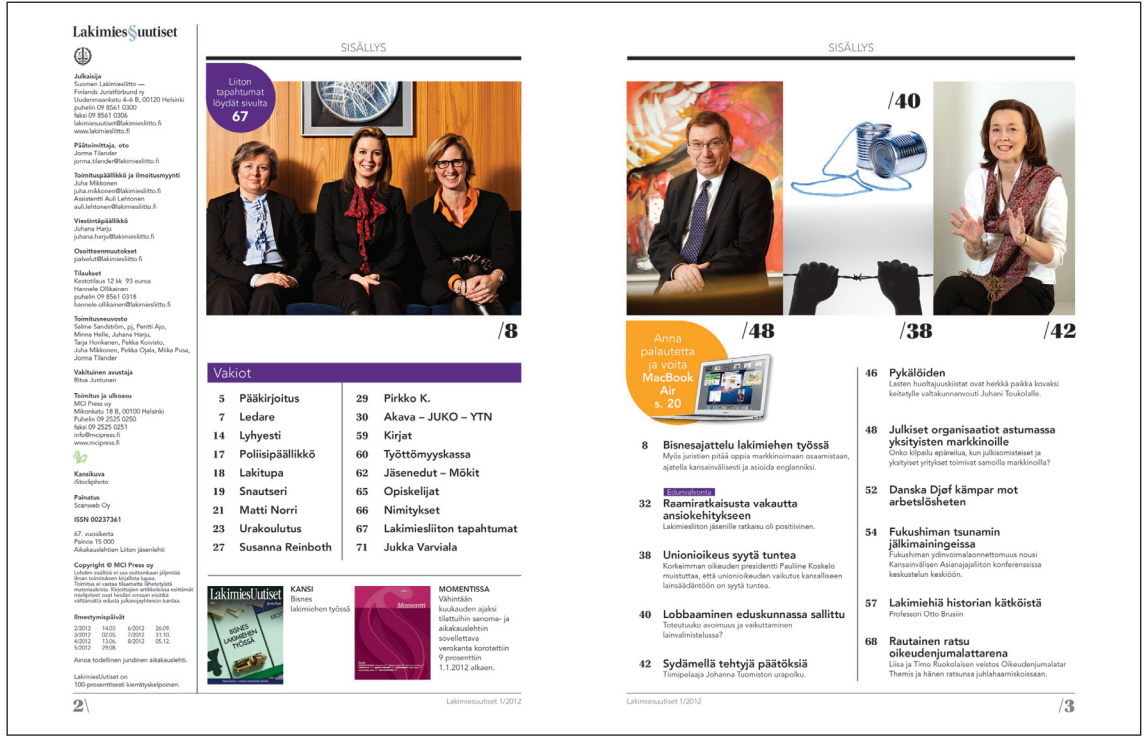
Kuva 8. Ylhäällä: Sisällys ennen uudistusta. Alhaalla: Sisällys uudistuksen jälkeen.