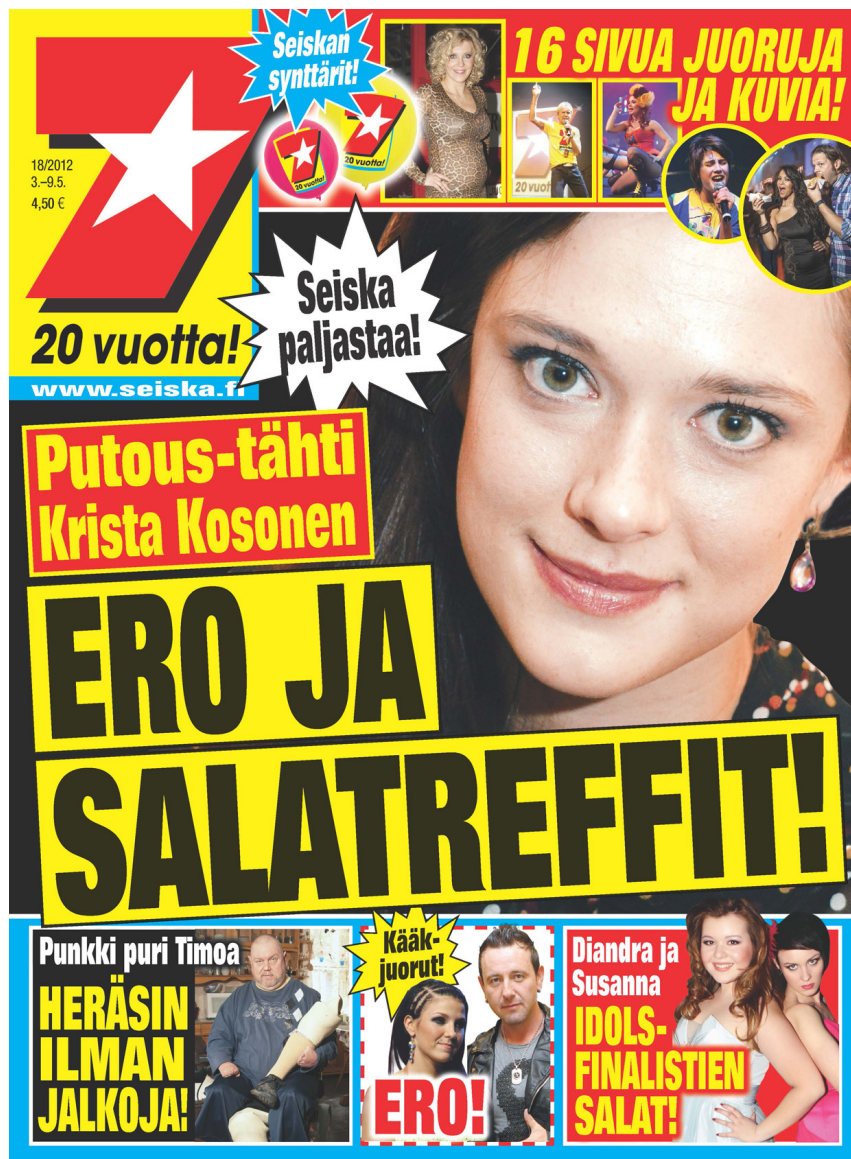
Kuva 1. Esimerkki ei ammattilehdestä: Seitsemän päivää