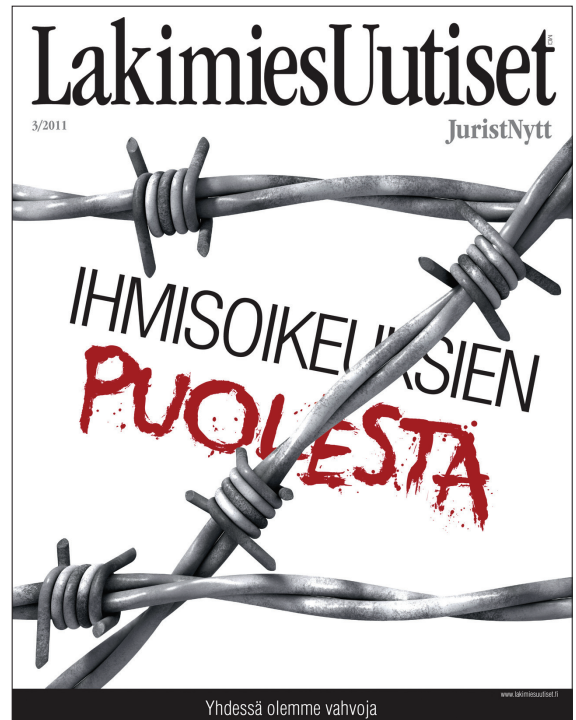
Kuva 3. Lakimiesuutisten vanhoja kansikuvituksia