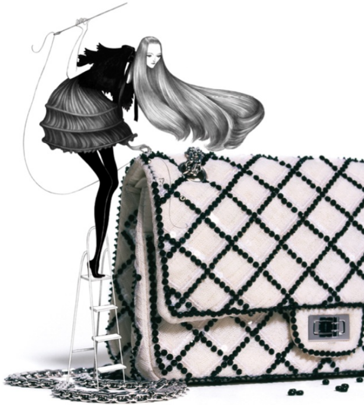
Kuva 1. Muotilehtikuvitusta