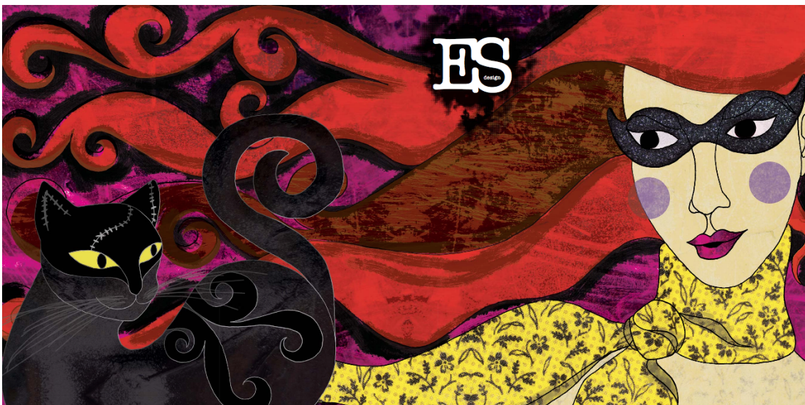
Kuva 3. ESdesign illustration portfolio

Tein ennen tutkielman aloittamista opinnäytetyön produktio-osuutena painetun kuvitusportfolion tulevaa kuvallisen viestinnän alan yritystäni varten. Portfolion nimi on ESdesign illustration portfolio. (Katso kuva 3.)