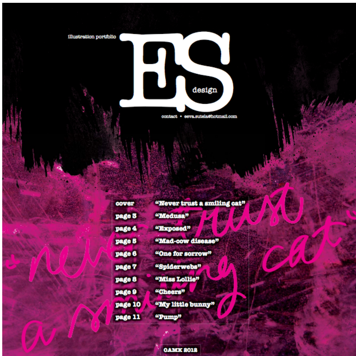
Kuva 5. Portfolion tietosivu