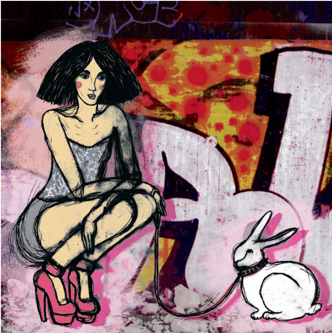
Kuva 4. Esimerkki portfolioissa käytetystä kuvitustekniikasta

Pääasialliset innoittajani produktiossa olivat muoti, naiset, eläimet ja synkkähenkisyys. Lisäksi halusin tuoda esiin kuvitustyyllilleni ominaisia piirteitä, joita ovat muun muassa värikylläisyys, tekstuurien käyttö sekä grungemainen rosoisuus ja harkittu huolittelemattomuus.