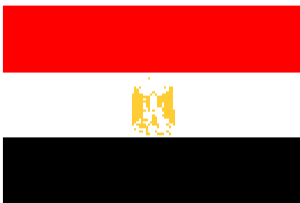
Kuva 1. Egyptin lippu (Suomen suurlähetystö 2011.)

Egyptin virallinen nimi on Egyptin arabitasavalta, sijaitsee Afrikan pohjoiskulmassa ja on pinta-alaltaan 1 001 450 km 2 . Egyptin väkiluvun arvio on noin 82,1 miljoonaa ihmistä (2012), vuotuinen väestönkasvu on 2,1 %. Maan pääkaupunki on Kairo, ja maa jakaantuu 28 maakuntaan, 217 kaupunkiin ja 4617 kylään. Egyptissä on muslimeja 90 % väestöstä, koptikristittyjä 9 % ja muita kristittyjä yksi prosentti väestöstä.