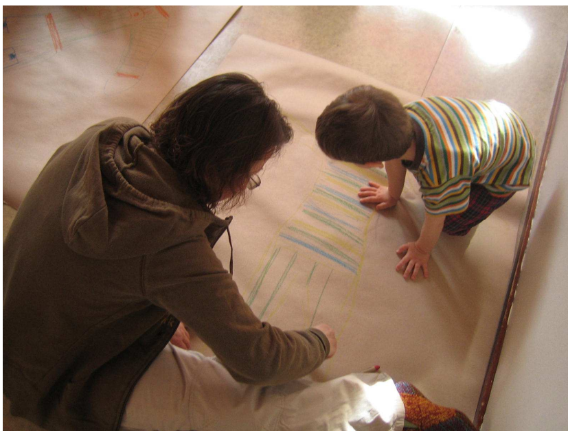
KUVA 2. Vanhemman ja lapsen yhteinen piirustus

Sadutuksen perusidea on yksinkertainen: aikuinen kuuntelee ja kirjaa lapsen kertoman tarinan sellaisenaan, kun lapsi sen kertoo. Tarinan ollessa valmis, aikuinen lukee sen kertojalle, jotta tämä voi tehdä siihen korjauksia, mikäli haluaa. Välineiksi riittää siis kynä ja paperi. Sadutus rohkaisee monipuoliseen ilmaisuun, kommunikaatioon, toisten arvostamiseen, eri näkökulmien esille tuomiseen ja huomioimiseen sekä aktiivisuuteen ja aloitteellisuuteen. Aito kuuntelu luo hyvät edellytykset kasvulle, luovuudelle, kehittymiselle ja oppimiselle. Sadutus on menetelmä, jonka avulla lapsi voi käsitellä turvallisesti tunteitaan. Tutkimusten mukaan myös lapsen itsetunto kasvaa, kun hän kokee olevansa tärkeä.