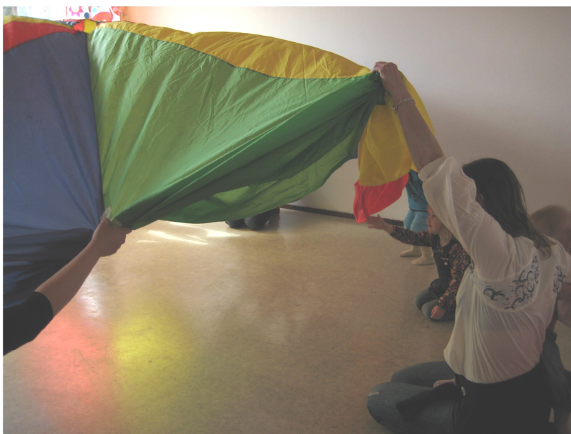
KUVA 3. Yhteinen varjoleikki

Ryhmätapaaminen jatkui tämän jälkeen yhteisellä liikunnallisella leikillä. Leikin tarkoituksena oli mahdollistaa lapsille heidän luontainen tapansa purkaa energiaa pitkän keskittymisjakson jälkeen. Leikin tarkoituksena oli myös vahvistaa ryhmän yhteisöllisyyttä ja me-henkeä. Yhtenä liikunnallisen leikin välineenä käytimme leikkivarjoa ja ilmapalloja. Näillä välineillä yhteisestä leikistä muodostui suosittu ja iloinen hetki.