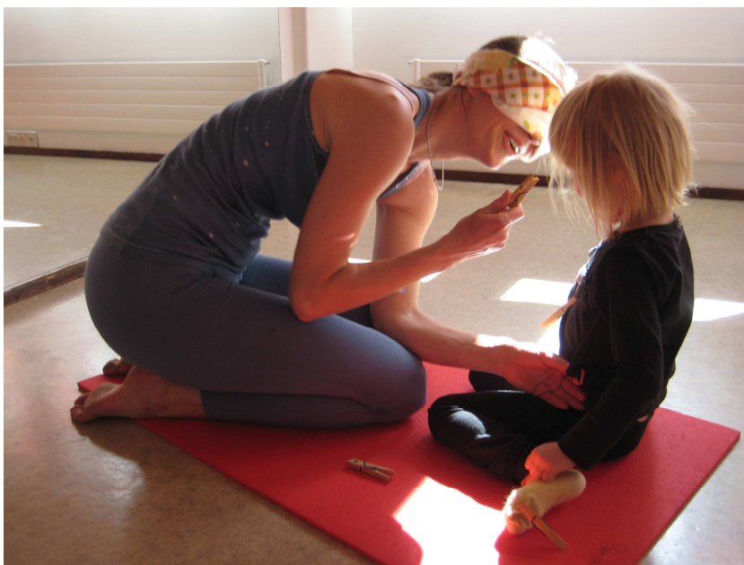
KUVA 1. Pyykkipoikaleikki

Tämän jälkeen siirryimme toiminnalliseen vaiheeseen, joka alkoi vuorovaikutusleikillä. Jernbergin ja Boothin (2003, 343, 348–349) mukaan vuorovaikutusleikki on aikuisten ja lasten välistä sekä lapsiryhmän keskeistä leikkiä, jonka tavoitteena on kohottaa itsetuntoa ja lisätä luottamusta toisiin ihmisiin tarjoamalla konkreettisia, henkilökohtaisia ja myönteisiä kokemuksia. Vuorovaikutusryhmässä voidaan toteuttaa etukäteen suunniteltua leikkiä tai muuta vuorovaikutuksellista toimintaa. Vuorovaikutusleikki soveltuu monenlaisille ikäryhmille. Vuorovaikutusleikit ovat lyhyitä, innostavia, turvallisia, hauskoja ja palkitsevia. Toiminnallisissa ryhmissä toteutettujen vuorovaikutusleikkien valinnassa otimme huomioon edellä mainitut asiat. Yksi ryhmässä käyttämistämme vuorovaikutusleikeistä oli pyykkipoikaleikki. Leikissä sidotaan vanhemman silmät huivilla ja ohjaaja piilottaa viisi pyykkipoikaa jokaisen lapsen vaatteisiin. Vanhemmat etsivät pyykkipojat lapsen vaatteista. Kun kaikki pyykkipojat on löydetty, vaihdetaan osia.