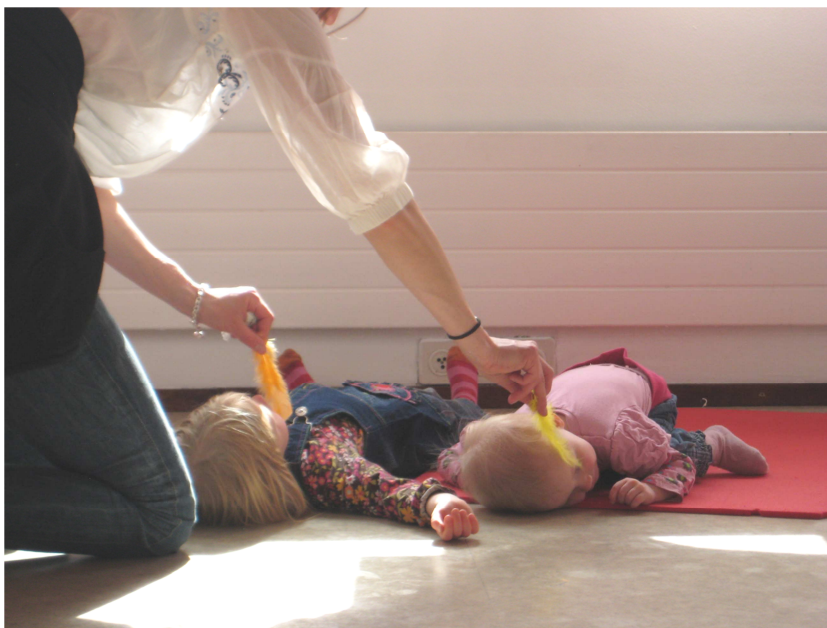
KUVA 4. Rentoutuminen höyhensilitystä käyttäen

Ryhmätapaamisten lopussa tarjottiin lapsille mehua ja aikuisille kahvia herkkui- neen. Herkuttelun jälkeen lapsille järjestettiin oma ohjattu leikkihetki. Lasten ohjatun leikkihetken suunnitteli ja ohjasi opinnäytetyömme ohjaaja Punahilkas- ta. Lasten leikkihetken aikana oli suunnitelmisamme keskustella yhdessä van- hempien kanssa ennalta sovitusta aiheesta, joka käsittelisi vanhemman ja lap- sen välistä vuorovaikutusta. Tämän lisäksi tarkoituksenamme oli jokaisen ryh- mätapaamisen lopuksi pyytää vanhemmilta palautetta ryhmätoiminnasta.