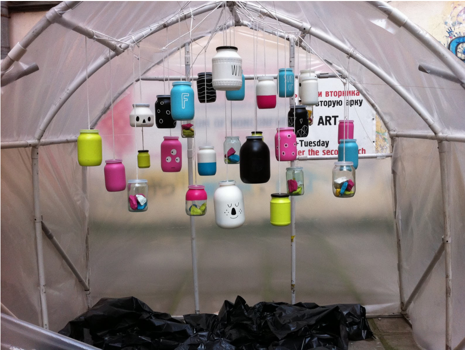
Kuva 1. Pietarin Pushkinskya 10.

KuTu – kulttuurista tulevaisuutta -hankkeen tavoitteena oli lisätä luovien alojen vaikuttavuutta kansainvälistymisen, valtakunnallisen luovien alojen kehitystyön, Joensuu seudun kulttuuri-, nuoriso ja luovien alojen kehittämistoiminnan koordinoimisen ja Itä-Suomi yhteistyön tiivistymisen kautta. Hankkeen tavoitteena oli, että se luo mahdollisuuksia toimialojen rajapinnat ylittävälle yhteistyölle kulttuuri-, nuoriso ja luovien alojen miniklustereiden välillä. Lisäksi tavoitteeksi asetettiin, että hanke tulee olemaan osa ammattikorkeakoulujen välistä, uutta ISAT-yhteistyötä, ja luo mahdollisuuksia uudelleenlaiselle hankeyhteistyölle. Hankkeen ensisijaisina kohderyhminä ja hyödyn saajina olivat Pohjois-Karjalan kulttuuri-, nuoriso- ja luovien alojen toimijat, kehittäjät ja yrittäjät. Lisäksi kohderyhmänä olivat korkeakoulujen opiskelijat ja henkilöstö sekä Pohjois-Karjalan aluekehittäjät.