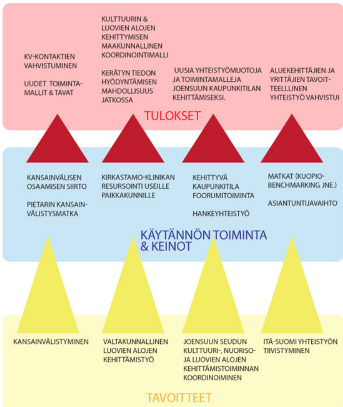
Kuvio 1. Hankkeen tavoitteet, käytetyt keinot tavoitteiden saavuttamiseksi ja päällimmäiset tulokset.