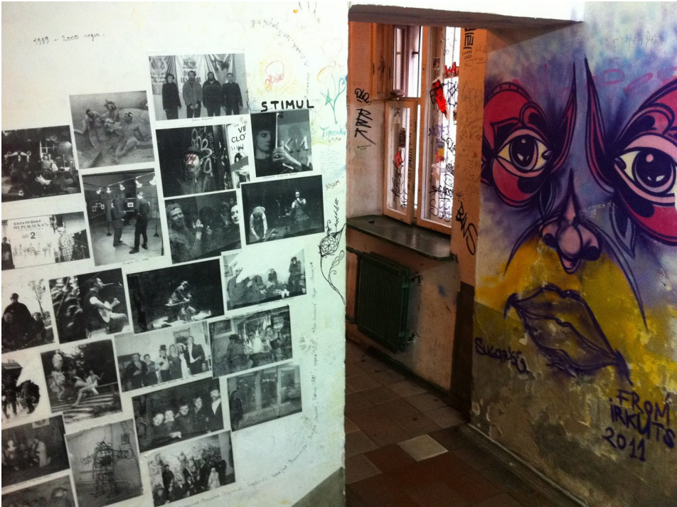
Kuva 6. Pietarin Pushkinskaya 10.

Kansainvälistymisen tavoitteena oli tuoda kansainvälinen tutkimus- ja kokemustieto osaksi luovien alojen kehittämistä, syventää ja tiivistää kansainvälisiä kontakteja ja edistää luovien alojen asiantuntijuutta. Pietarin kansainvälistymismatka vahvisti koko Itä-Suomen alueen yritysten ja rajapintaan liittyvien toimijoiden kansainvälisiä kontakteja sekä auttoi omalta osaltaan ennakoimaan globaaleihin markkinoihin kansainvälisten luovien alojen esimerkkien avulla. Kansainvälisen osaamisen siirto edisti luovien alojen asiantuntijuutta antamalla uusia toimintamalleja ja -tapoja.