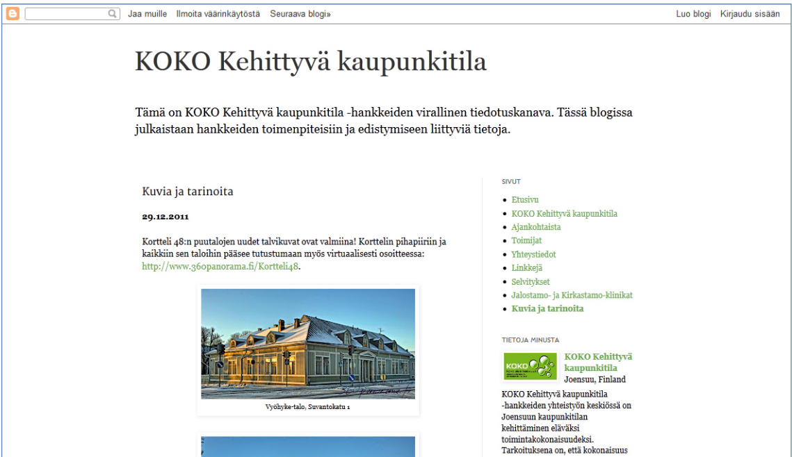
Kuva 5. KOKO Kehittyvä kaupunkitila -blogi: Kuvia ja tarinoita.