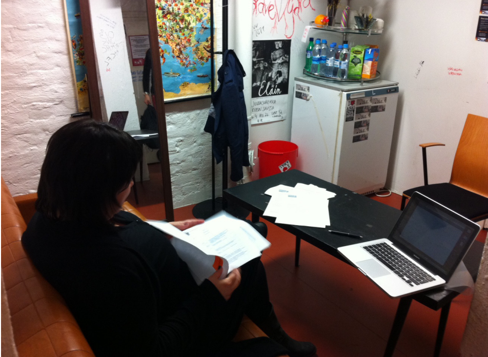
Kuva 7. Kirkastamo-klinikkaa pilotoitiin mm. Kulttuurikeskus Karjalantalon Kerubin takahuoneessa.

toimintamallista, jota verkoston kautta halutaan levittää muille alueille. Verkosto resursoi Kirkastamo-klinikoita kevään 2012 aikana mm. Lieksassa ja Nurmeksessa. Syksyllä klinikka-toimintaa pyritään levittämään myös muille paikkakunnille. Tavoitteena on, että valtakunnallista verkostoyhteistyötä jatketaan uusissa luovan alan jatkohankkeissa. Valtakunnallinen verkostoyhteistyö on toiminut Pohjois-Karjalan kehittäjäresurssina ja vastannut alueen luovien alojen kehitystarpeisiin.