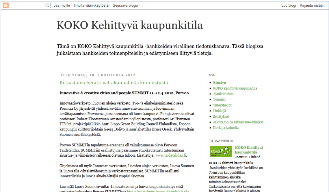
Kuva 4. Kehittyvä kaupunkitila -blogin etusivu.