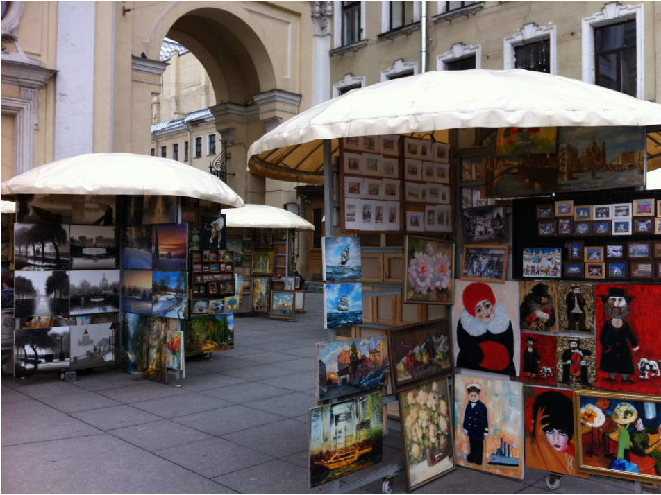
Kuva 2. Katukuva Pietarista.

KuTu – kulttuurista tulevaisuutta -hankkeen tavoitteiden saavuttamiseksi asetettiin neljä eri toimenpidekokonaisuutta, jotka olivat kansainvälistyminen, luovien alojen verkostotoiminnan kehitystyö ja tarpeisiin vastaaminen, kulttuuri-, nuoriso- ja luovien alojen kehittämistoiminnan koordinoiminen ja Itä-Suomi yhteistyön tiivistäminen.