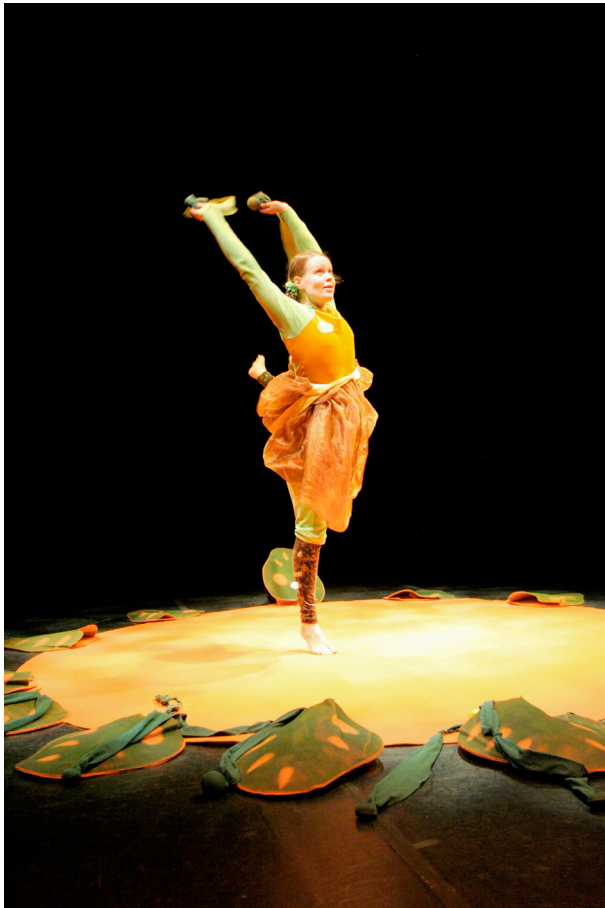
Kuva 3. Kukuluku.