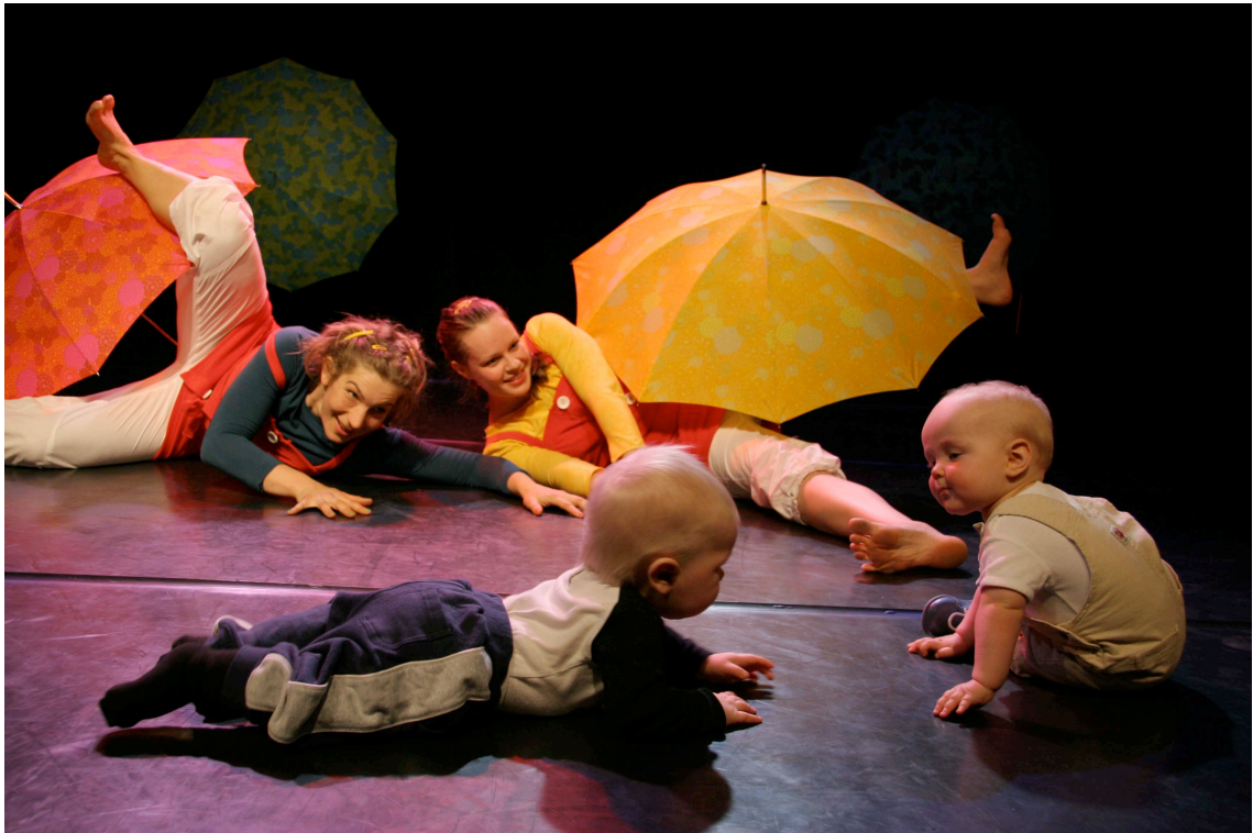
Kuva 2. Pieniä ihmeitä.

Esityksiä kertyi vuosina 2006–2008 yhteensä 58 kappaletta, joista kaksi esitystä oli ennakkoesityksiä.