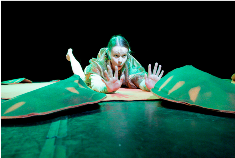
Kuva 4. Kukuluku.