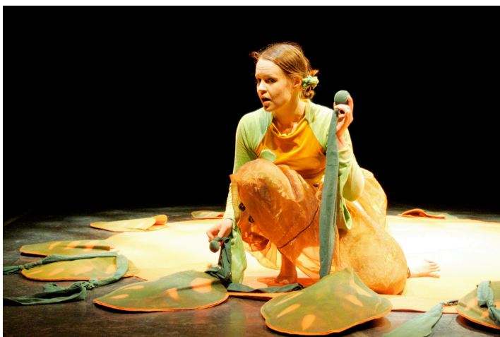
Kuva 5. Kukuluku.

Esityksessä käytetään vedellä täytettyä alumiinista vesipannua, josta tulee kurisevaa pulputusääntä pillillä puhallettaessa. Käytössä on myös keltainen vedellä täytettävä lintupilli, josta saa korkeita lintuääniä sekä kepin päässä oleva keltainen, pitkä silkki- nauha, jota heiluttamalla voi tehdä kuvioita ilmaan. Lisäksi viimeisessä kohtauksessa esiintymismaton taskuista vedetään esille jokaiselle lapsikatsojalle oma rytmimuna, joka on vihreän sukkahousunauhan sisässä.