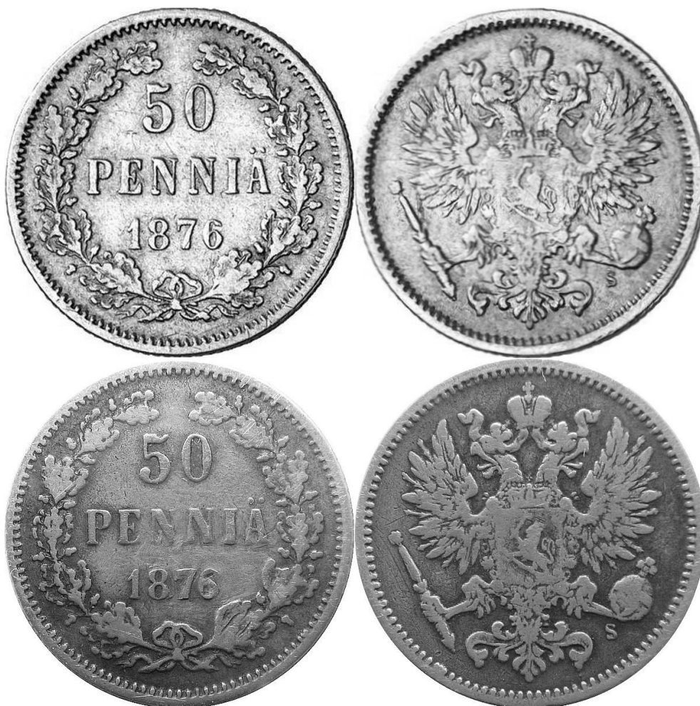
Kuva 1. Vuoden 1876 50 pennin hopearahojen vertailua. Ylempänä aito raha, alempana löytämäni väärennös.

Koska 50 pennin hopearaha vuodelta 1876 on jo reilusti yli 100 vuotta ollut himoittu ja siten kallishintainen keräilykohde, on siitä myös aikojen saatossa esiintynyt erilaisia väärennöksiä ja mukaelmia. Ja nyt omallekin kohdalle sattui erästä kokoelmaa arvioidessani kyseinen tapaus. Toki aluksi olin hyvinkin jännittynyt rahan löytyessä sekalaisesta rahaerästä – olisiko harvinaisuus löytynyt? Vaan eipä ollut, koska rahan lähempi tutkiskelu paljasti asian todellisen luonteen.