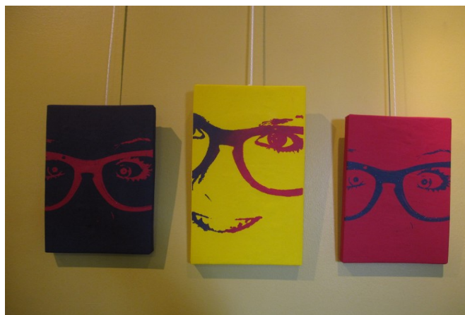
KUVA 4. Omakuva 1.