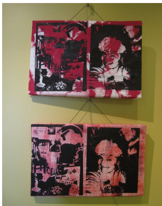
KUVA 5. Omakuva 2.