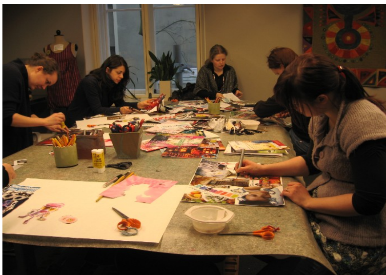
KUVA 3. Kollaasiin työstämistä.

Toisena harjoituksena oli kollaasiin tekeminen omista haaveista, unelmista ja toiveista, joka myös jaoimme yhteisesti. Tulevaisuuden käsittely on oman identiteetin kannalta tärkeää. Tulevaisuuteen liittyy unelmia ja pelkoja oman elämän osalta ja yleismaailmallisestikin. Niillä on vaikutus olemiseemme juuri nyt. Ajatusten näkyväksi tekeminen kirjoittamalla tai kuvallisesti auttaa selkeyttämään omia tunteita ja mielikuvia. Taiteellisen tuotoksen muodossa käsitys omasta identiteetistä ja tarinasta konkretisoituu. Saman aihepiirin toistaminen eri taiteen menetelmin syventää ymmärrystä itsestä ja omasta elämästä. (Sava & Katainen 2004, 35.)