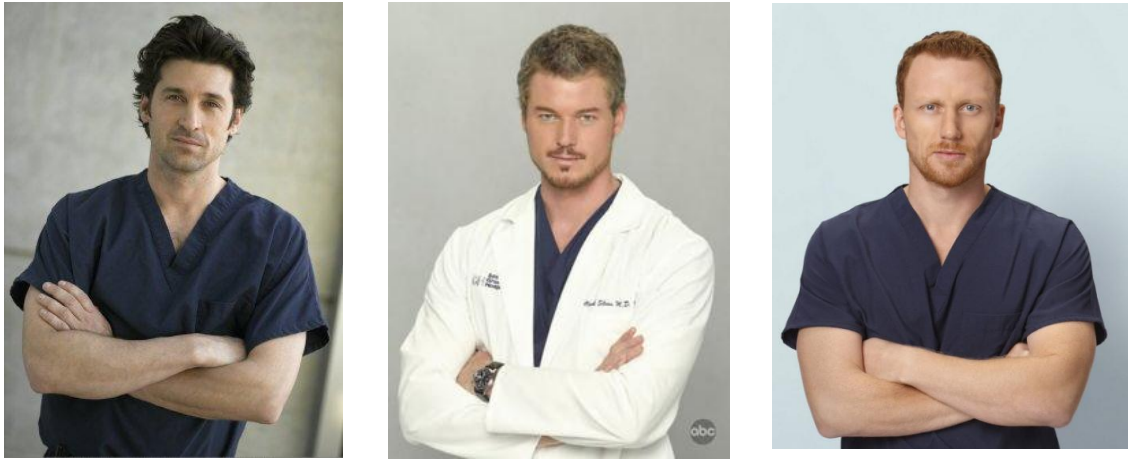
Kuvio 6. McDreamy, McSteamy ja Major McHottie