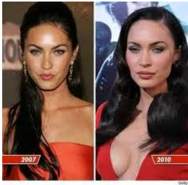
Kuvio 9. Megan Fox.

Tämän opinnäytetyön tarkoituksena on herättää keskustelua myös miesten esineellistämistä elokuvissa. Naisten on turha syyttää miesten elokuvien esineellistävänä naisia, koska naistekijät ovat myös tehneet näin heti ensimmäisen tilaisuuden saatuaan. Olisi hyvä, jos unelmamieshahmo tunnistettaisiin hahmoksi, joka on epätodellinen ja asettaa miehille liian korkean standardin.