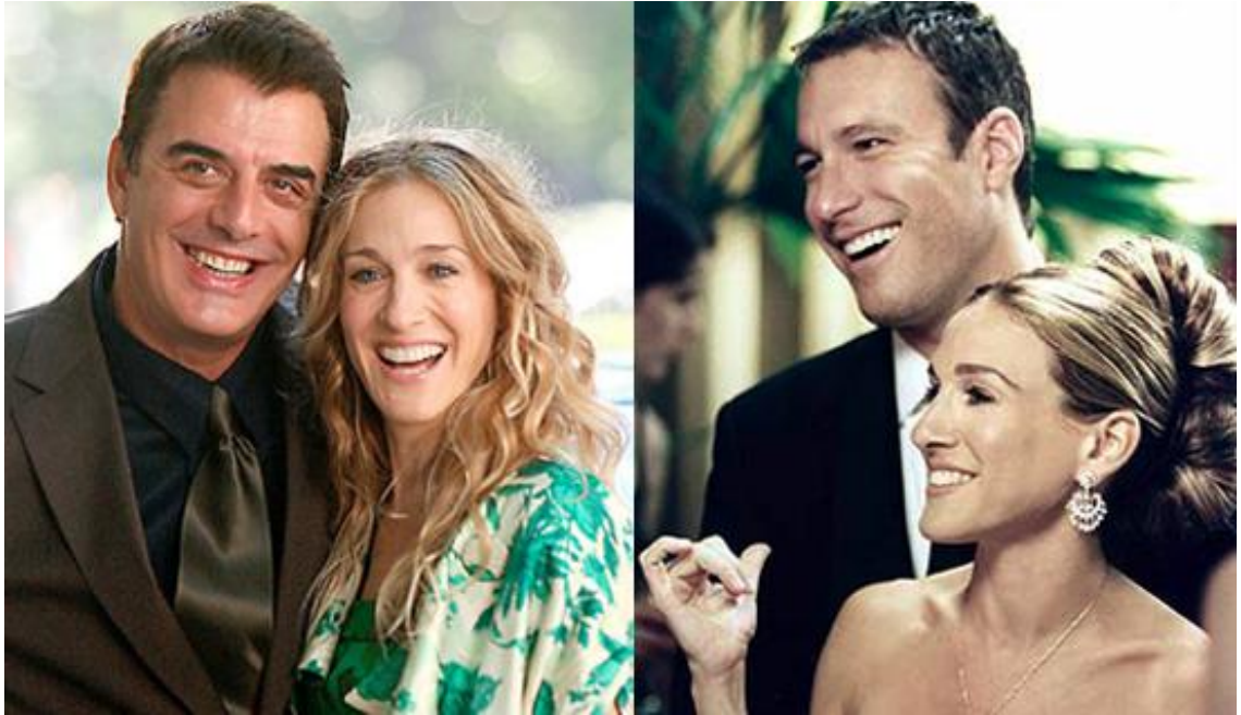
Kuvio 4. Carrie, Mr. Big ja Aidan

Sarjassa Sinkkuelämää on kaksi ihannemies hahmoa, Mr. Big ja Aidan Shaw. Sarjan päähenkilö Carrie seurustelee ensin Mr. Bigin kanssa, sitten Aidanin, mutta päättyy lopuksi naimisiin Mr. Bigin kanssa. Sarjassa on myös muita miehiä, joiden kanssa joko Carrie tai joku muista päähenkilönaisista seurustelee pitemmän aikaa sekä lukuisia miehiä pienissä sivurooleissa yhden jakson ajan.