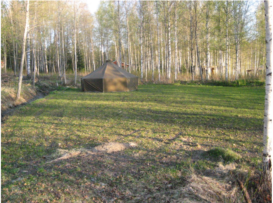
Kuva 1. Leirin majoittautumispaikka.

LIITE 6. Kuvia leiristä. Luvat kuvien esittämiseen kysytty ja saatu.