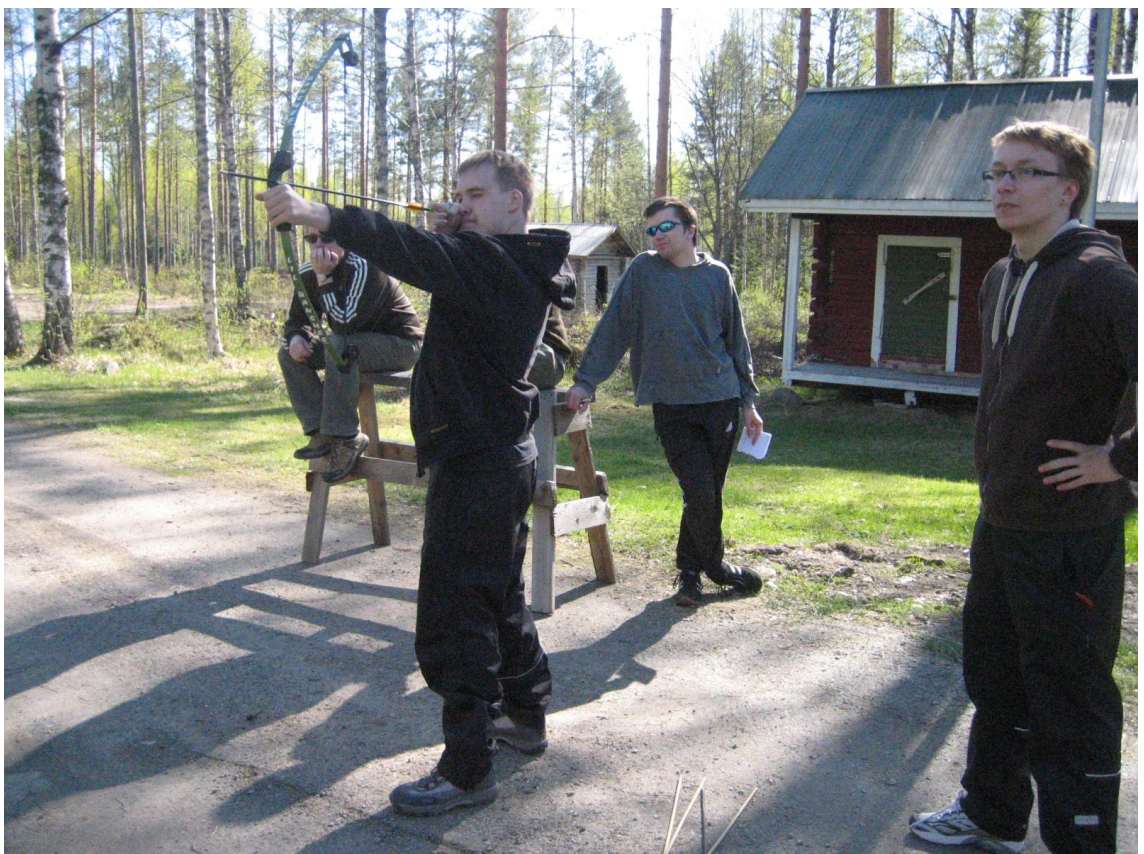
Kuva 6. Tarkkuusammuntaa jousella.