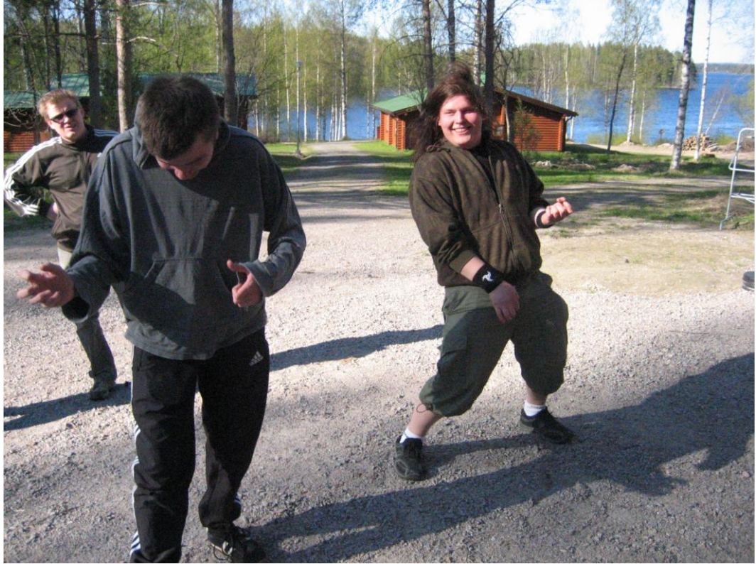
Kuva 7. Kaaospeli. Tehtävänä menossa ilmakitarabändinä kappale Hard Rock Hallelujah.