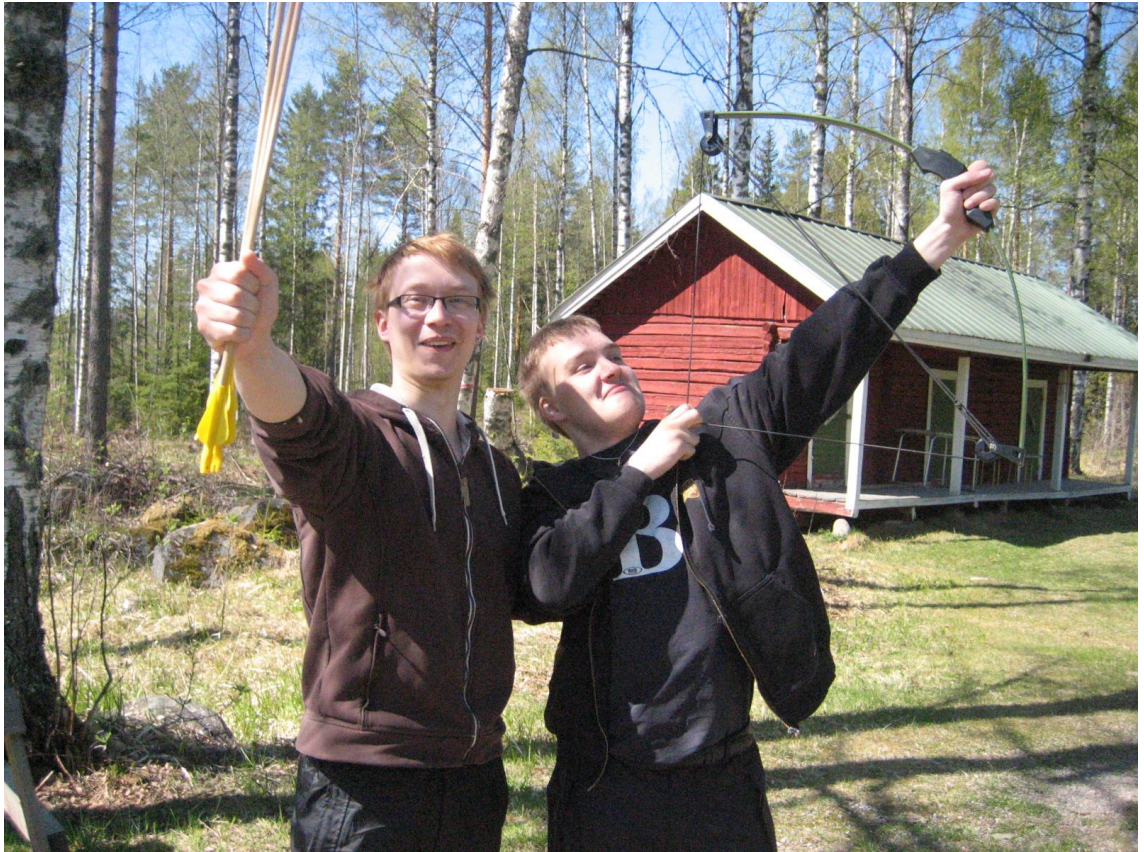
Kuva 5. Pituusjousiammunnan voittajat.