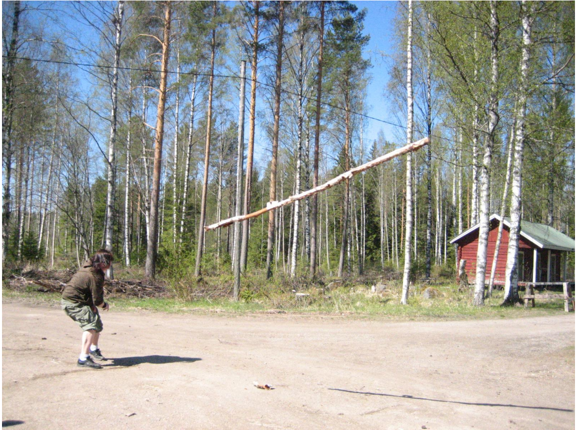
Kuva 3. ”Tukinheitto”.