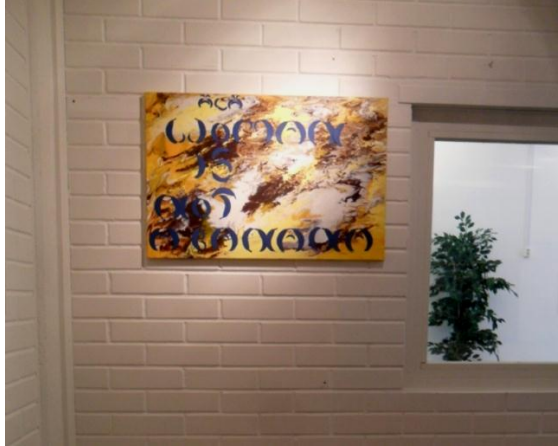
Kuva 19. Woman Is Not a Banana-taulu oli vähällä jäädä nurkan varjoon ripustuksessa.

”Ammattimaisesti rakennetuissa näyttelyissä on tarkkaan mietitty teoskorkeutta, valaistusta sekä teosten etäisyyttä toisiin teoksiin ja myös katsojaan”(Itkonen 2011, 69). Valaistuksen asettelu vei yllättävän paljon aikaa. Minulla oli gallerian jokaisella neljällä seinällä töitä, joten lamppujen säätäminen osoittautui hankalammaksi kuin odotin. Woman Is Not a Banana -taulu oli vähällä jäädä nurkan varjoon väistämättä ja valokuvien kehysten lasi heijasti joka suuntaan hankalasti. Lopputulos oli kuitenkin niin hyvä, kuin tilassa oli siellä olevilla valaisimilla mahdollista saada aikaiseksi.