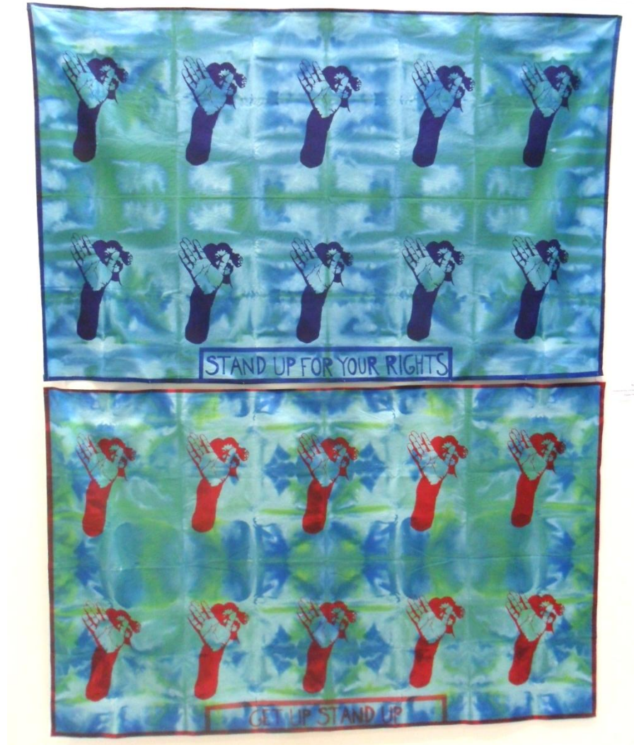
Kuva 4. Valmiit kangat ripustettuina.

kohdista, jotka kalvossa ovat mustia. Painoin kuvaa tasaisesti toiseen kankaaseen sinisellä ja toiseen punaisella painovärillä. Kankaat oli värjätty samalla liemellä, mutta halusin niihin erilaista ilmettä erivärisillä painoväreillä. Teksti olisi myös eri molemmissa, joten pidin ajatuksesta, että ne ovat erilaiset mutta kuitenkin selkeästi pari.