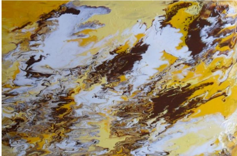
Kuva 15. Juuri marmoroitu taulu.

Lause itsessään oli mielestäni niin iskevä ja moniulotteinen, että halusin sen sellaisenaan liitettäväksi maalaukseen. Päädyin käyttämään sinisestä paperista leikattuja banaanin muotoisia paloja, joista tein kirjaimet. Asettelin kirjaimet ja sanat niin, että sanojen keskelle pystysuoraan tuli sana ”osta”. Vasempaan yläreunaan osta-sanana yläpuolelle lisäsin vielä banaanikirjaimilla sanan ”älä”. Ystäväni ilahtui ikihyviksi keksiessään piilotetun suomenkielisen viestini englanninkielisen lauseen yhteydessä. Itse koen iloa näyttelyissä löytäessäni teoksista joitain yllättäviä seikkoja.