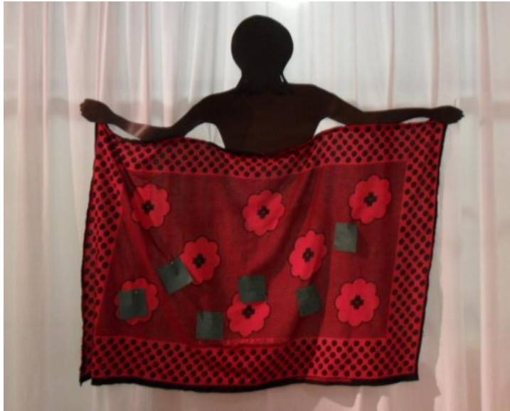
Kuva 1. Halusin persoonallisen tavan palautteen keräämiseen perinteisen vieraskirjan sijaan. Tekemäni kangaa pitelevä nainen sopi näyttelyyn ja toimi lähes yhtenä teoksena itsekkin.

nuun lähtemättömän vaikutuksen: ”Sikuanza mimi la ajabu nini?” Suomeksi teksti tarkoittaa: ”Aloitin päiväni miettimällä, miksi?”