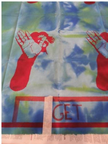
Kuva 6. Tekstin painamista varten tein sabluunan litoposter-paperista.