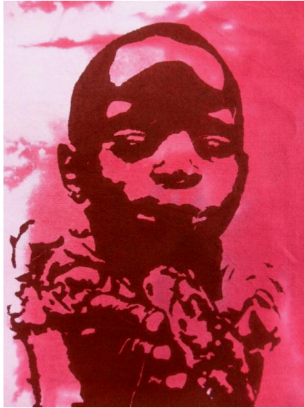
Kuva 9. All the Paulinas - printti läheltä.