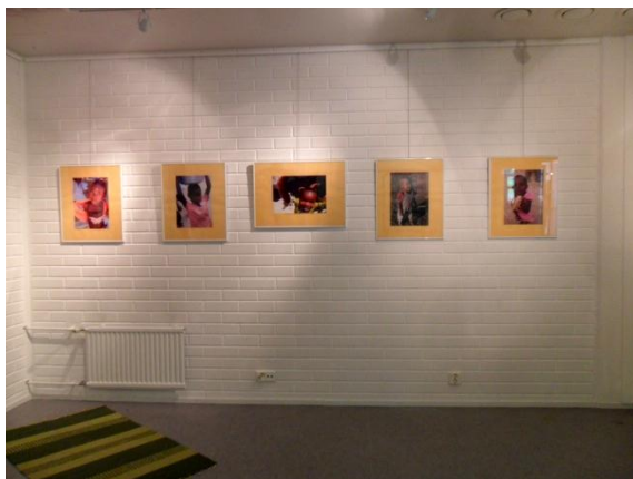
Kuva 18. Valokuville paras ripustus oli laittaa ne tasaiseen riviin.