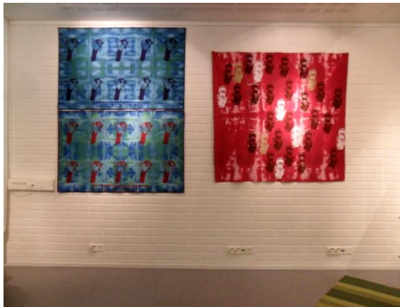
Kuva 17. Rise-kangat näyttivät parhaalta allekkain ripustettuina. All the Paulinas -kangas sopi hienosti niiden viereen.