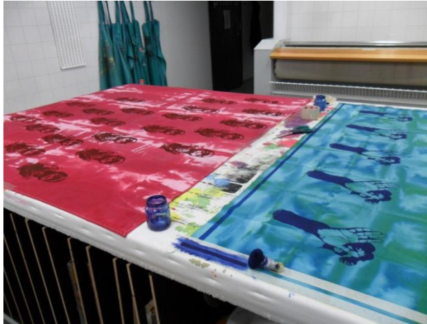
Kuva 5. Kangojen reunat ja tekstit tein tuputtamalla painoväriä maalarinteipillä rajattuihin kohtiin.