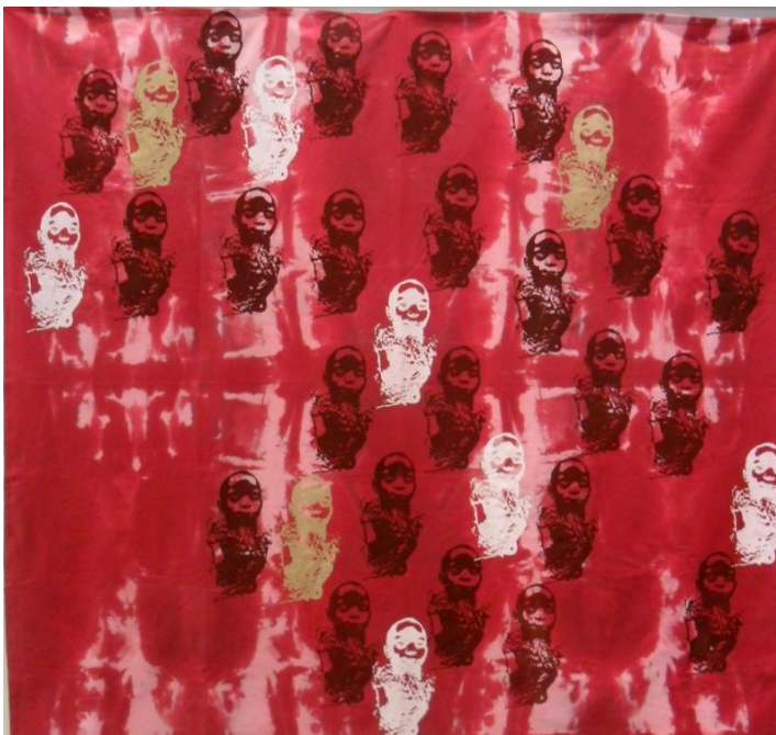
Kuva 8. Kun kangasta katsoo matkan päästä, voi huomata hahmojen olevan rytmitetty Afrikan kartan muotoon. Työn ajatus kokonaisuudessaan on yhteisöllisyys, hyväksyntä, tasa-arvo ja toivo.