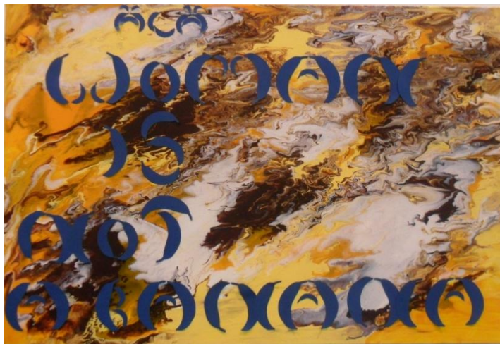
Kuva 16. Hullaannuin lopulta Woman is not a banana -ilmaisuuun niin paljon, että päädyin nimeämään sekä näyttelyni että opinnäytetyöni tällä lauseella.

Lause itsessään oli mielestäni niin iskevä ja moniulotteinen, että halusin sen sellaisenaan liitettäväksi maalaukseen. Päädyin käyttämään sinisestä paperista leikattuja banaanin muotoisia paloja, joista tein kirjaimet. Asettelin kirjaimet ja sanat niin, että sanojen keskelle pystysuoraan tuli sana ”osta”. Vasempaan yläreunaan osta-sanana yläpuolelle lisäsin vielä banaanikirjaimilla sanan ”älä”. Ystäväni ilahtui ikihyviksi keksiessään piilotetun suomenkielisen viestini englanninkielisen lauseen yhteydessä. Itse koen iloa näyttelyissä löytäessäni teoksista joitain yllättäviä seikkoja.