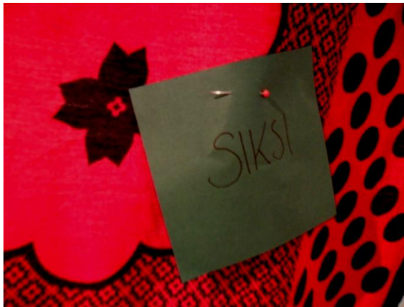
Kuva 20. Joskus yksi sana riittää palautteeksi.

Perehdyin taiteen merkityksiin taiteilijan, teoksen ja katsojan välisissä kanssakäymisissä ja vuorovaikutuksissa. Toimivatko näyttelyssä olleet teokseni omien ajatusteni, tunteideni ja tarkoitusteni siltana katsojille? 23 vierailijaa jätti palautetta ja kommentteja palautekangaan. Lähes jokaisessa saamassani kommentissa oli kuvattu näyttelyn herättämiä ajatuksia ja tunteita. Palautteesta päätellen työni saavuttivat tarkoituksensa ja sain välitettyä kävijöille, mitä halusinkin välittää, eli palasia tansanialaisten naisten elämistä, jotka eroavat hyvin paljon meidän länsimaisten siskojen kohtaloista ja mahdollisuuksista. Tässä joitain lainauksia saamistani palautteista: