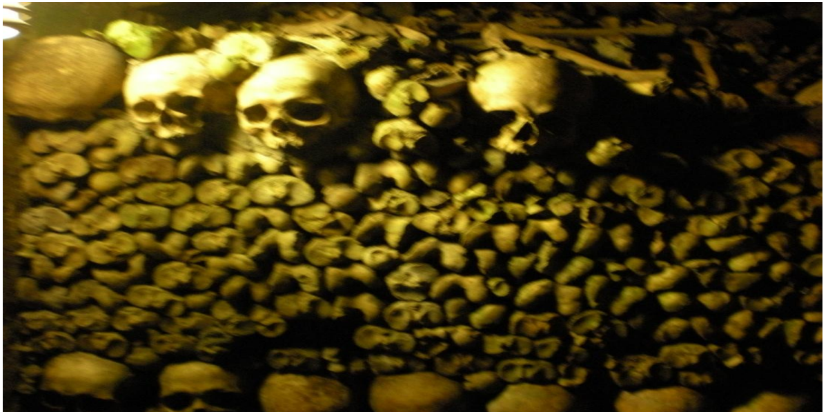
Kuvio 5. Les Catacombs. (Järvelä S-M. 2008.)

Päivällä on vapaata tutustumista kaupunkiin. Päivän aikana voi tutustua ostosmahdollisuuksiin tai vaikkapa kierrellä pienempiä museoita kuten Musée Picasso tai Musée de l'Armée. Yksi Pariisin pelottavimmista ja mielenkiintoisimmista paikoista on Les Catacombs (Kuvio 5.), joka sijaitsee Pariisin alla ja siellä sijaitsee 6 miljoonan pariisilaisen jäänteet.