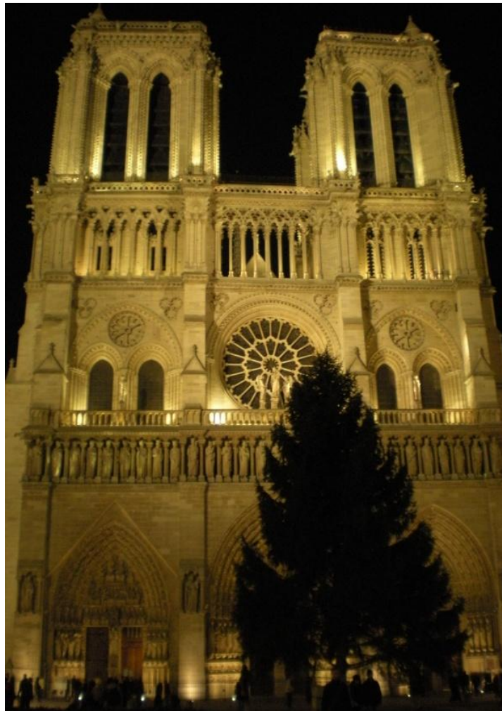
Kuvio 4. Notre Dame. (Järvelä S-M. 2008).

Päivä Pariisissa. Kaikille halukkaille järjestetään hieman erikoisempia tapa tutustua pääkaupunkiin. Tarjolla on ranskalaisen autotehtaan klassikko 1930-luvulta eli Citroën 2CV, jonka kyydissä pääsee tutustumaan nähtävyyksiin. Illalla tarjolla maittava illallinen Restaurant Cab:issä, Palais Roaylissa.