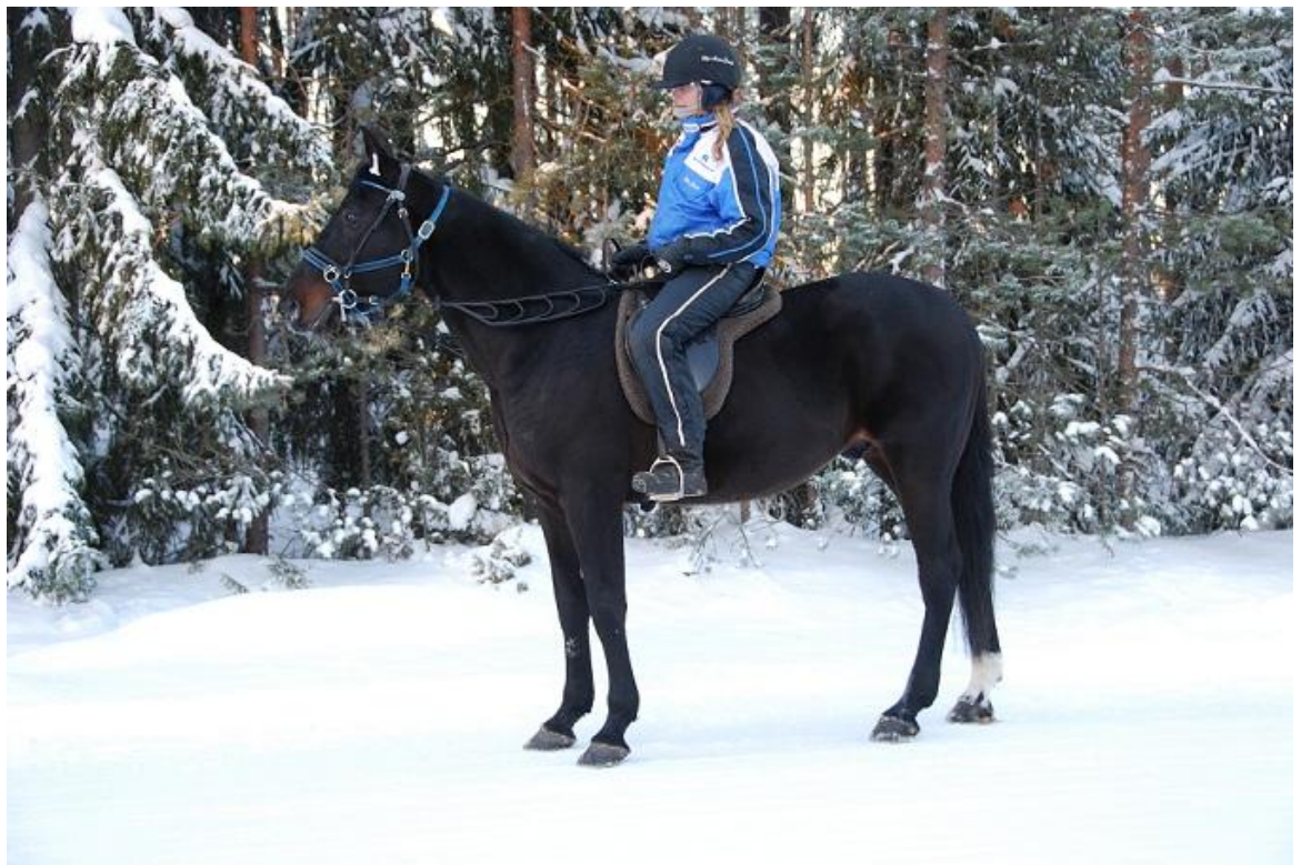
KUVIO 2. Lämminverinen H P Paque Finlandia-ajon voittaja (Järvelä S-M, 2008).

Ominaisuuksiltaan lämminverinen on kevyt, nopea ja vauhtikestävä suoritushevonen, joka antaa kaikkensa kilpailussa. Rakenne on sopusuhtainen ja luonteeltaan se on taipuisa ja palvelualtis. Lämminveristä jalostetaan joko puhdassiitoksella tai eri lämminverirotuihin kuuluvien risteytyksellä, jotta se soveltuisi paremmin ravihevoseksi. (Suomen Hippos Ry, 2004.)